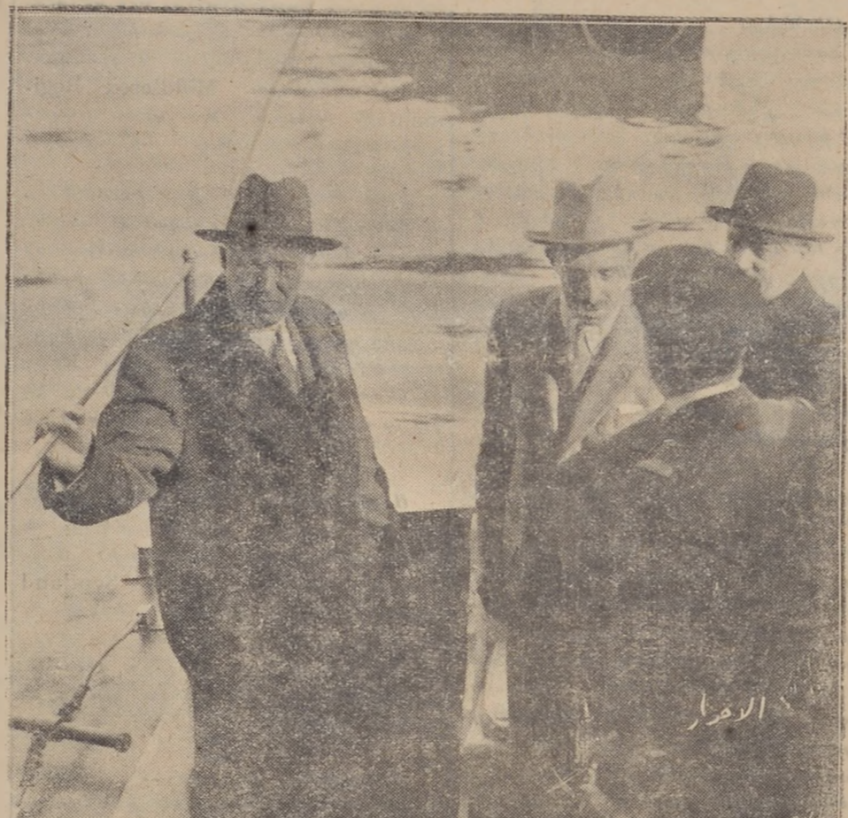
Ն. Վ. Ալեքսիս քաղաւոր «Թիօքի կօթնով Պէյրութի հաւանագիտք մասն միջոցին