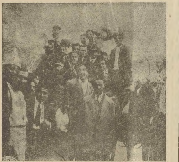
Ուսանողներ կառուցելու վրայ հեծած համալսարանի դեմ կը ծառեն