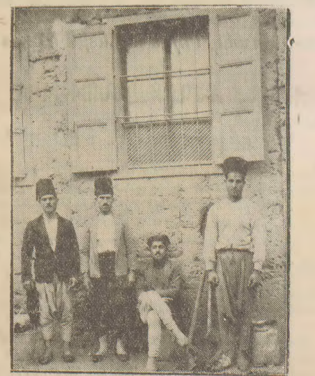
Խանութեան կը փորձեն խալի Ղազարի ջրնորը