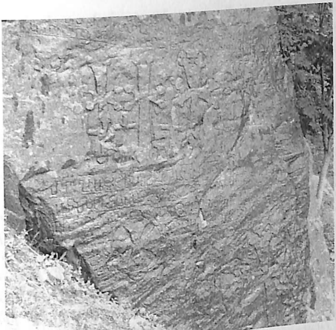
Առաջածորի արձանագրութեան քարը