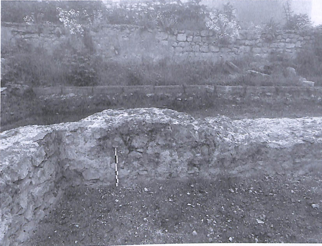
Նկ. 7 - Սուլաղի հետքեր եկեղեցու պատերի վրայ