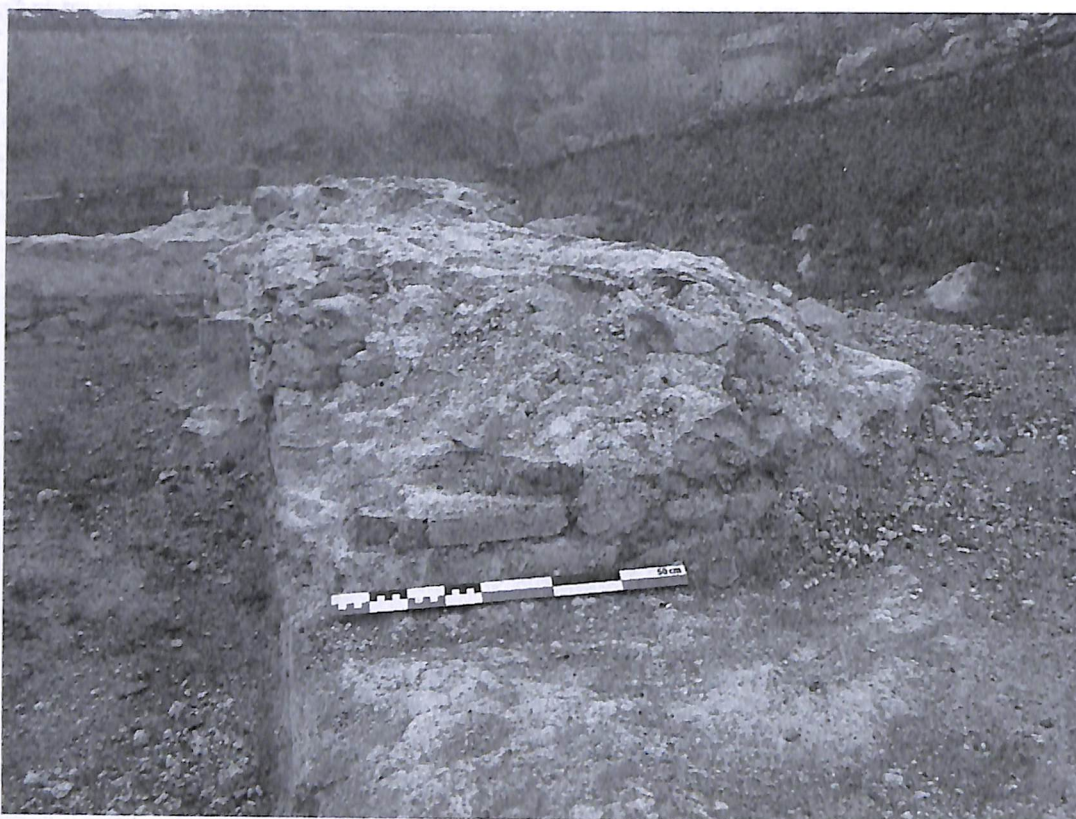
Նկ. 5 - Արեւմտեան դռան բացուածքի աղիւսէ շարը