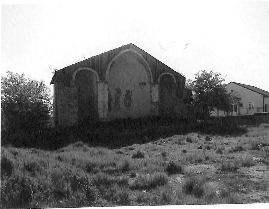
Նկ. 1 - Եկեղեցու ընդհանուր տեսքը պեղումներից առաջ