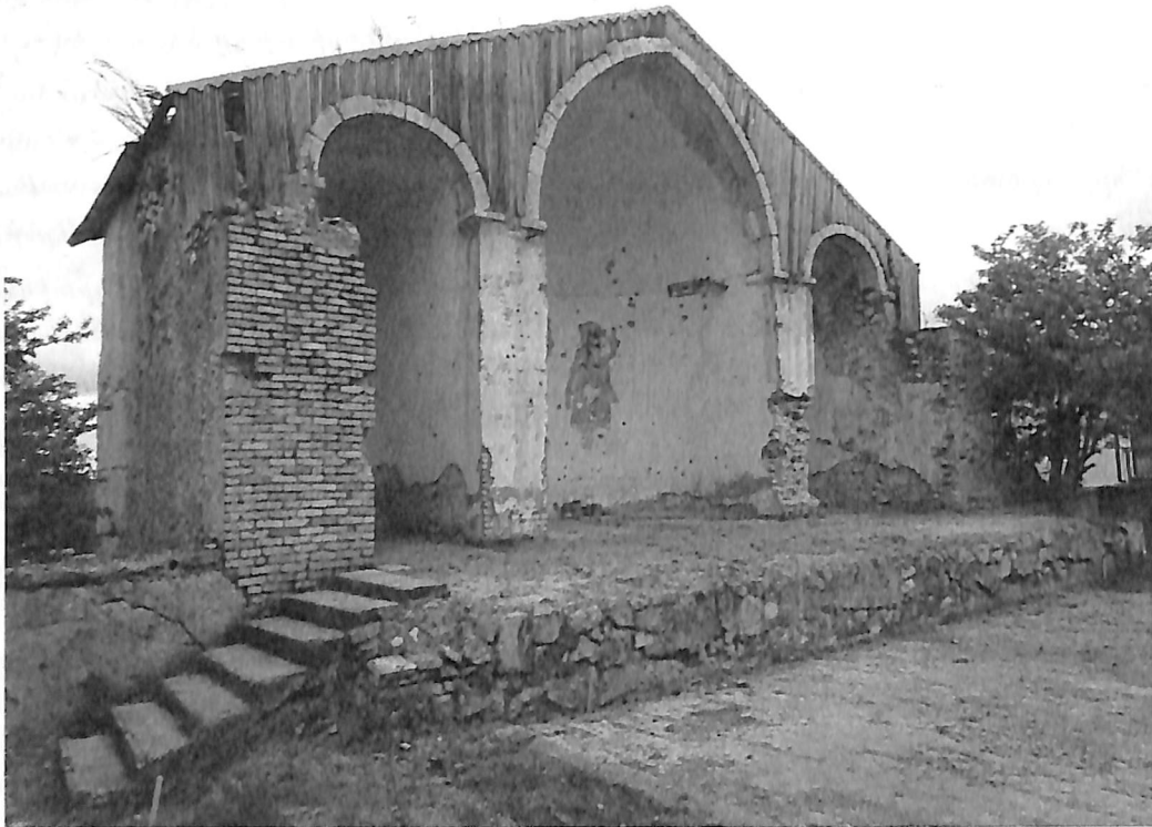
Նկ. 2 - Եկեղեցու խորանը եւ երկու աւանդատները