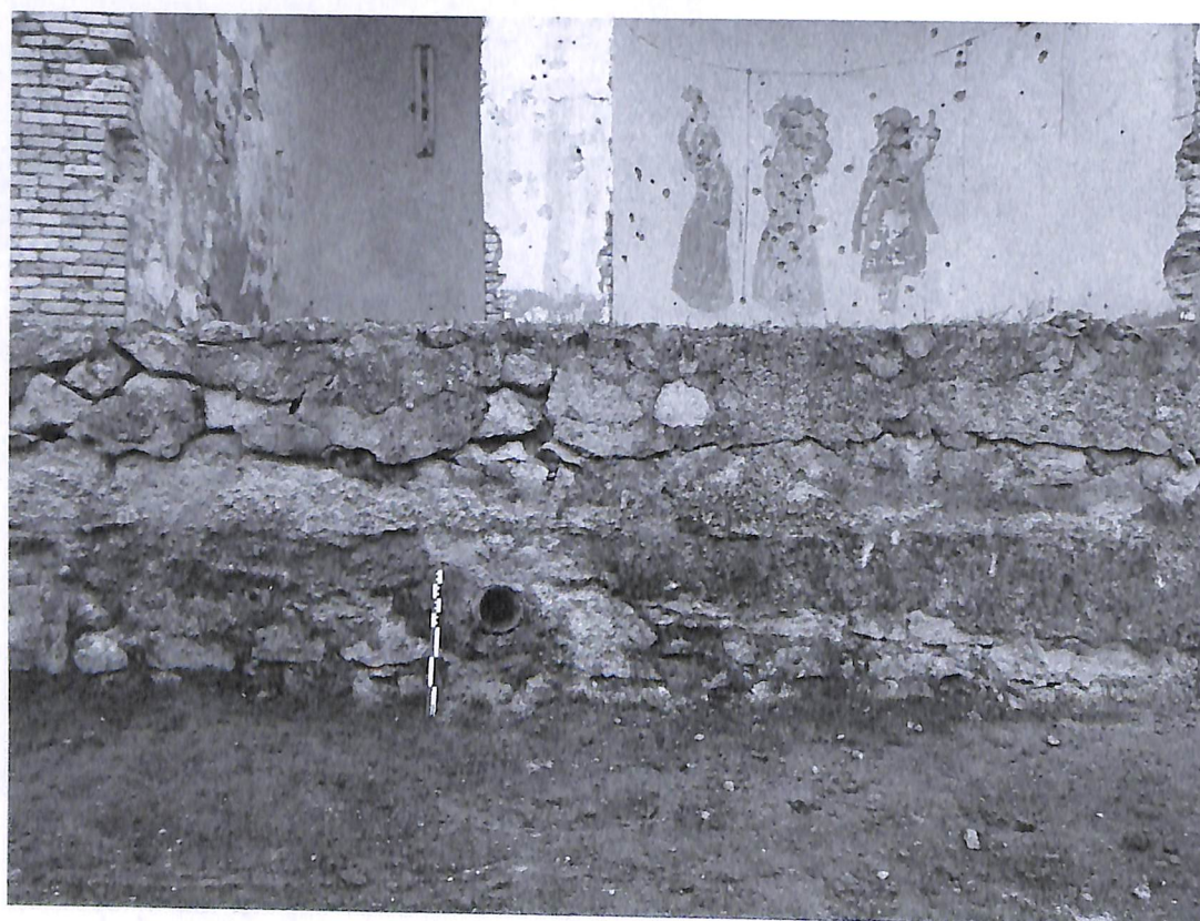
Նկ. 6 - Բեմի տակով անցնող խողովակը