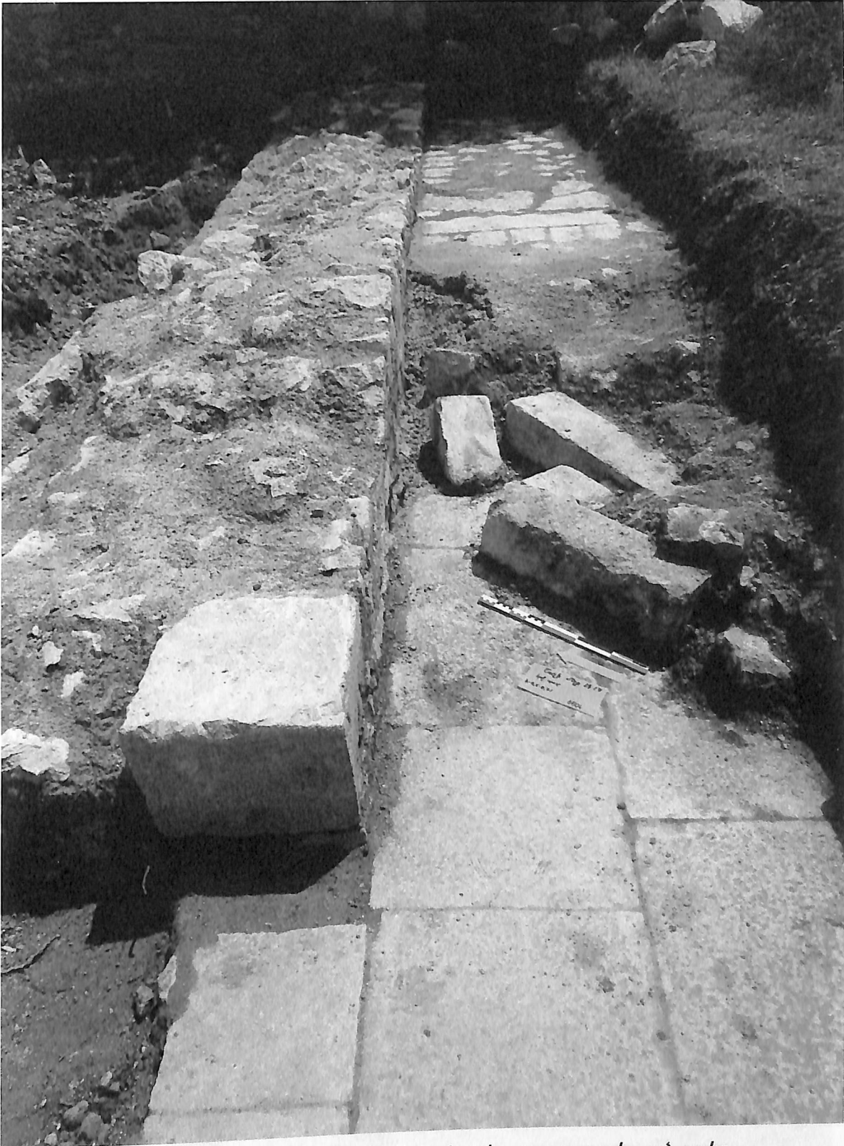
Նկ. 4 - Հարաւային մուտքի սրբատաշ եզրերը եւ սալայատակուած բակը