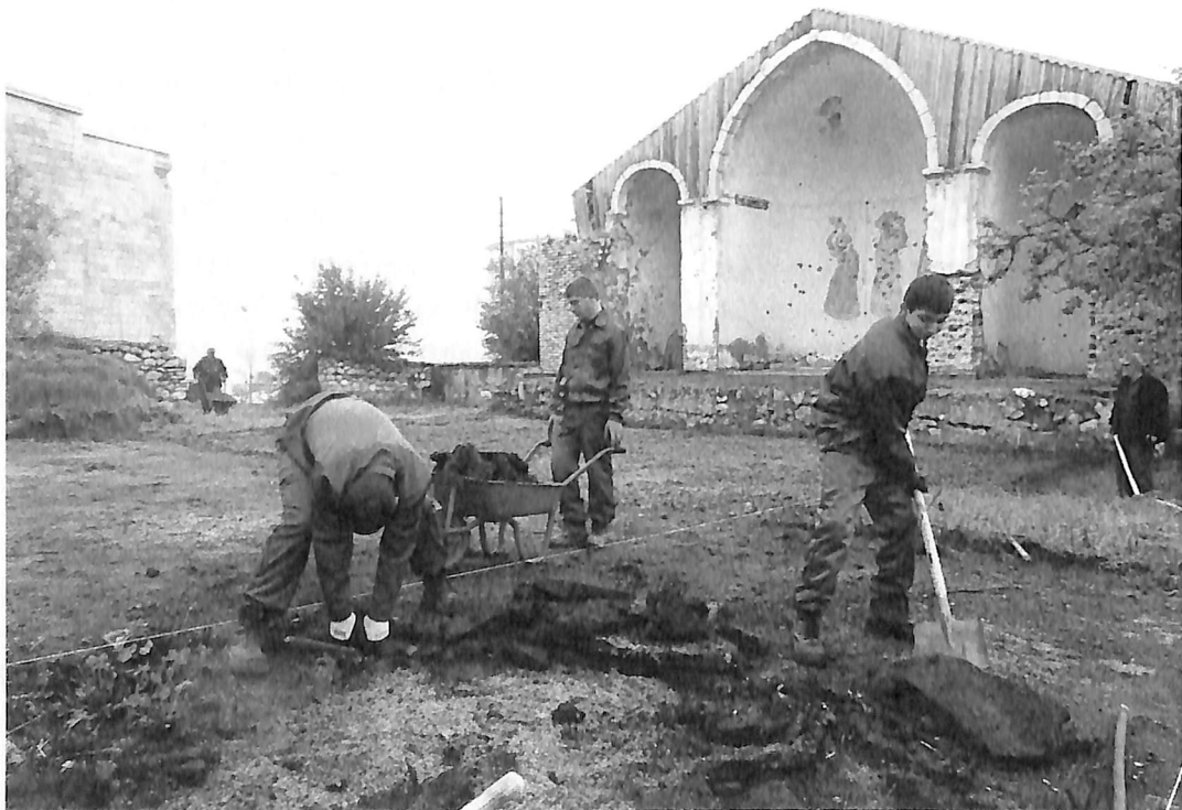
Նկ. 3 - Եկեղեցու տարածքի ասֆալտի շերտի հեռացման աշխատանքները