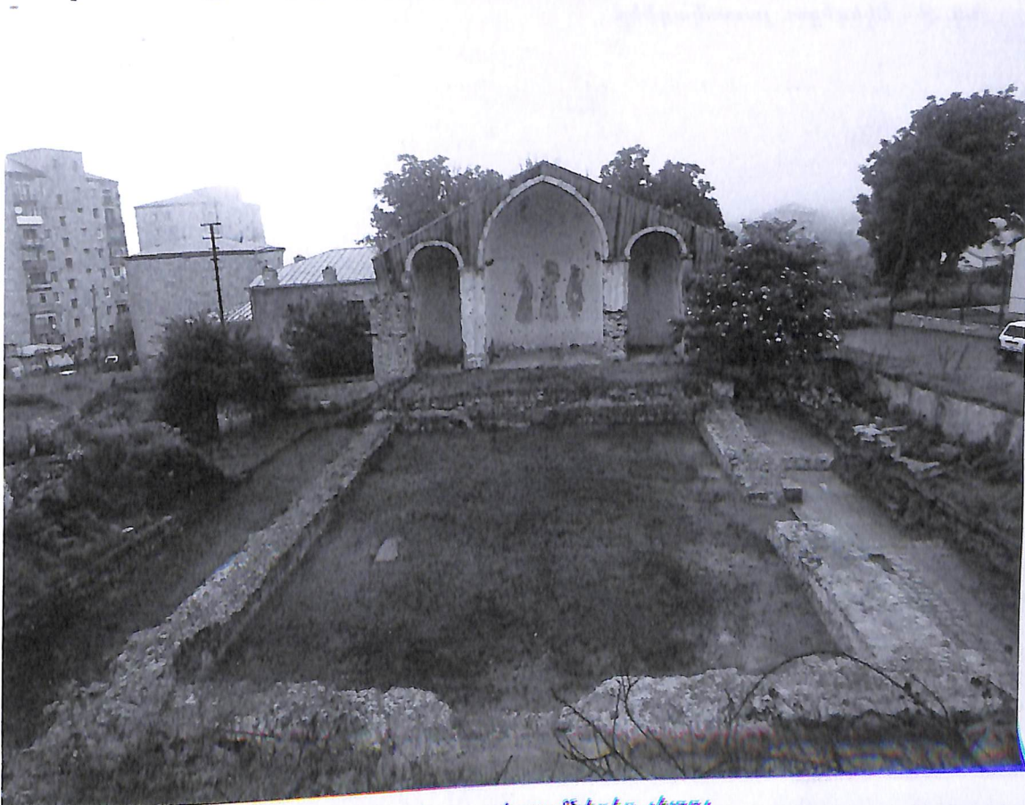
Նկ. 8 - Եկեղեցու ընդհանուր տեսքը պեղումներից յետոյ