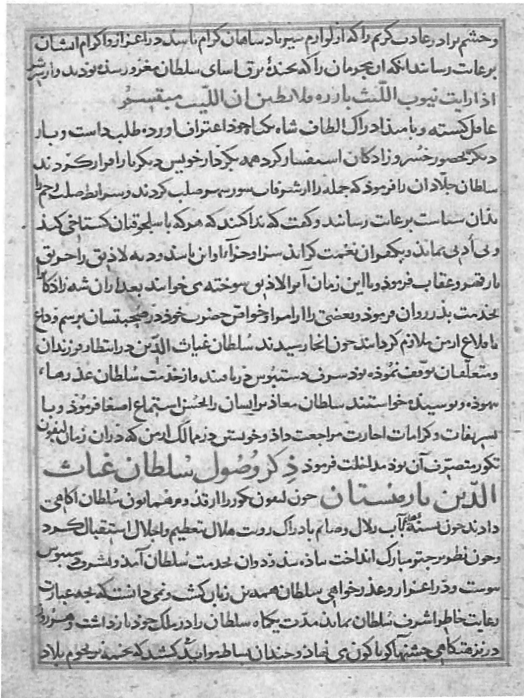
Պատկեր 3. Ստամբուլի Սուլեյմանիյե գրադարանի Այա Սոֆիայի Հավաքածուի՝ Իբն Բիբի երկի ամբողջական տարբերակի միակ պահպանված թիվ 2985 ձեռագրի 20բ էջը, որտեղ սկսվում է Հայոց արքունիք սելջուկ սուլթանի Հյուրընկալության մասին պատումը: