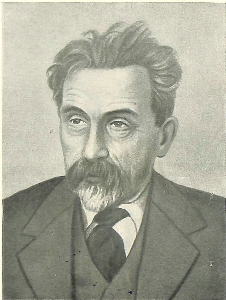
Академик Н. Я. Марр