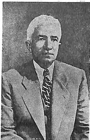
Յորեկեանիս տարին, 1950