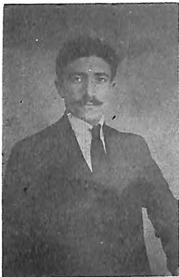
1920-ին, Այնթապէ ելփիս