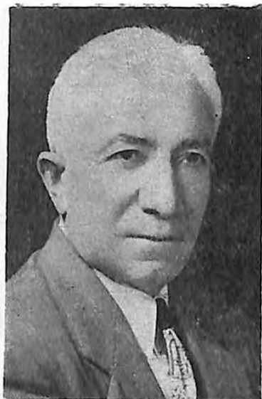
1957-ին, Հալէպ (Պէյրուք գաղթի տարիս)

ներու եւ նոր Այնթապ ասան մը ունենալու յետին ծրագրով որոնք յաջողութեամբ պրակուեցան :