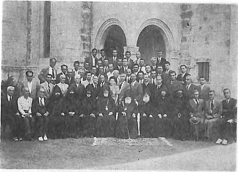
Սուրիահայ և Լիբանահայ Ուսուցչական Միութիւններու Համագումար, Անքիլիսա, 1966, ընդ նախագահութեամբ Էրջանկայիշատակ Գարեգին Կոթղ. Յովսէփեանցի :

Որպէս խմբադիր հսկած եմ պաշտօնավարած մայրե- րուս մէջ յոյս բնծայուած ձեռագիր կամ խմորատիպ թեր- թերու (ձիւնի՝ Այգ, Հալէպ՝ Լոյս, Կեանք) իսկ պատաս- խանատու խմբադիրներէն էի Ուսուցչական Միութեան Բու- րատան Երկամսեային, տղայեր (1950-1957) : Վեթերան Անգամ Եղած եմ Հ. Բ. Բ. Մ.ին : Նոյն Միութեան Կրթա- կանին և Շրջանակայինին անդամակցած եմ Հալէպ, 1945- 1949 և 1951-1955 տարիներուն : Հ. Բ. Բ. Մ. և Կրթատի- րաց գործակցարար Երեսնամեայ ուսուցչական կեանքիս Յո- րեկանը տօնեցին 1950-ին և հրատարակեցին 1929-1950-ի Հուսկ Բանձերս : 1970-ին պարզեւտարուեցայ Կիլիկիոյ Կաթողիկոսարանին Ս. Մեսրոպի շքանշանով, Ուսուցչաց Օրուան տօրիթով, ձեռամբ ՎԼՏ. Խորէն Կաթողիկոսի :