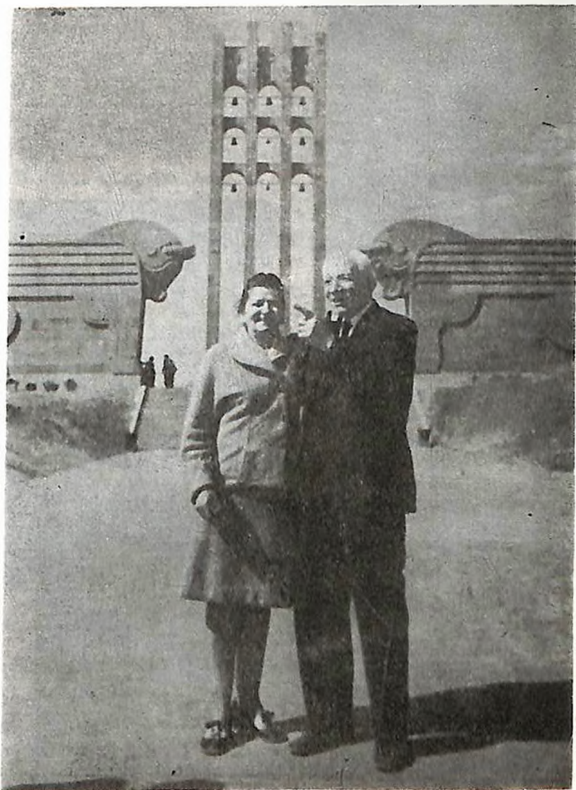
Հայաստան, Մարդարապատ, 1970