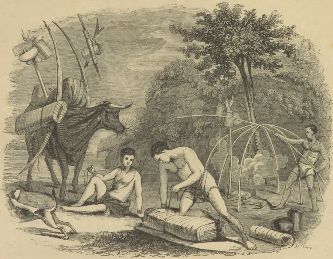
ՃԻՆՆԻՊԻ ԱՅՐԻԳԱ ՊԷԵԱԶԼԱՐԸ

Շու ֆըգըալարը, իհթիմալ քի էր- պապը միւթալէատան չօգլարը մի-