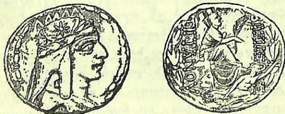
Տիգրան Աւրաքանուոյ գրամ

Եթէ պատմական տեղեկութիւն մ'ալ ուզենք աւելցնել ի հաշիւ Մեծին Տիգրանայ, հրաւիրելով սրամտագունի մը ուշադրութիւնն այն պարագային վրայ, որ երբ Տիգրան Վերին Հայաստանի մէջ կը գտնուէր, զբաղած Գառնոյ բերդին շինութեամբ, Լուկուլլոս զրթելով բարեկամութեան, իր կտորած դերքը շտկելու համար Հոռմի Ծերակոյտին առջեւ, գաղտագողի կը յարձակի Տիգրանակերտի վրայ, և յոյներու մատնութեամբ կ'առնէ քաղաքը. բնակիչներէն շատը բերուած էր փոքր Ասիայէն, տոգոհ իրենց կեանքէն՝ կը լքեն քաղաքը և Լուկուլլոս կը հըրդենէ, կտրելով Տիգրանի յոյսն անդրէն շէնցնելու: Ապերախտութիւն անհամեստ պարզեց փորի փոնթերը. բայց Ծերակոյտը չխաբուեցաւ, և խայտառակարար ետ կոչեց Լուկուլլոսը 1 , և տեղը զրկեց Մեծն Պոմպէոս, որ գտաւ Տիգրանը ոչ թէ թշնամի՝ այլ բարեկամ (նիզակակից) Հոռմայեցւոց, և վերահաստատեց խաղաղութիւնը: