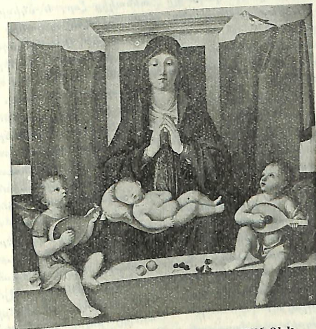
ԱՍՏՈՒԱԾԱՄԱՅՐԸ ԵՒ ՅԻՍՈՒՍ ՄԱՆՈՒԿ

Հագիւ Կ. Պոլսի աթոռը բարձրացած, 428ին (Ապրիլ 10) Արիստականներու և Ապոլինարեանց դէմ մղած բուն հալածանքին մէջ արդէն սկսաւ իր քրիստոսաբանական մո-