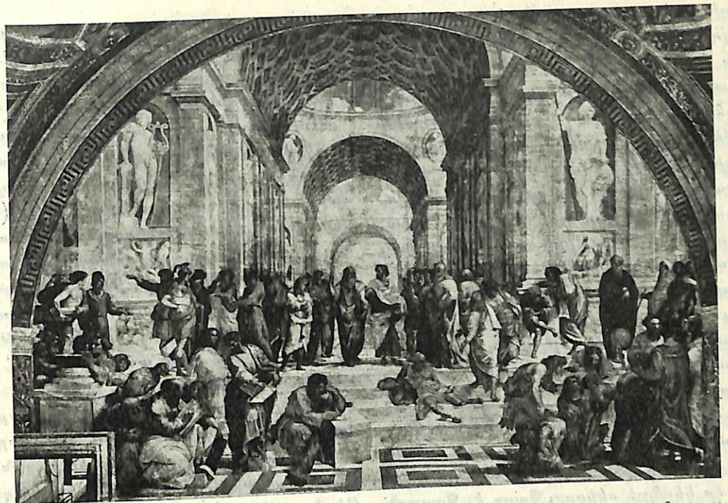
(Հոմ - Վ. ատիկան)

Պլատոն իր արտայայտած միջեւ այսօր ապրող արուեստի կամ գրականութեան առողջ մտքերուն հետ արտայայտեց նաեւ հիւժախտաւորներ, ճղճիմ կենսունակութիւն մը քաջքող, ու նաեւ անհեթեթներ եւ կամ գոնէ ներկայ քննադատական պահանջկոտ հոգիին նկատմամբ անտեղութիւններ: «Նկարչութիւնը կը պատկանի երեւոյթի նմանութեան, ան կը հետեւի կարծիքին ինչպէս ստիստ մը, եւ ոչ ճշմարտութեան ինչպէս փիլիսոփան»: Այսպէս Պլատոն կը դատապարտէ ոչ միայն իր ժամանակի նկարչութիւնը այլ նաեւ բոլոր դասական արուեստի ձգտումները մինչեւ եօթը դար: