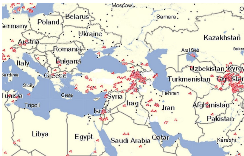
Քարտեզ 1. Հին Աշխարհի հիմնական ժայռապատկերային հնավայրերը

րային հնավայրերն անհամեմատ շատ են Հայկական լեռնաշխարհում, որի մերձակայքում հնագույն ժայռապատկերները քիչ են, մինչդեռ ներսում դիտվում է դրանց գերկենտրոնացում, թեմային ու տեսակային բազմազանություն: Այստեղից դեպի Փոքր Ասիա, Միջերկրածովք, Արևմտյան Եվրոպա, Սկանդինավիա, Սիբիր և Կենտրոնական Ասիա, Իրանական բարձրավանդակ, Միջագետք, Արաբական թերակղզի, Հյուսիսային Աֆրիկա ուղղություններով զգալիորեն պակասում է թե՛ տարածական բաշխման խտությունը, թե՛ հնավայրերի թիվը և թե՛ դրանցից յուրաքանչյուրում պատկերների քանակը, նվազում է հատկապես՝ բովանդակային և ոճատեխնիկական բազմազանությունը (քարտեզ 1):