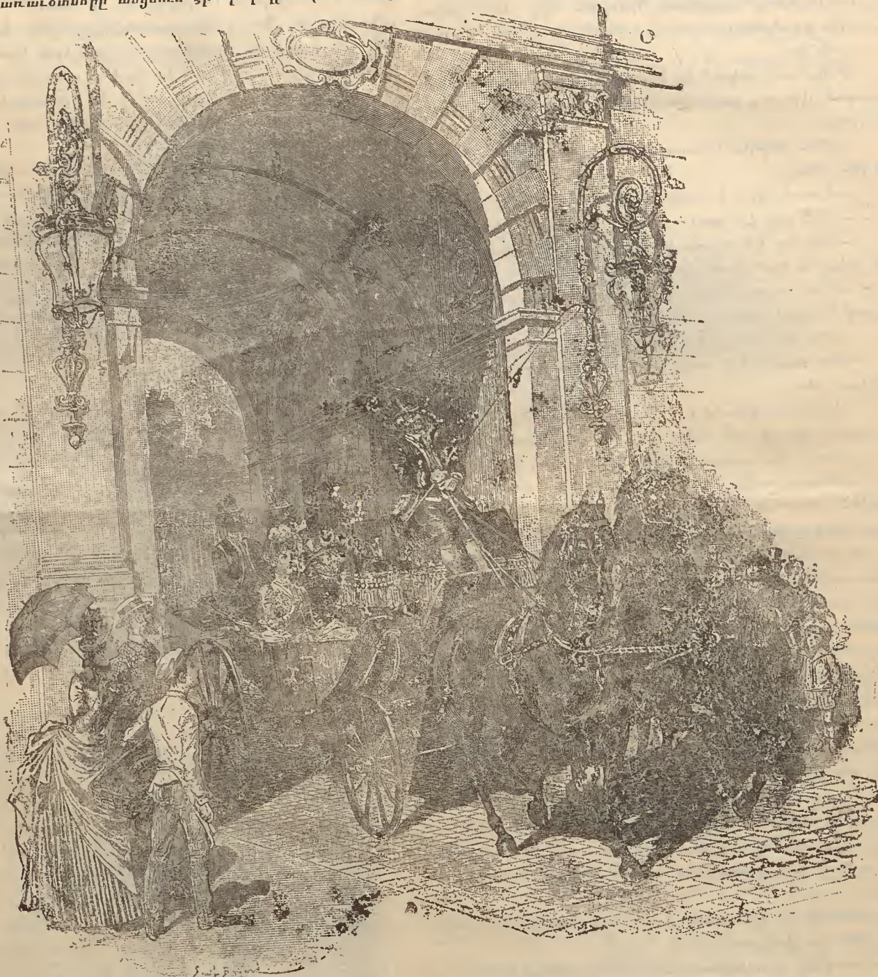
Վարրիէլը իր հօր հետ:

— Քո կարողութիւնով դու կարող ես ընտրել ու-