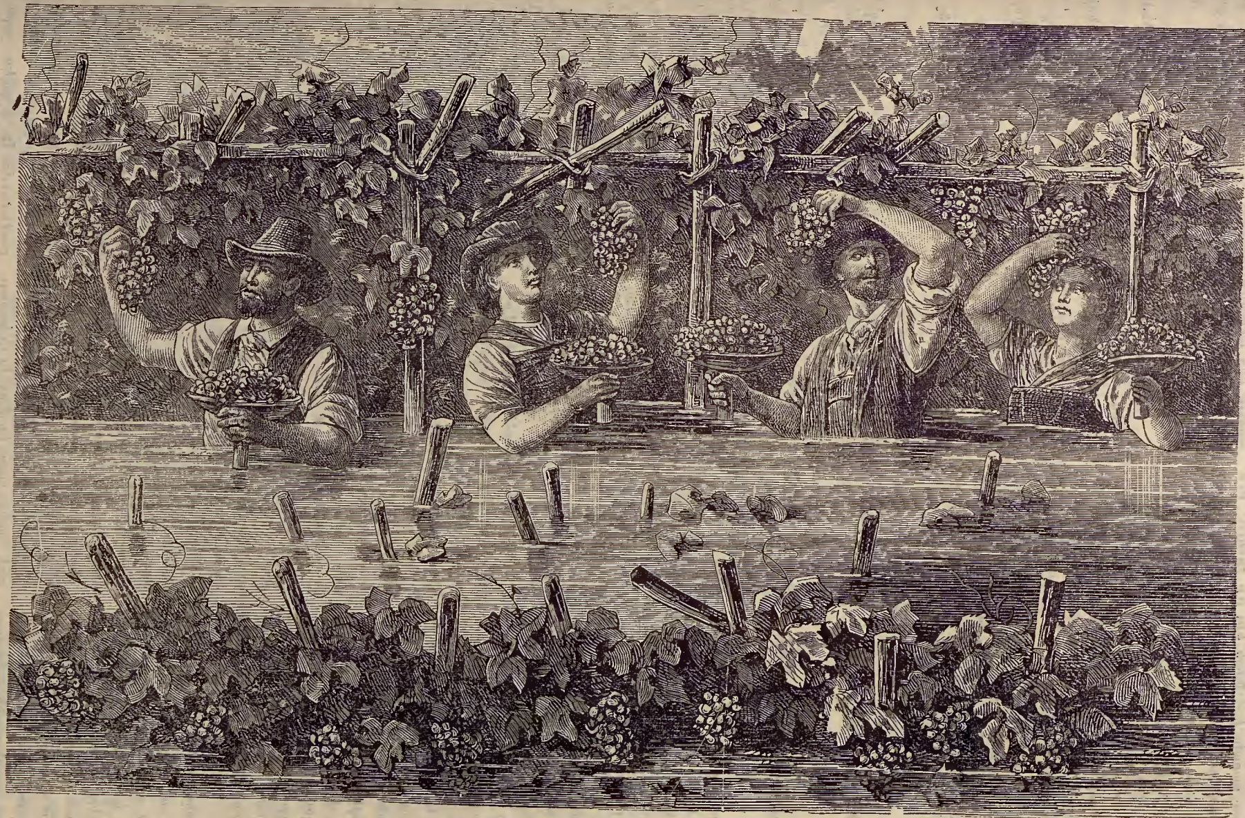
Այգեբաղ. Բէյն գետի ափերում.