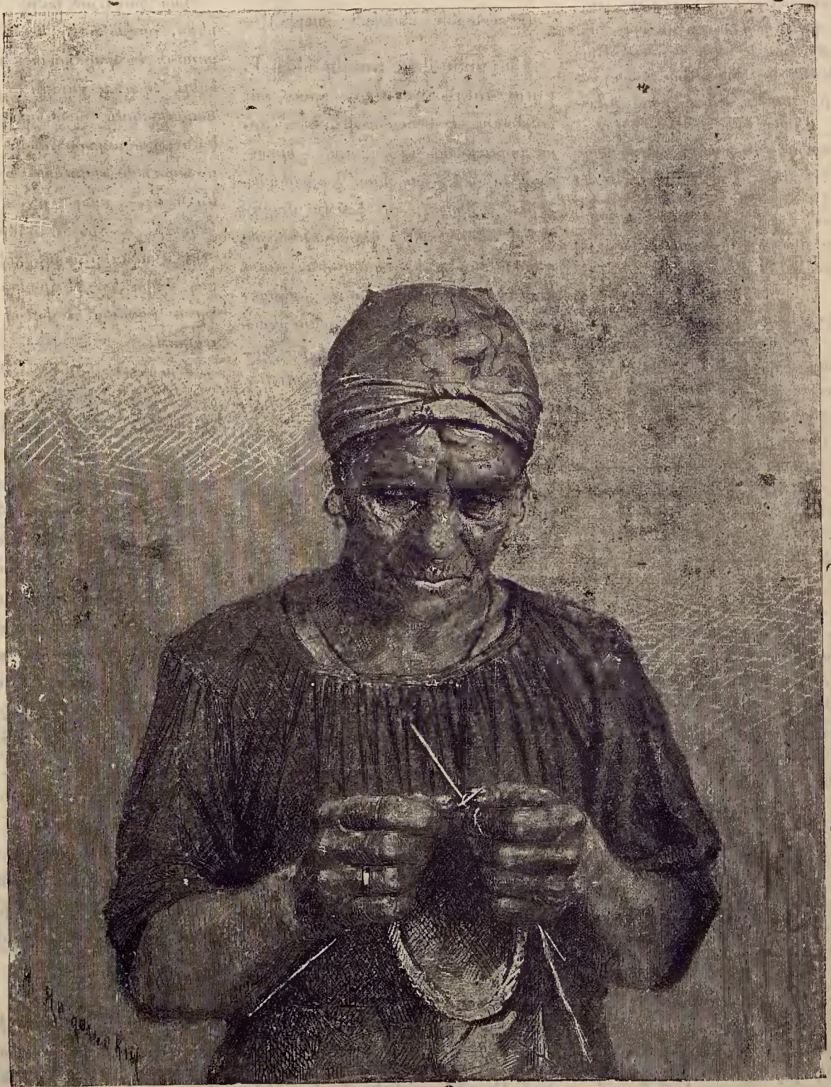
უ ქ ა მ ს ა მ რ ს ა ს ე