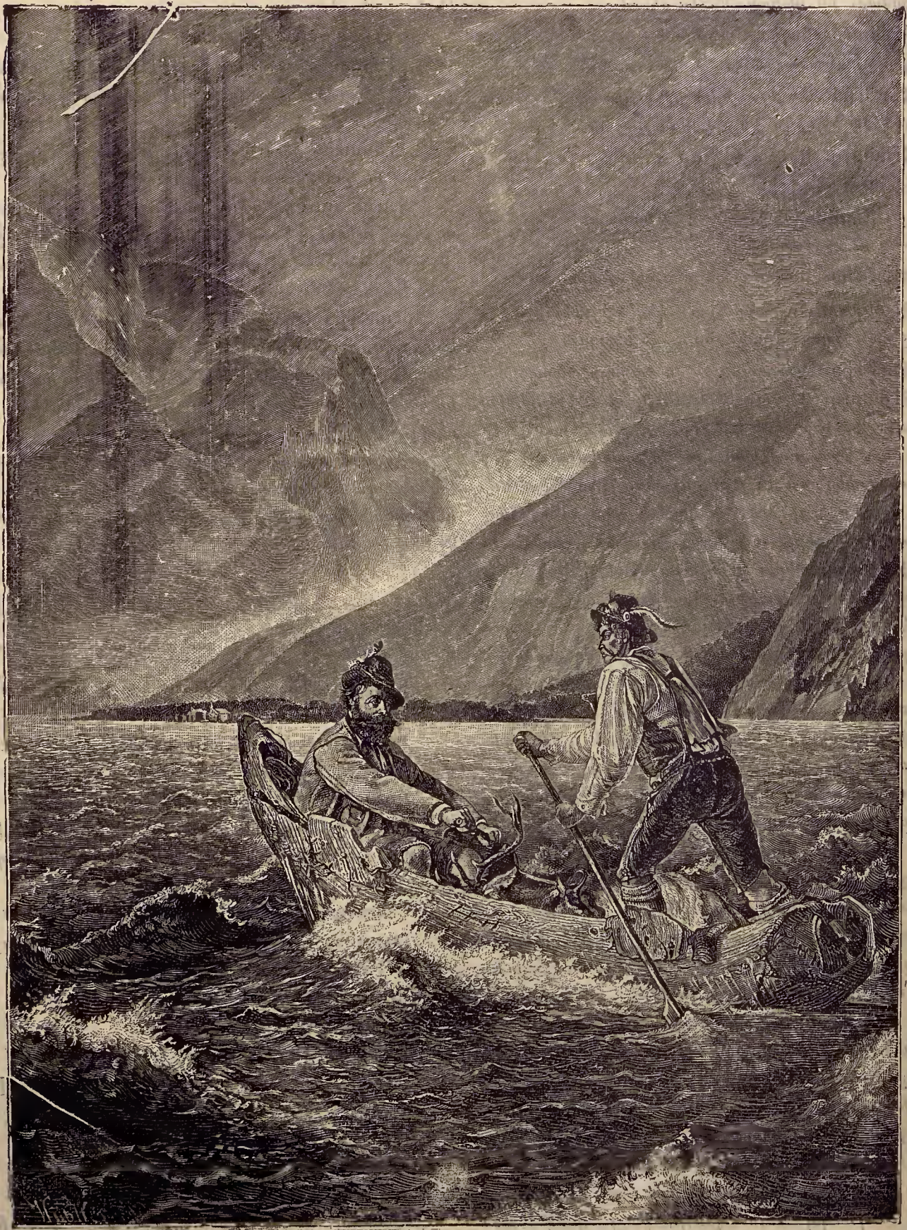
Ի ս ա լ ա կ ա ն ի կ ե ա ն է ի ց