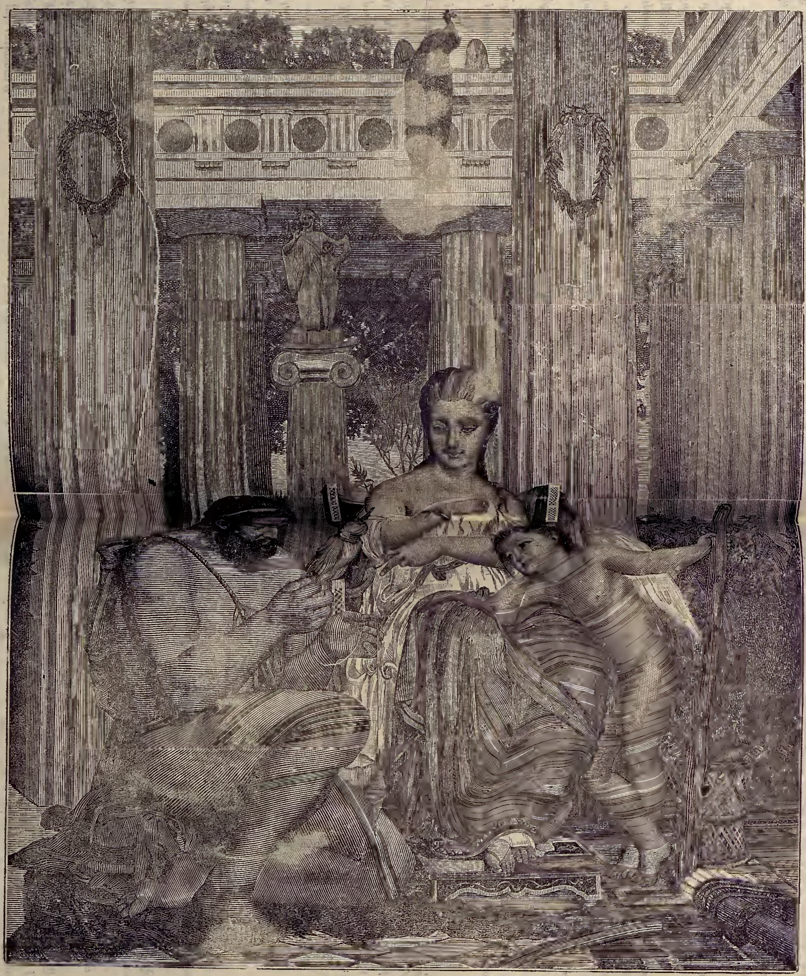
ԱՇԽԱՏՈՒՐԻՆ ԵՒ ՎԱՅԵԼՆՈՒՐԻՆ

[Faint, illegible text from the reverse side of the page is visible through the paper.]