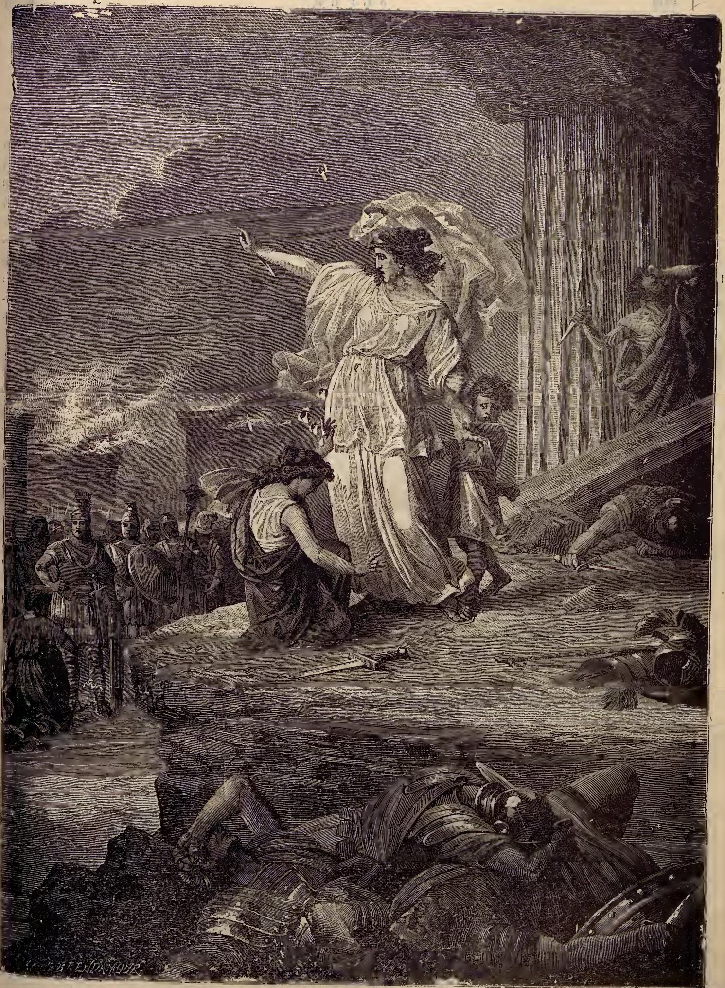
Յ ա դ ք ա ն ա կ