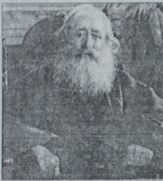
առաջ երկնից անուրուրին եւ երկրից ընդառնակութիւն իրեւ առաջաւել կը բազոյն, որոյ վրայ կը քրի եւ կը յիսէ այդ ազաս հանճար ու կը ճանն հիացեալ: այլ եւ՛ իմ փոքրիկ աշխարհին, փոքրիկ ժողովրդին փոքրիկ աւելումն են: Իմ երգերում ապարդը հայրենաց ինն ու նոր ւերակներ են, որոնց վերայ մերին ծայնով, լոնեայն կողքան անմխիթար: Յիկոն երջանիկ է, նորա վսեմ ճակտին վերայ Ֆրանսայի ազատութեան առջ կը զիս յայտն, իսկ իմ զուլիս եւ նկատ սուտերանման է, եւ ճեմիս մէկ կը քոսափեմ Չայասանի խաւար: Իմ հայրենացս որոյն զիս Արժիս ասացին: Եւ բարձրն է վերուս կը ճեմանմ հայրենացս ցիրուցան բեկորները, ուր խաւարը կը սիրաղեմ: Ո՛հ, որչափ դժուարին է մուրին դէմ կողմի, լոյսի ճառագայթով զանի փարսել: Լոյսին գրք փոքրիկ ճուղ մի արա՛ծելու մասօճան սասնածն են այս է իմ կոյնում: Լոյս կը զարկանք միւս, զի գիտեմ, քր լոյսն է միայն փրկութիւն: Բայց անճանա՛նք ու դարու յայտնում լոյս կակնկալով ինն: Լոյսի զօրութիւնը մարդու աղիկար կարօտութեան հեճ կը քոսեմ:

Տա՛ր իմ այս նուազ ծայր Յիկոյին, ով թարգման, եւ ասա՛, եւ յղեմը կը յարկու ետիկոյն չեմ, այլ նորա ասակերակներն են: Շատ էր ինձ, քր իր նկարած լուսափայլ յատկութիւն սուտ լինի, միայն կը յարգեմ, քր սրժ կը կրով ունիմ նորա չափ: Եւ էլ հայ ժամկուտանները հոգացի, եւ այնպէս, որ եւ էլ մի կարօս ժամկուտան դարձալ: Աս Յիկոյին եւ նորա մեծ մի յարբարական հասոյազան արձագանք յիսի սամ զուգակընելով քր եւ մի վճահար ոգի են: