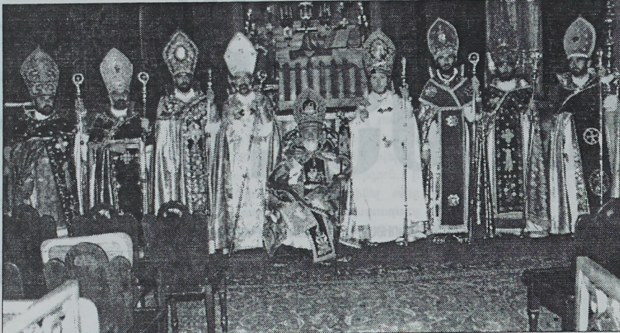
Զախիթ Առաքել Եպ. Քարայան, Նաթան Եպ. Կոնստանդինյան, Նավասարդ Եպ. Կոնստանդինյան, Առաքել Եպ. Կարապետյան, Գարեգին Ա Կաթողիկոս, Գարեգին արքեպիսկոպոս Ներսիսյան, Եզրիկ Եպ. Պետրոսյան, Սեդուկ Եպ. Չախչյան, Արքեպիսկոպոս Սյրիսյան

1992թ. Ամենայն Հայոց կաթնափայլական թեմի առաջնորդ: