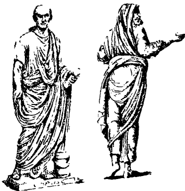
Հռոմայեցոց պարեգօտի ծնը:

Ընտանիքն իսկական փոքր Պիտութիւն մ'էր՝ կազմուած բազմաթիւ անձերէ. ան