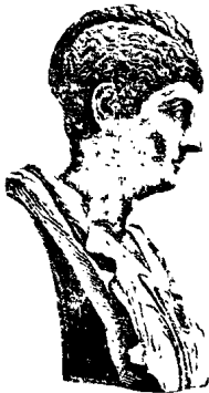
Հոռմուհույ մագ սամարեալու ձևը:

Երբ 510ին Թագաւորներն արտաքսուեցան Հոռմէն, հոռմական ժողովուրդը գերագոյն իշխանութիւնն իրեն սեպհականեց: Արդ, ժողովուրդը մի միայն պատրիկներէն բաղկացած ըլլալով, յեղափոխութիւնն ի շահ իրենց կատարուած էր: Որովհետև ամէն անգամ Թագաւորները ռամիկը սիրաշահելու միտումը ցոյց տուած էին, անոնց տեղը դրուեցան երկու հիպատոսներ, որոնք