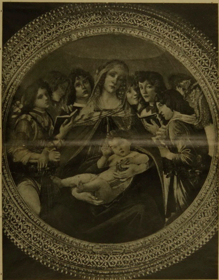
SANDRO BOTTICELLI. — « LA MADONE DE LA GRENADE »