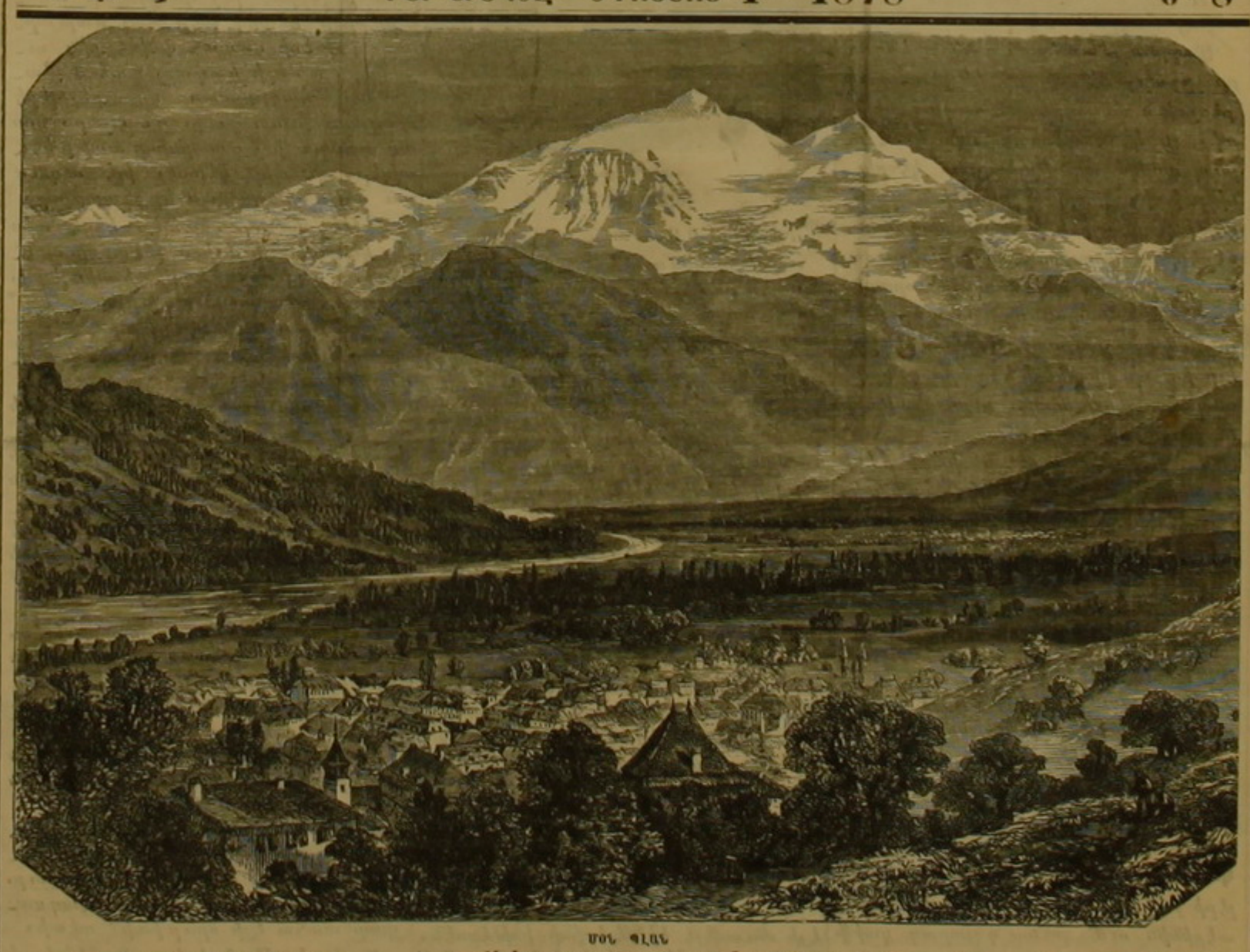
ԵՎՐՕՓԱՏԱ ԵՆ ԵՒԻՃԵ ՏԱՂ

Եվրոփասա Թասիի կիւգելիյի ձի-Տեխիյե սեյյահյարըն նադարը տիգ-գախինը էն դիյատե ձելպ էտեն մեմ լեթեխ Իսվիչերա մեմլեքեխի տիր։ Պու մեմլեքեխաե հիւձե տազլար, տերին տերելեր վե կիւգել կերլեր քեսրեխ իւղրե պուլունուր։ Պու մեմլեքեխն մենրագեսի հետեւ համասու Թեմից, ե արդից այուլուաներ գրու այոլաբերիր, է հայիսի զայրենելի, չայրչգան, էհլի իս նիգամեն, էհլի սեպան վե ճեսուր տուր և Լհայիսինին նագրիսյեն իւչսե հայիսի արօնեսնեանն վե ալիրիսի Գա-Golfe mpl.