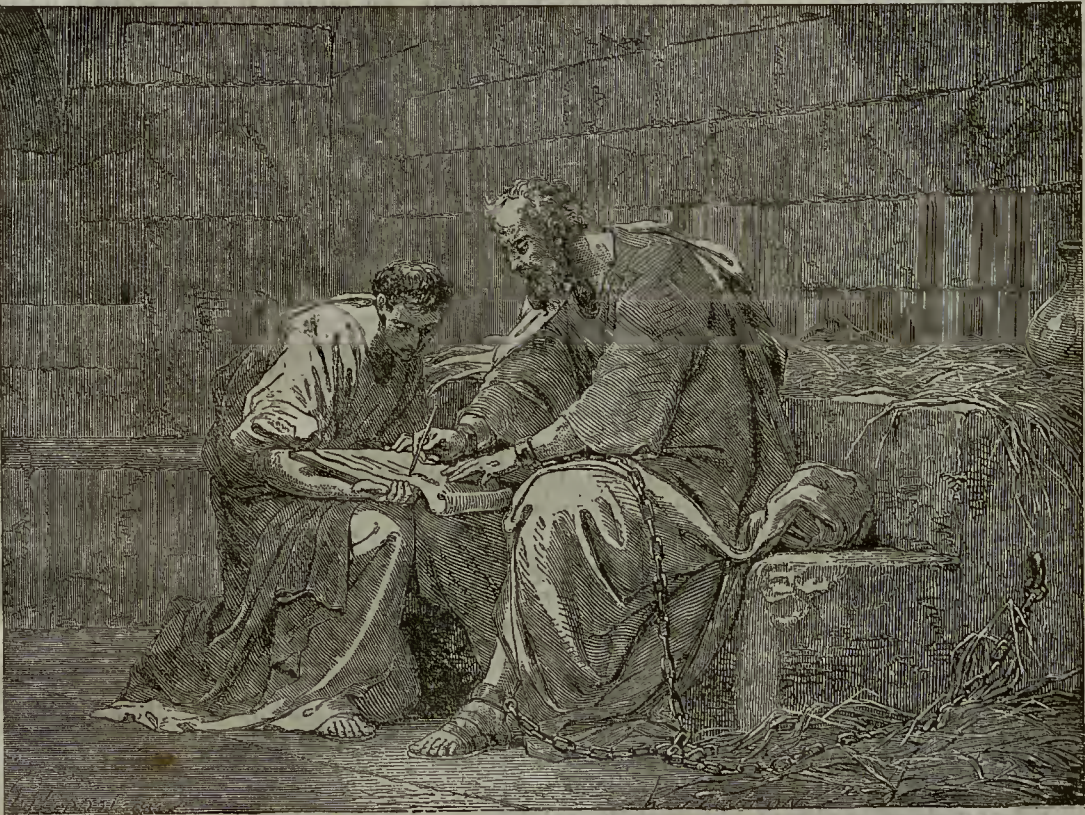
ՊՕՂՈՍ ԱՌԱՔԵԱԼ ՀՈՍԻ ԲԱՆՏԻՆ ՄԷՋ