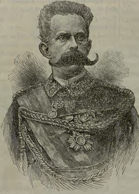
ԻՏԱԼԻՈՅ ՈՒՄՊԵՐԹՕ ԹԱԳԱՒՈՐԸ

Ումպերթօ թագաւորը միացեալ իտալիոյ երկրորդ վեհապետն է և իր հօր, Վիլհելմ Էմանուելի, յաջորդեց 1878ին: Ծնաւ 1844ին և ամուսնացաւ 1869ին իր հօրեղբոր, Ճենուվայի դուքսին, միակ աղջկան Մարկարիթայի հետ: Անոնց միակ զաւակն է Նափոլիի Իշխանը որ ծնած է 1869ին: Ումպերթօ թագաւոր ինքզինք սիրելի ըրած է հպատակներուն՝ անոնց բարօրութեան համար իր հոգածութեամբը, և իր յօժարամիտ կարեկցութեամբը զոր ցուցած է աղէտներու ժամանակ, ինչպէս հնտախտի համաճարակին ատենը որ պատահեցաւ Նափոլիի մէջ քանի մը տարի առաջ: Իր իշխանութեան կը հպատակին աւելի քան 30,000,000 ժողովուրդ: