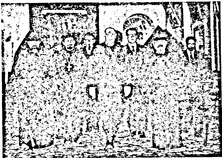
Տէք. Եիւնին Գ. Պիէյֆ իր հետեւորդներով, Ամենապատիւ Պատրիարք Ս. Հօր եւ Գերշ. Շահէ Եպս. Անճմեանի հետ, Պատրիարքարանի Դահլիճին մէջ։

Բազմաթիւ տեսակցութիւններ ունենալէ ետք, Տէք. Պիէյֆ իր հետեւորդներով մեկնեցաւ իր պաշտօնատեղին, աւարտելով խաղաղութեամբ եւ միջ-Եկեղեցակամ իրերահասկացողութեամբ ի նպաստ իր առաքելութիւնը Միջին Արեւելքի մէջ։