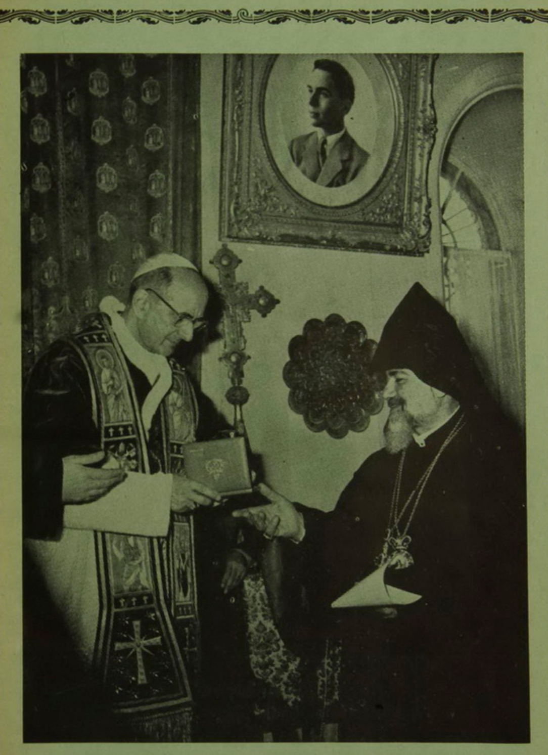
ՍՐԲԱԶԱՆ ՔԱΖԱՆԱՅԱՊԵՏԸ ԵՒ ԱՄԵՆ. Տ. ԵՂԻՇԷ ՍՐԲԱԶԱՆ ՊԱՏՐԻԱՐՔԸ

رسيون ، مجلة ارمنية شهرية ، دينية ، ادبية ، ثقافية ، للغة والبيان . "SION' an Armenian Monthly of Religion, Literature and Philology