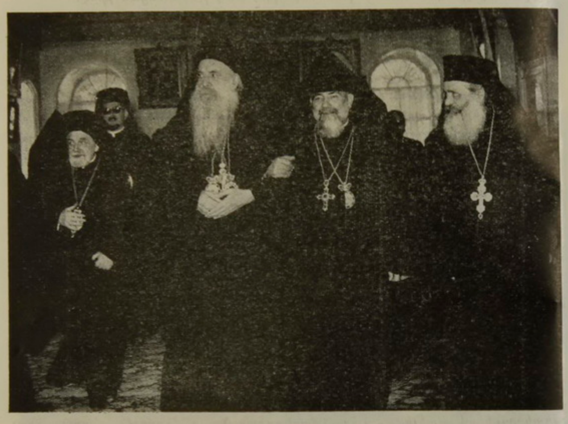
ԵՐԿՈՒ ՍՐՔԱԶԱՆ ՊԱՏՐԻԱՐՔՆԵՐԸ ԹԵՒԱՆՑՈՒԿ ՀԱՑՈՑ ՊԱՏՐԻԱՐՔԱՐԱՆԻ ԴԱՀԼԻՃԻՆ ՄԷՋ

Աթենակորաս Պատրիարջը իր սրտագին չնորհակալու թիւնը յայանեց իրեն եղած ընդուննլու թեան և Ամենապատիւ Սրբազան Պատրիարգ Հօր բարիգալըստեան խօսքերուն համար, ըսելով թէ ինքը կը փափաքի իր կողմէն ընել լաւագոյնը՝ որ Քրիստոնեայ քոյր Եկեղեցիները կարենան գիրար հասկնալ և աշխատիլ միասնաբար, ի փառս Աստու ծոյ և քրիստոնեու թեան զաղափարներու և իտէայներու իրագործման՝ այս աշխարհի մէջ ւ