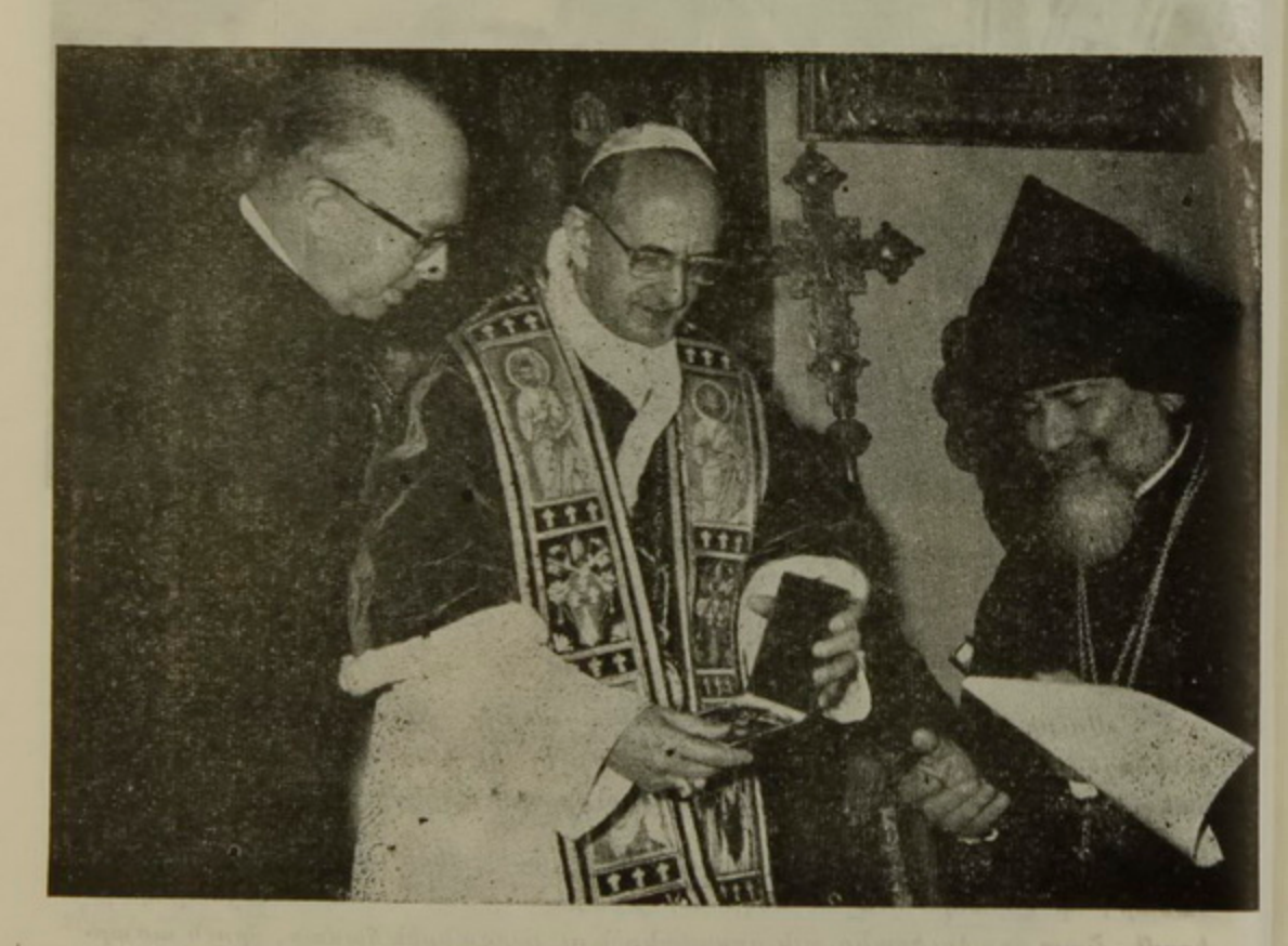
Ամեն. Ս. Պաsrիասք Հայրը կր յանձնե Պապին թանկագին քարևով զարդարուն գեղեցիկ խաչ մը:

«Գիտենը, Թէ ի՛նչ է անծնական դերը Ձերդ Ամենապատուունեան, մինուլորտի այս փոփոխունեան մէջ. ծանօխ ենք այն ճիգերուն, որոնք երկուստեր կը Թափուին՝ վիճելի կէտերը անհետացնելու համար. ատոր համար խորապէս ուրան ենք, եւ կ'արտայայտենք մեր ամրողջ երախտագիտունիւնը։ Թող խաղաղունեան Աստուածը Իր շնորհը առատօրէն տեղացնէ Ձերդ ԱմենապատուուԹեան, Ձեր Միարանունեան եւ Սուրբ Քաղաքի Ձևր բոլոր զաւակներուն վրայ»։