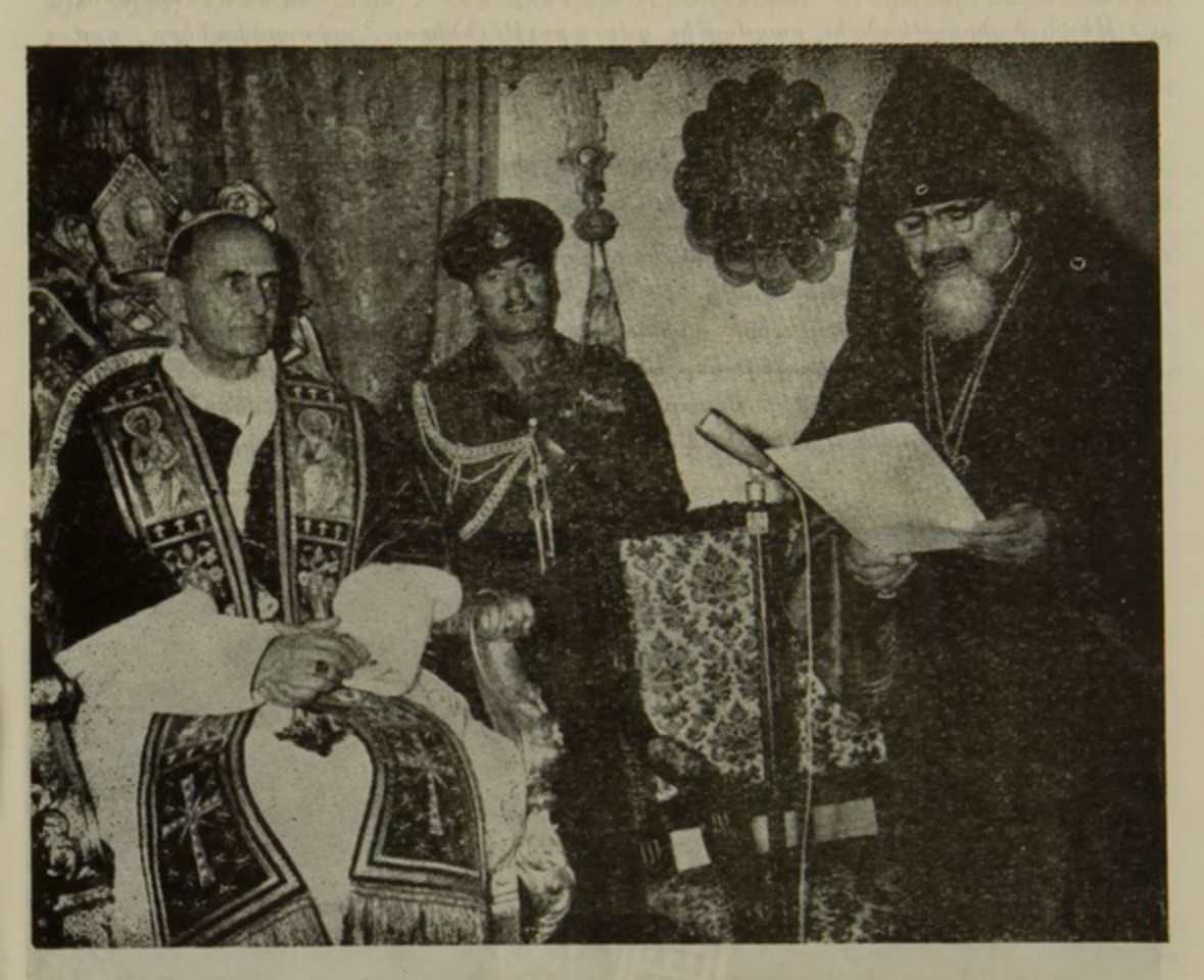
Ամեն. Սբբազան Պատրաբք Հայբը կը կարդայ իր բարիգալուստի ուղերձը:

որուն անդլերէն ԹարգմանուԹիւնը կարդացունցաւ Խորէն Վեհափառի պատուիրակուԹեան անդամներէն, Հողշ. Ց. Գարեգին Ծ. Վրդ. Սարգիսեանի կողմէ։ Պատրիարը Ս. Հօր խօսքին ԹարգմանուԹենէն յետոյ, Նորին ՕրբուԹիւնը իտալերէնով խօսեցաւ հետևեալը, որ տեղւոյն վրայ անդլերէնի Թարգմանունցաւ։