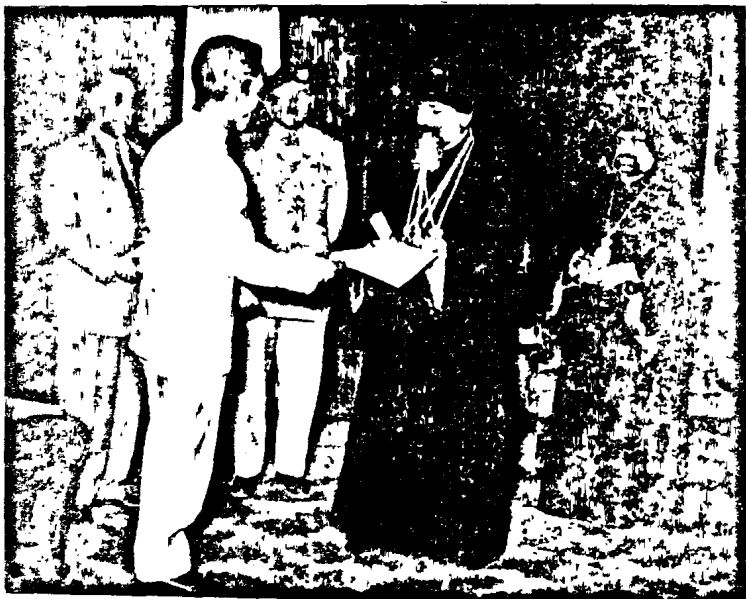
Հիւսէյն Թալաւորը Ամեն. Եղիթէ Պատրիարքին կը յանձնէ արքայական «պերաթ»ը:

Ասուծոյ պատշապանութիւնը միշտ ան- պակաս քոյ ըլլայ Ձերդ Վեհափառութեան վրայէն, որպէսզի կարենաք իրադրծել Ձեր բարի մտադրութիւնները ի տան Յորդանանի