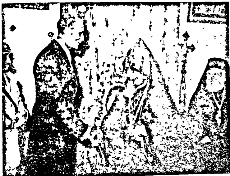
Նորին Վսեմ. Հառան էլ Քաթիպ, Սուլապեմի եւ Ս. Տեղեաց Կառավարիչը, կը զննուարեւ Ս. Պատրիարք Հայրը:

Պատրիարքարանի ընդարձակ դահլիճը, քոյնտի սենեակները և Պատրիարքարանի խոշոր անցքը, քիչ կուզային երեք հազարի հասնող օտար և հայ բազմութեան: Պատ-