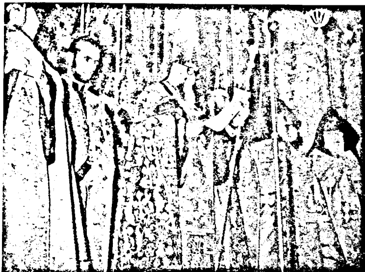
Ամեն. Ս. Պատրիարք Հայրը կը կարգայ իր ուխտի բարոզը :

Շնորհակալ ու երախտապարտ եմ որ Ս. Յակոբեանց եղբայրութեան կողմէ ինձի վստահուած Պատրիարքական այս պաշտօնը