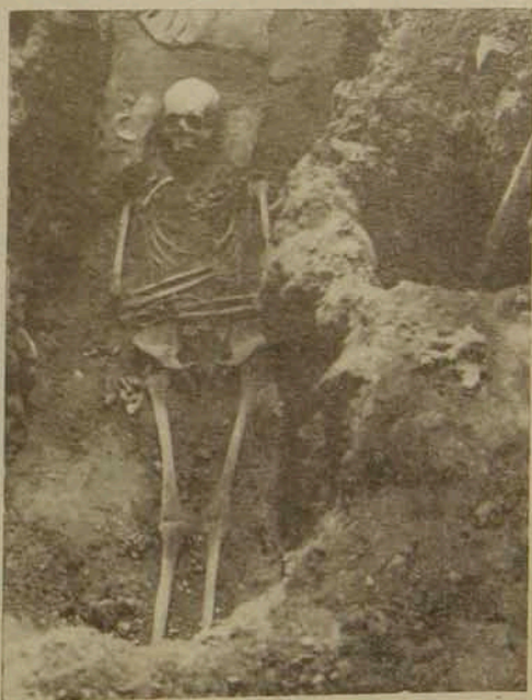
Թիւ 1. Ս. Յակոբայ Տաճարի յատակին ներքեւէն ելած կմախքներէն մէկը:

2. ՊԵՂՈՒՄՆԵՐ. — Հին սալքարերը վերցնելու միջոցին, լոկ հետաքրքրութեան համար, փորուեցաւ ներքեւը Մ. Էջմիածնի եկեղեցիի մուտքին դիմաց գտնուող սեւ քարերուն՝ որոնց գոյութեան ակնարկեցինք քիչ մը վերեւ: Անոնց անմիջական յատակէն ոչինչ երեւան եկաւ: Փորուածքը փոքր ինչ աւելի հարաւ տարածելով յանկարծ զանկ մը երեւցաւ: Մէջտեղ հանուեցաւ զանկին մարմինը, որ շատ լաւ եւ անաղարտ վիճակի մէջ պահուած կմախք մըն էր (Տէ-Պ-ԴԷ-Բէ-1): Այս կմախքը դրդապատճառ եւ սկզբնա-