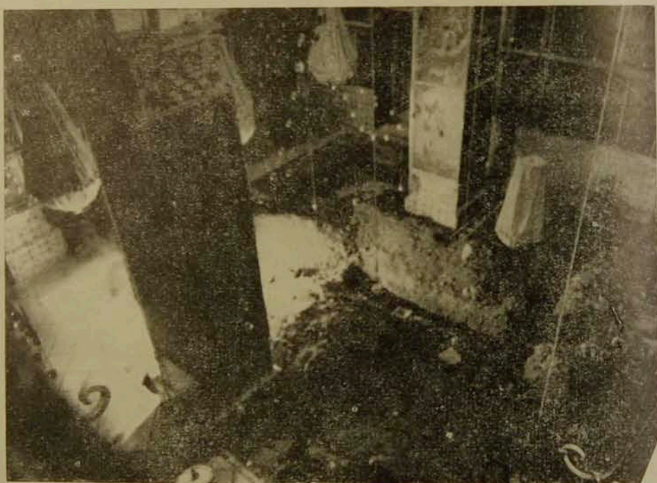
Թիւ 2, Ս. Յակոբայ Տանաթի յառակր պեղումներու ընթացքին:

ջու, պատի գծէն մէկ ու կէս մետր դէպի հիւսիս, եւ ձախակողմեան դասի վանդակէն երեք ու կէս մետր (մինչեւ ոտքերը) դէպի արեւմուտք, 130 սմ. խորութեան վրայ: Այս կմախքը, ինչպէս նաեւ միւս բոլոր կմախքները թաղուած էին զլուխ արեւմուտք եւ ոտքերն արեւելք, այնպէս ինչպէս քրիստոնեաներս սովոր են թաղել: Երկու քարեր զրուած էին զլուխ աջ ու ձախ կողմերը: Այս կմախքին ձախ կողմը, հորի բերանի ձեւով եւ 42 սմ. տրամագծով բացուածք մը կար (Տէ- Պ-Գէ- Դ- 1), որ սակայն ջրհորի մը վրայ բացուելու ոչ մէկ