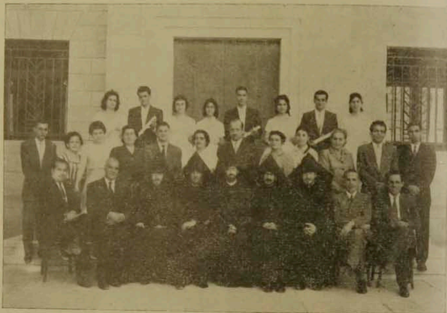
ՍՐԲՈՑ ԹԱՐԳՄԱՆՉԱՅ ԵՐԿՐՈՐԴԱԿԱՆ ՎԱՐՄԱՐԱՆԻ ՌԵՍՈՒՑԵԱԿԱՆ ԿԱՅՐ ԵՒ ԵՐՁԱՆԱԿԱՐՏՆԵՐ

Հանդէս աւարտին, Ամեն, Որբագան Հայր կատարեց Վհայականներու և մրցանակներու բաշխումը երկրորդական քաւնի 8 երկսեռ ընթա-