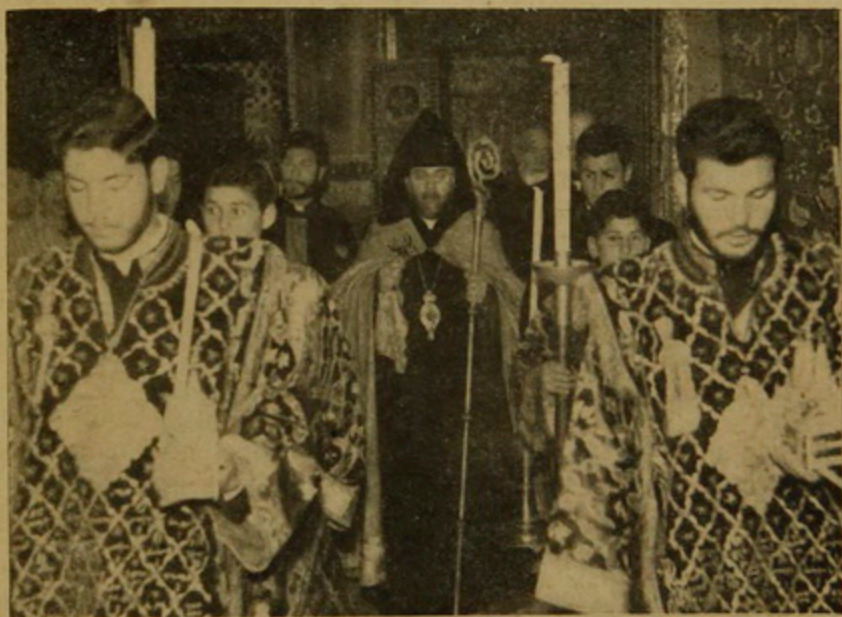
Ս. Գլխագրի առջեւ ընտրութենէն ետք:

Ս. Աթոռոյս վերջին գահակալը, Երանաւորն Տ. Կիրեղ Պատրիարք, վախճանեցաւ 1949 Հոկտ. 28ին: Այնպէս որ Առաքելական Աթոռը աւելի քան եօթ տարիներ սուգի փոյով ծածկուած մնաց առանց բանաւոր եւ հար-