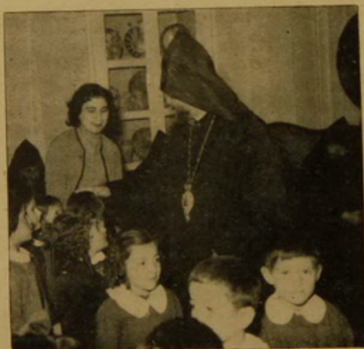
Ամեն. Պատրիարք Հայրը կ'օրհնէ Ազգային վարժարանի փոքրիկները:

Միաբերան եւ արագեղ երգուեցաւ «Սիրոնի որդիք, զարթիք, հարսին լուսոյ զոյւ աւետիք» երգը Շնորհալիի: Մինչ այդ սկսած էին հնչել Մայր Տաճարի զանգակները եւ կոչնակները աւետելով ամենքին նոր Պատրիարքին ընտրութիւնը, որուն ի լուր վաճառական ժողովուրդը եւ Սրբոց Թարգմանչաց ազգ. վարժարանի աշակերտները լեցուցած էին Սուրբ Յակոբայ գաւիթը: Երբ ժողովը աւարտեցաւ ժամը 11.20ին, Միաբան հայրերը մօտեցան աջահամբոյրի եւ