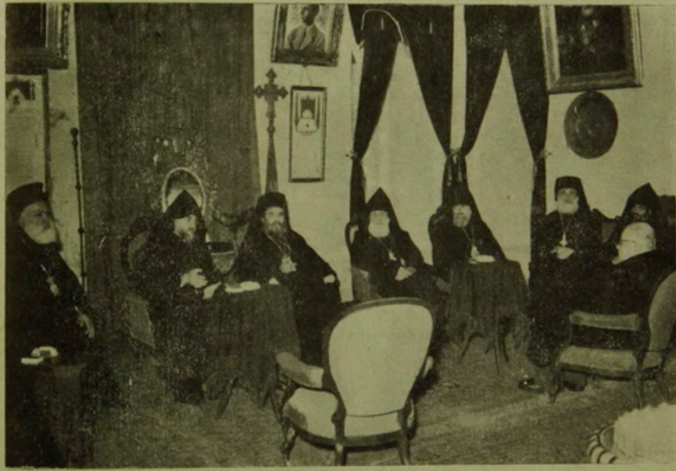
Յունաց Պատրիարքի այցելութիւնը Հայոց Ընտրեալ Պատրիարքին: