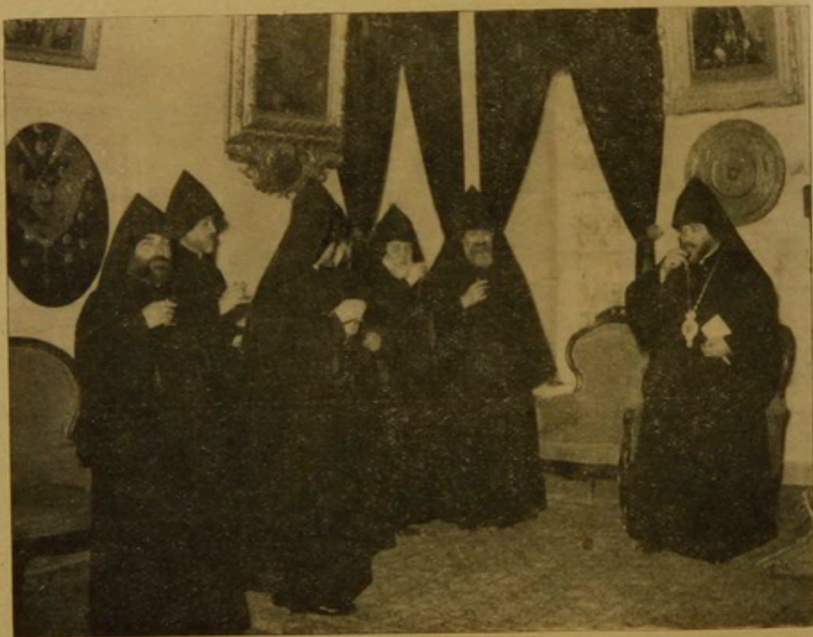
Ընտրութեան ետք՝ շնորհաւորութիւններ:

1943 Հոկտ.ին, Տիրան Վրդ. կ'ընտրուի Հիւսիսային Ամերիկայի Հայոց Արեւելեան Թեմի Առաջնորդ, յաջորդելով Գարեգին Արքեպս. Յովսէփեանցի, որ ընտրուած էր կաթողիկոս Մեծի Տանն Կիլիկիոյ: 1944 Նոյեմբերին կը հասնի Ամերիկա եւ կը ձեռնարկէ իր պաշտօնին: Հիւսիսային Ամերիկայի Առաջնորդութեան տարիները կը կազմեն ամենէն բեղուն շրջանը Տիրան վար-