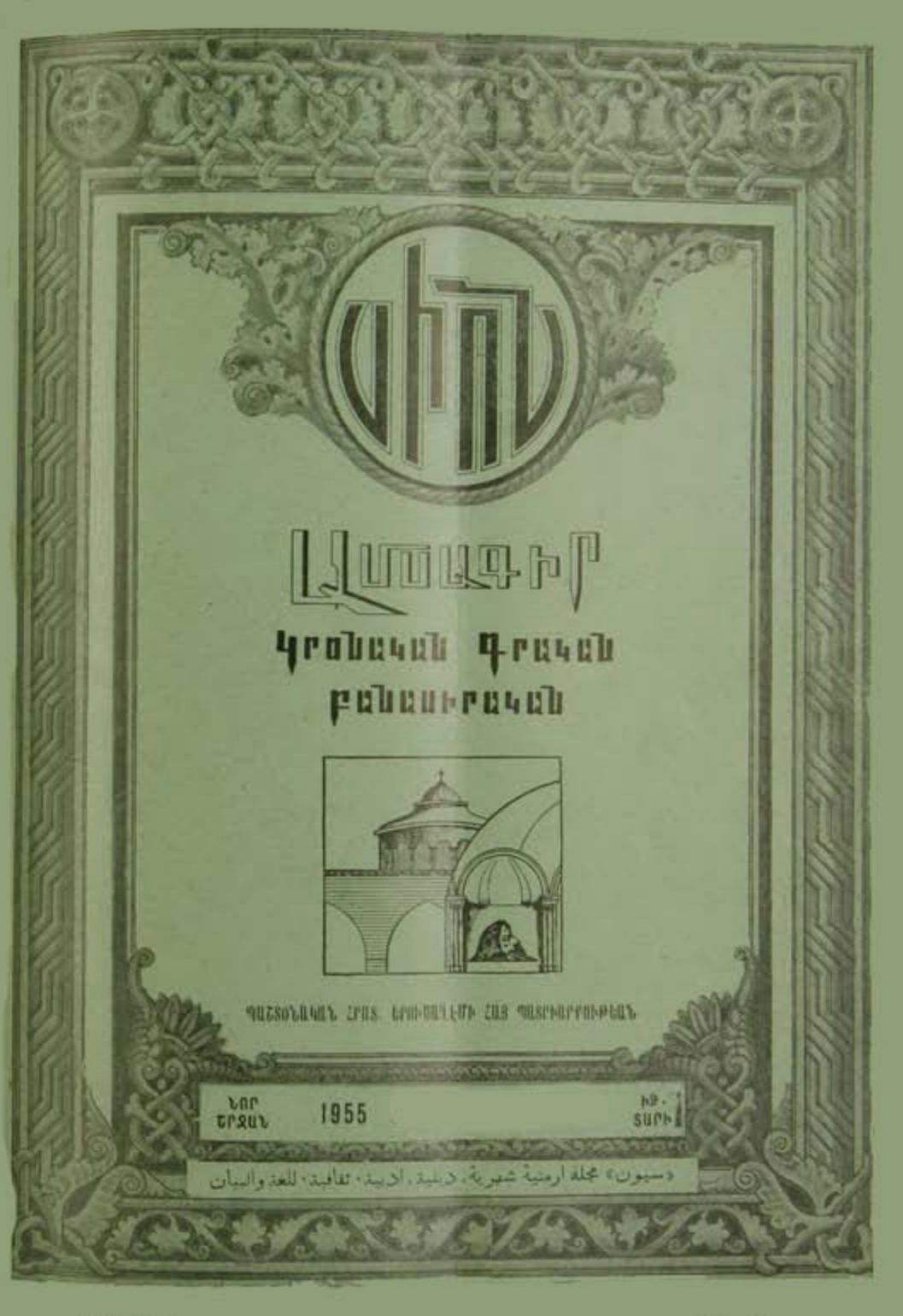
"SION, an Armenian Monthly of Religion, Literature and Philology Printed in JERUSALEM