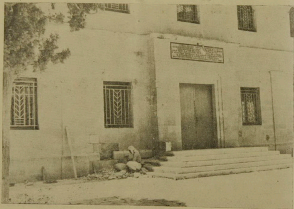
Սուրբ Արթուրոյս Կիւլպէնկեան Մատենադարանը՝ նորոգութեան առաջ:

1948ի Հրէական եւ Արաբական կռիւներու առնէն, Երուսաղէմի Հին Քաղաքը եւ թարկուեցաւ ծանր ուժակոծութեան, եւ եղաւ Ս. Երկրի ամենէն աւելի վնասուող քաղաքներէն մին: Ս. Յակոբեանց Մայրավանքը որ աշխարհագրական դիրքով կը գտնուի Հրէական թաղին կից, ունեցաւ թէ մարդկային եւ թէ նիւթական մեծ վնասներ: Խոշոր ոււմբէ մը կիսովին վնասուեցաւ Ս. Էջմիածնի տանիքը, Պատրիարքարանի եւ Ս. Թարգմանչաց Վարժարանի տանիքները, ինչպէս նաեւ Կիւլպէնկեան Մատենադարանը: