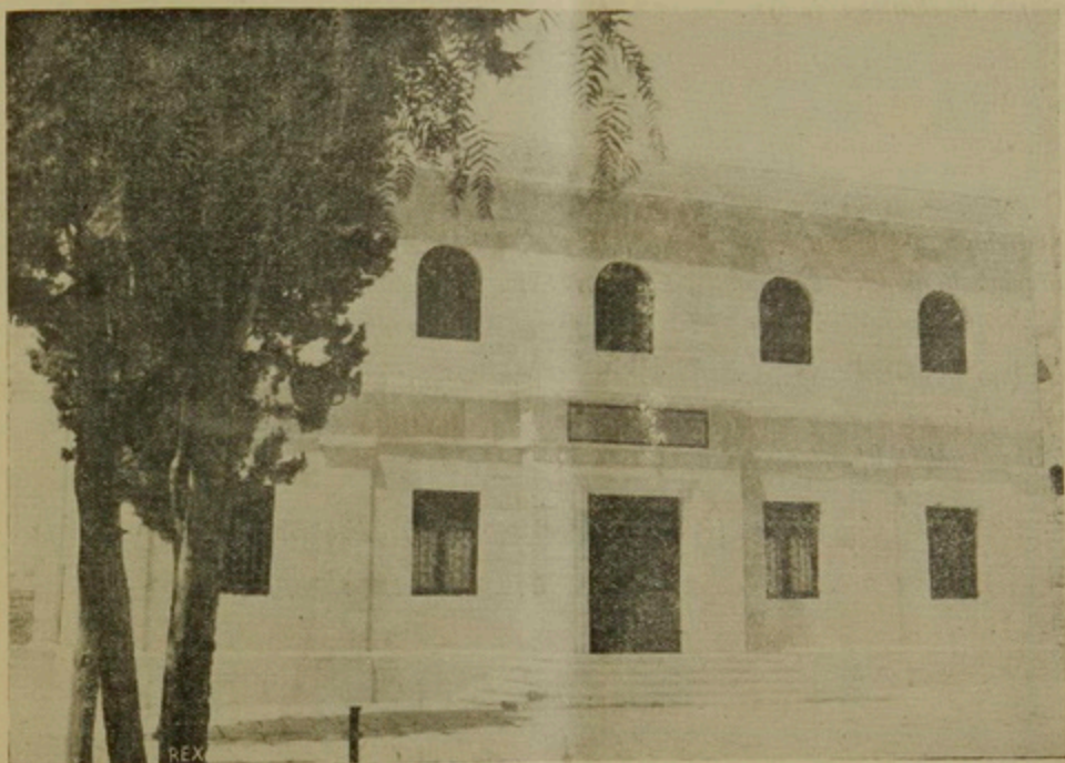
Սուրբ Արտուրս Կիւլպէնկեան Մատենադարանը՝ նորոգութենէն վերջ:

1948 Հոկտ.ի 23ին, տեղեկագրով մը, երջանկայիշատակ Տ. Կիրեղ Ս. Պատրիարք դիմած էր Ս. Աթոռոյս մեծ բարերար Վսեմ. Տիար Գալուստ Կիւլպէնկեանին, տեղեկացնելով ընդհանրապէս Ս. Աթոռին նիւթական վնասները եւ մասնաւորաբար Կիւլպէնկեան Մատենադարանի գեղեցիկ շէնքին վնասները, կցելով բանդուած մասերուն լուսանկարները: 1948էն ի վեր թէեւ մասնակի նորոգութիւններ եղան, այսուհանդերձ հիմնական նորոգութիւն մը չէր եղած, մեր տնտեսական նեղ կացութեան բերումով: