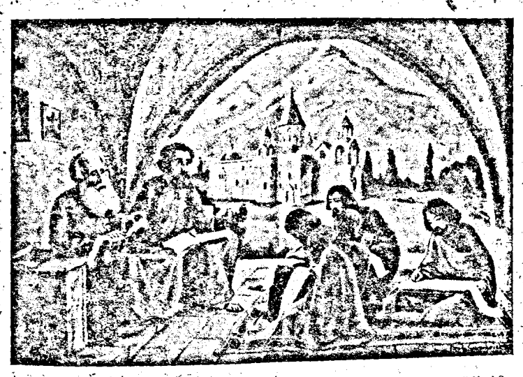
Ուք զաւդաւեցին ոնօւինաբաւ զիմասո Անեդին Հասոահելով լեւկւի զգիւ կենդանի Հովուել գնօռ նու իսւայելի: