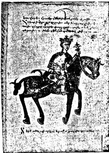
Ձեռ. քղ. 16ա.

ԼԾ. — Այ իմ ամենման սուլսան, երանի քո բախտիս ես սամ, եւ զիմաստութիւնըդ քո զհաջութիւն սրբօղ զարմանամ. թե ոնց իօխեցիր զընալ առ Դարեհ ես ի վայր մընամ, աւրհնեալ Աստուծոյ ամունն, որ ճարաւ լեբեր ողջանդամ: