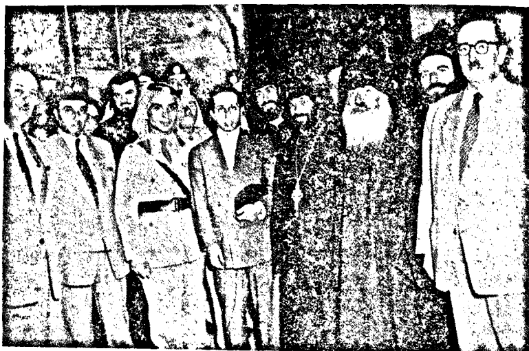
Ն. Վ. Հիւսէյն Բ. եւ Ֆէյսալ Բ. Բերքինեմի Սբ. Մնեղեան Տաճարին Հայապատկան մասին մեջ, կ'ընդունուին Հայ Միաբանութեան կողմէ:

Շաբաթ 15 Օգոստոս 1953ին, կեսօրուան մօտ, Բերքինեմ քաղաքը թափառող հանդիսւորին մը կը ցուցադրեն: Յորդանանի Հաշիմական քաղաւոր Ն. Վ. Հիւսէյն Բ. եւ Իրաքի քաղաւոր Ն. Վ. Ֆէյսալ Բ.՝ այցելեցին Բերքինեմի Տնօրինական Մեքանայրերը: Սբ. Մնեղեան Տաճարի մուտքին առջեւ Ն. Վ. քաղաւորները ընդունուեցան Հայ, Յոյն եւ Լատին երեք գլխաւոր յաւանուանութեանց ներկայացուցիչներէն: Քրիստոսի ծննդեան Սբ. Այրը այցելելէ ետք, վեհաժողով քաղաւորները առաջնորդուեցան Պէյք-Ճալալի Everest պանդոկը, միջօրեի իրենց հազար ընելու: Ճաշատեղանին հրաւիրուած էին ակամաւոր անձեր, նախարարներ եւ զինուորականներ: Հայոց կողմէ ներկայ էր բարձրագոյն Գեո. Տ. Նզիսե Արեւսպ. Տէրտէրեան, ընկերակցութեամբ Հոգ. Տ. Հայրիկ Վրդ. Ասլանեանի: