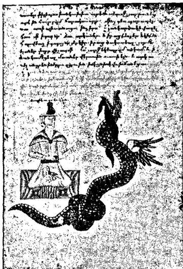
Ձեռ. քղ. 7բ.