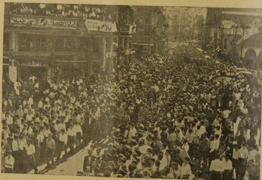
Յուլարկաւորութեան քափօրէն տեսարան մը:

Նոյնիսկ բժշկարանի մէջ, հին հէք բժիշկը իբրև գերագոյն դեղ կը հայցէ, Յիսուսի՝ բժշկութիւնը: Յիսուս, բժշկէ՛ Վոհի հափառի վէրքերը: Բայց Վեհափառ ի՛նչ տառապիր վէրքերէ. Վեհափառի վէրքերի