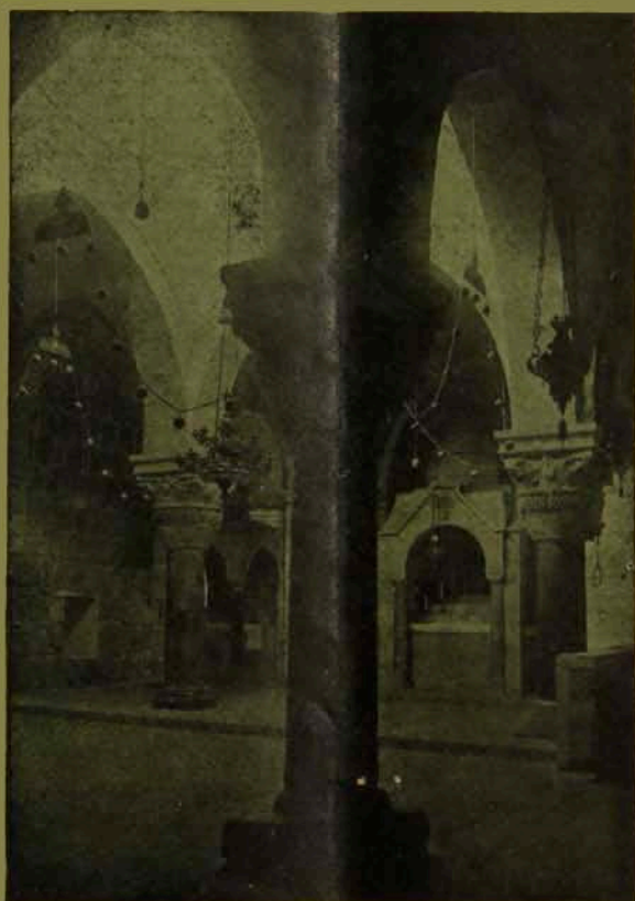
Ս. Իրիգոր Լուսաւորիչ եկեղեցիին ներհամաւոր՝ կողմնակի :

ՊԱՇՏՈՆԱԿԱՆ ՀՐԱՏԱՐԱԿՈՒԹՅՈՒՆ ԵՐՈՒՍԱԴՆԵՄԻ ՀԱՅ ՊԱՏՐԻԱՐԺՈՒԹԵԱՆ