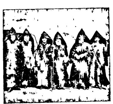
Նուին Ս. Օծութիւն Վենափառ Հայրապետ դիմաւսրուած Լիբանանեան սանմանագլուխը :