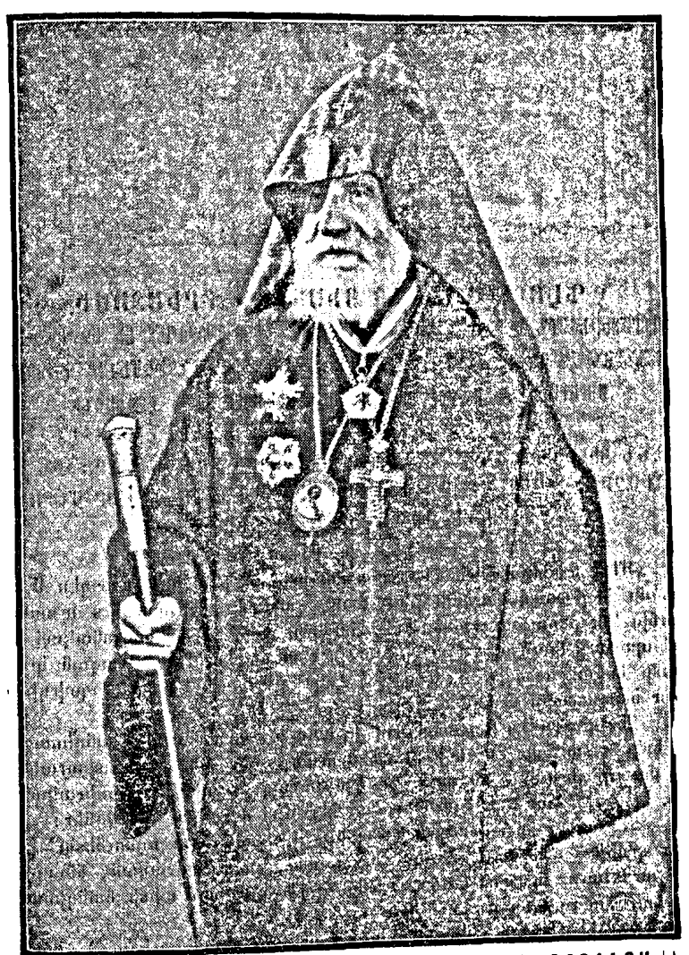
_ ՅՈԲԵԼԵԱՐ՝ ՎԵՀԱՓԱՐ՝ Տ։,Տ.՝ԳԱՐԵԳԻԾ Ա֊ ԿԱԹՈՂԵԿՈՄ՝) ՄԵԾԻ ՅԱԾԾ ԿԻԼԻԿԻՈՑ