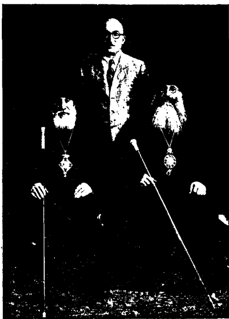
Վեհ. Տ. Գաբրիէլ Ա. Կաթողիկոս Տանգ Կիլիկիոյ Ամեն. Տ. Կիւրեղ Բ. Պատրիարք եւ Պր. Ռ. Նսայեան

Տաճար մտնելով՝ մեր վերջին ուխտը կատարեցինք Խշման Սեղանի առջև և մեկնեցանք Երեւան՝ քառասնօրեայ միաբանական կեանքի անուշ յիշատակներով: