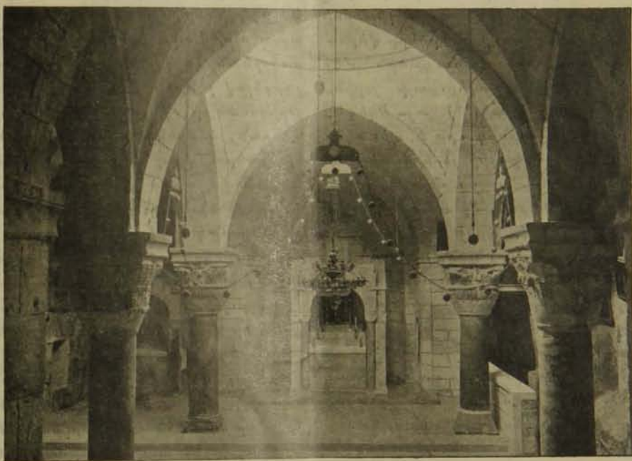
Ս. Գրիգոր Լուսաւորիչ եկեղեցիին ներքնամասը, ճակեհն։

Առանց մտնելու այս աւանդութիւններուն պատմական քննադատութեանը, նկատի ունենալով սակայն գէթ անոնց գոյութիւնը միայն, ու մնալով աւելի ճար-