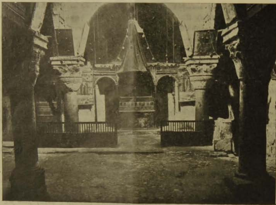
Ս. Գրիգոր Լուսաւորիչ եկեղեցին, նախ քան նորոգութիւնը:

Ըսի որ Հարազատ Ճարտարապետութիւնը՝ Տաճարին զանազան մասերուն մէջ արմուկ արմուկի է անհոյի ճարտարութեան մը շինածներուն հետ. առաջինն յաշտաբերող՝ թիւրեւ աւելի ամբողջաւոր մաս չկայ բովանդակ Տաճարին մէջ քան Հայոց Ս. Գրիգոր Լուսաւորիչ եկեղեցին: