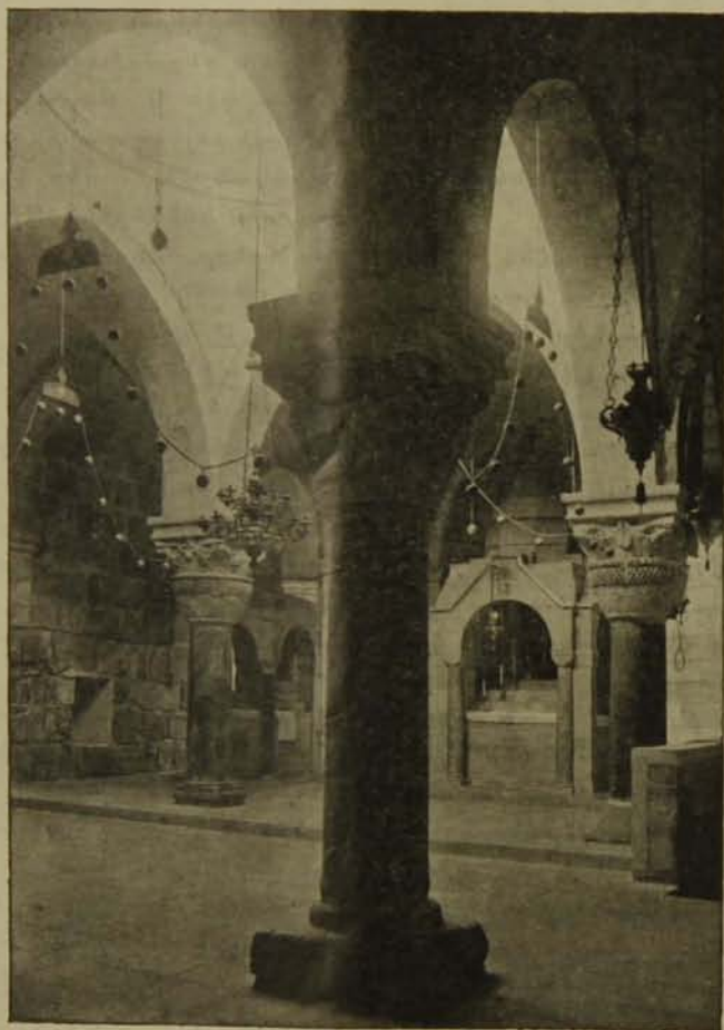
Ս. Գրիգոր Լուսաւորիչ Եկեղեցիին ներքինամասը, կողմնակի:

Վերջապէս, կողակներուն կամ խորանխորշերուն (abside) փայտաքանդակ խաչկալները վար առնուեցան, իրենց կարգին. և երկու կողակներուն մէջ՝ տեղ առին Հայկական կաթողիկէի ոճով գունաւոր մարմարէ սիւներով երկու խորանինոր խաչկալներ. Մայր խորանինը մասնաւորաբար