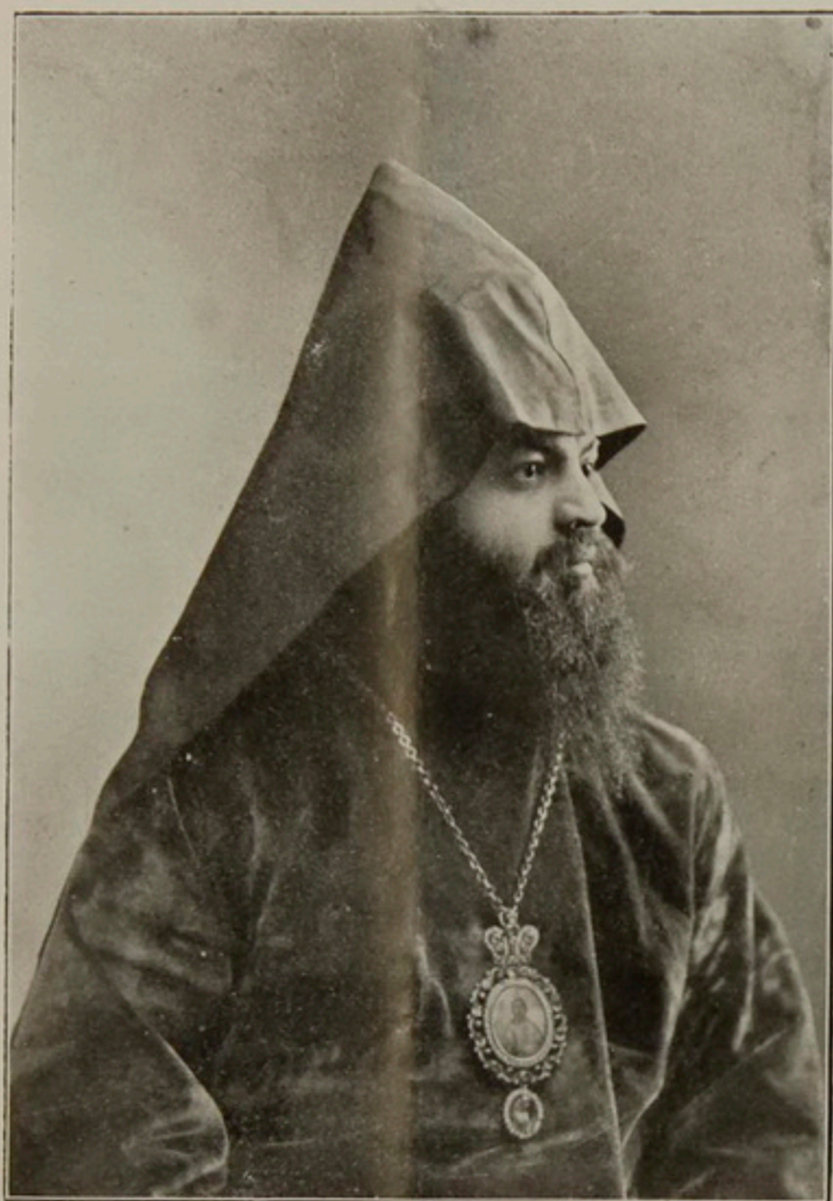
Ն. Ս. ՕՏՈՒԹԻՒՆ ԳԼԵՂ. Տ. Տ. ԽՈՒՐՆ ՍՐԲԱԶՆԱԳՈՅՆ ԿԱԹՈՂԻԿՈՍ ԱՍԵՆԱՅՆ ՀԱՅՈՑ