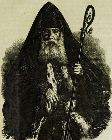
ԱՄԵՆԱԳԱՏԻՒ ՏԷՐ ՅԱՎՈՐ ԱՐԲԵՊԻՍԿՈՊՈՍ Գատիբաբջ Կոստանդնուպօլսոյ :

պատիւ Վարդապետիոյ . ուստի յուղի անկաւ ինքն է երեսուն եւ ութ պատանեակք աշակերտացոր Վարժարանիոյ ընդ նմա : Որ նաեւայ ամենայն յաջողութեամբ՝ ինքն իսկ պատմեցէ ճեզ զամենայն, եւ զայլ կարեւորացն խօսեսցի . որոյ կենդանի բարբառովն նադորդեմք ճեզ գրիստոսական սուրբ ողջոյն մեր եւ զջերմ սիրոյ յարգման : Նաև, զնոց դաստիարակութեան մանկտոյր յանձն առնեմք ազգովն ի խմամս