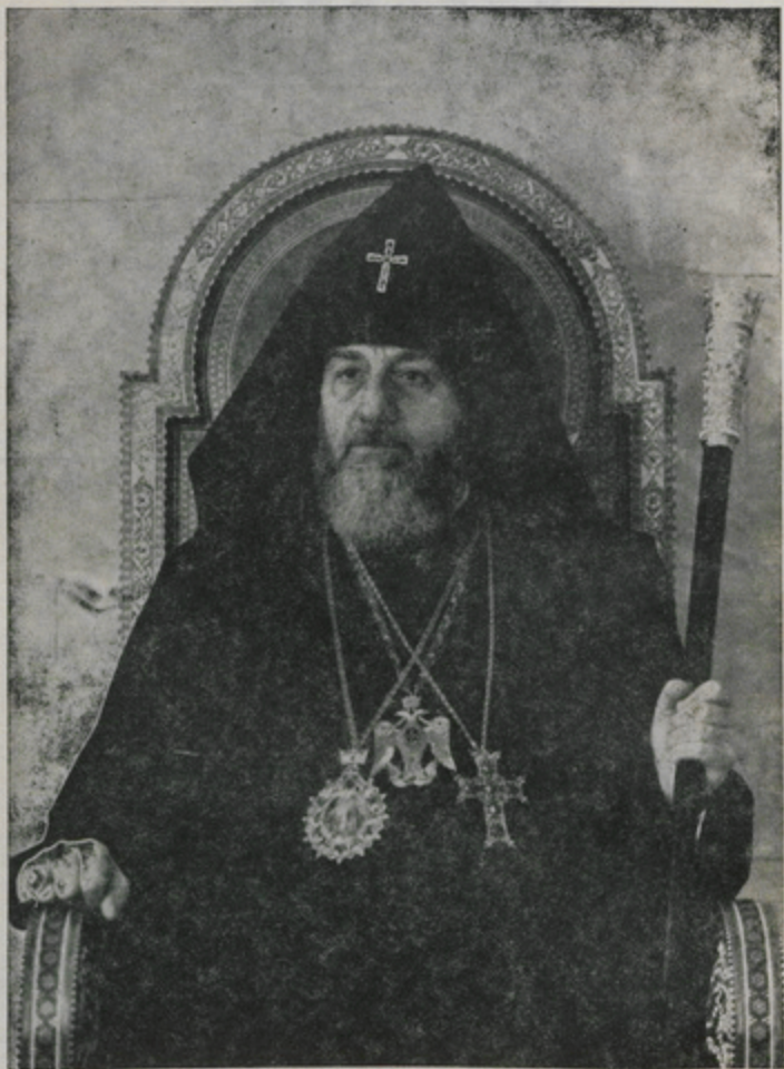
Ն. Ս. ՕՇՈՒԹԻՒՆ Տ. Տ. ՎԱԶԳԷՆ ԱՌԱՋԻՆ ԿԱԹՈՂԻԿՈՍ ԱՄԵՆԱՅՆ ՀԱՅՈՑ