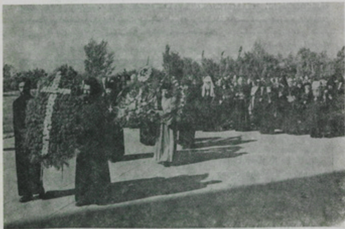
Եկեղեցական պատուիրակութիւններու այցը Միծեռնակաբերդի Հայ Լազարականներու յուշարձան:

Ետջորդ օրերուն հիւրերը և ուխտաւորները այցելեցին Պետական Թանգարան, Ս. Գեղարդի վանք, Օշական, Զեռազրաց Մատենադարան և Սեւան: