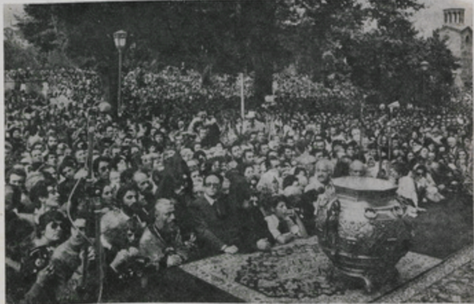
Մաս մը Ս. Էջմիածնի շրջափակին մէջ հաւաքուած հաւատացեալներու ծովածաւալ բազմութեանը։

ներ, Հայաստանեայց Եկեղեցւոյ առաջնորդներ և եպիսկոպոսներ երգեցին «Սրհնեացի և սրբեցի սրբալոյս ժիւղոնն» և յուզումը արթնեց ամբողջ ժողովուրդի ծովն, բարձրանալու համար առ Աստուած՝ յայտնելու Հայ ժողովուրդի երախտագիտութիւնը, որ անգամ մը ևս Գրիգոր Լուսաւորչի տեսիլքն ծնած Տաւադի մէջ, Ս. Գրիգոր Լուսաւորչի յաջորդը Գրիգոր Լուսաւորչի խնդիրներն կր խառնէր նոր ժիւղոնն մէջ, ազաւոյնելու համար շարունակութիւնը աստուածային օրհնութեան և շնորհին, եկած Հայ ժողովուրդին և նորէն իջնող մեր Հայրենի հողին վրայ։ Բոլորին արտէն անցաւ սարսուռը Հոգեպաշտօնին, բոլորն ալ զգացին թէ դարձեալ կը բացուէին երկինքի դռները և Սուրբ Հոգին կ'իջնէր սրբազան աշն իւղին մէջ, որ Հայաստանի և Սփիւռքի