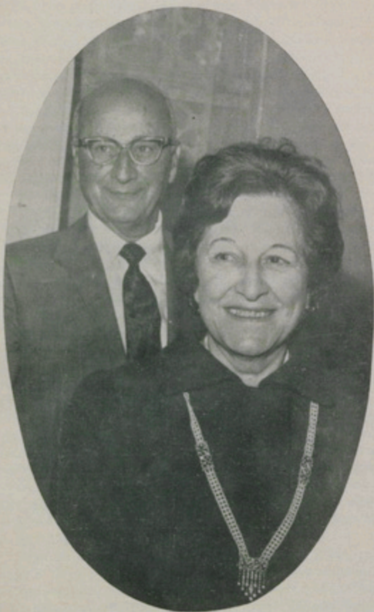
Ս. ԱԹՈՌԻՍ ԲԱՐԵՐԱՐ Ե. ՎՍԵՄ. ՏԵՐ ԵՒ ՏԿԼ. ՍԼԵԲՍ ԵՒ ՄԱՐԻ ՄԱՆՈՒԿԵԱՆՆԵՐ