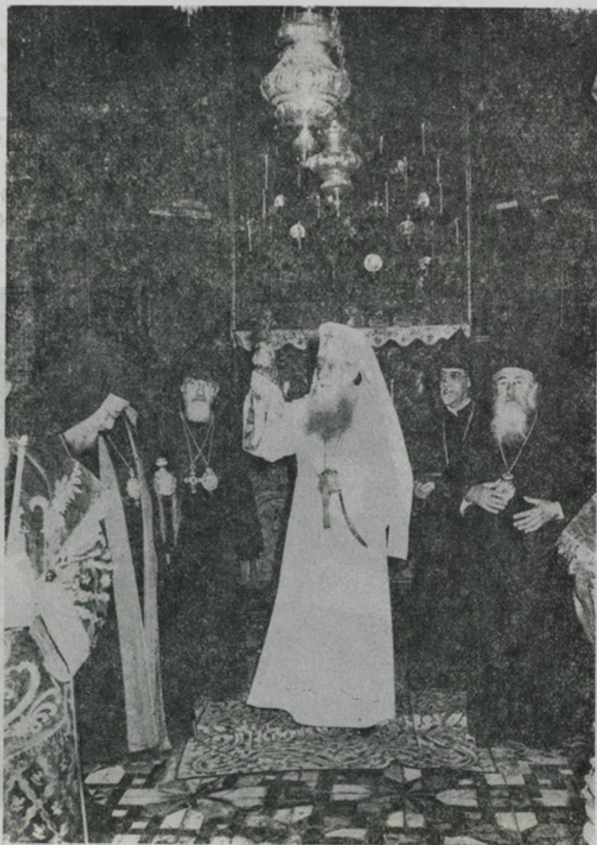
Ս. Գլխադրի մէջ իր աղօրքէն ետք, Ն. Ամեն. Ժուստինիան Պատրիարք կ'օրհնէ ներկաները:

Իր պատասխանին մէջ, Ն. Ամեն. Ժուստինիան Պատրիարք շնորհակալութիւն յայտնեց ջերմ ընդունելութեան և Ռումէն եկեղեցիին նկատմամբ արտայայտուած գեղեցիկ խօսքերուն համար: Ան անդրադարձաւ Հայ Ժողովուրդի անցեալին, և յիշեց թէ ինչպէ՛ս Ռումէն Ժողովուրդը Մեծ Եղեռնէն առաջ ու ետք սիրով ընդունած է Հայերը և անոնց ընծայած ամէն ազատութիւն ու ասպնջականութիւն: