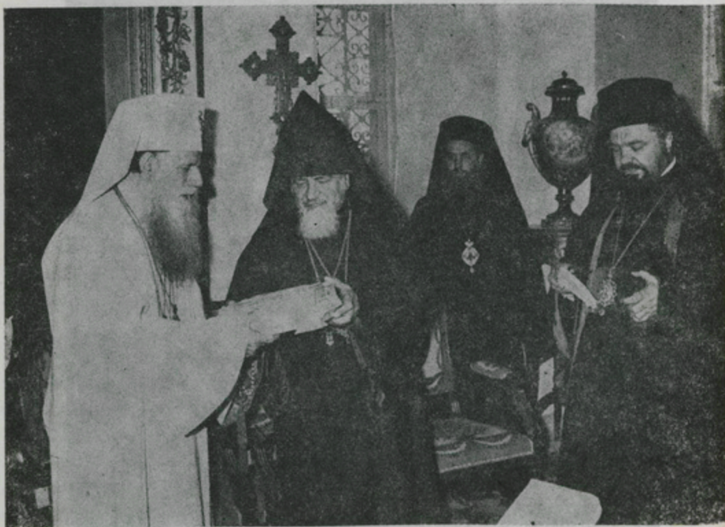
Ս. Աթոռիս Ամեն. Գահակալը Սրբազան Հիւրին կը նուիրէ Ռումէն քանկագին Աւետարան մը պարունակող սատափեայ տուփը :

Ն. Ամեն. Ժուտտինիանի Երուսաղէմ այցելութեան զլիաւոր նպատակներէն մին էր օծել Ս. Քաղաքիս նորակառոյց Ռումէն զեղեցիկ Եկեղեցին : Տրապաւորիչ այդ արարողութիւնը կատարուեցաւ Չորեքշաբթի, 28 Մայիս, կէսօրէ առաջ, Ս. Պատարագի ընթացքին, ի ներկայութեան պետական և կրօնական ներկայացուցիչներու և հաւատացեալներու : Ս. Աթոռիս կողմէ ներկայ էին Հոգշ. Տ. Կիւրեղ Մ. Վրդ. Գարիկեան և Հոգշ. Տ. Գէորգ Վրդ. Նազարեան :