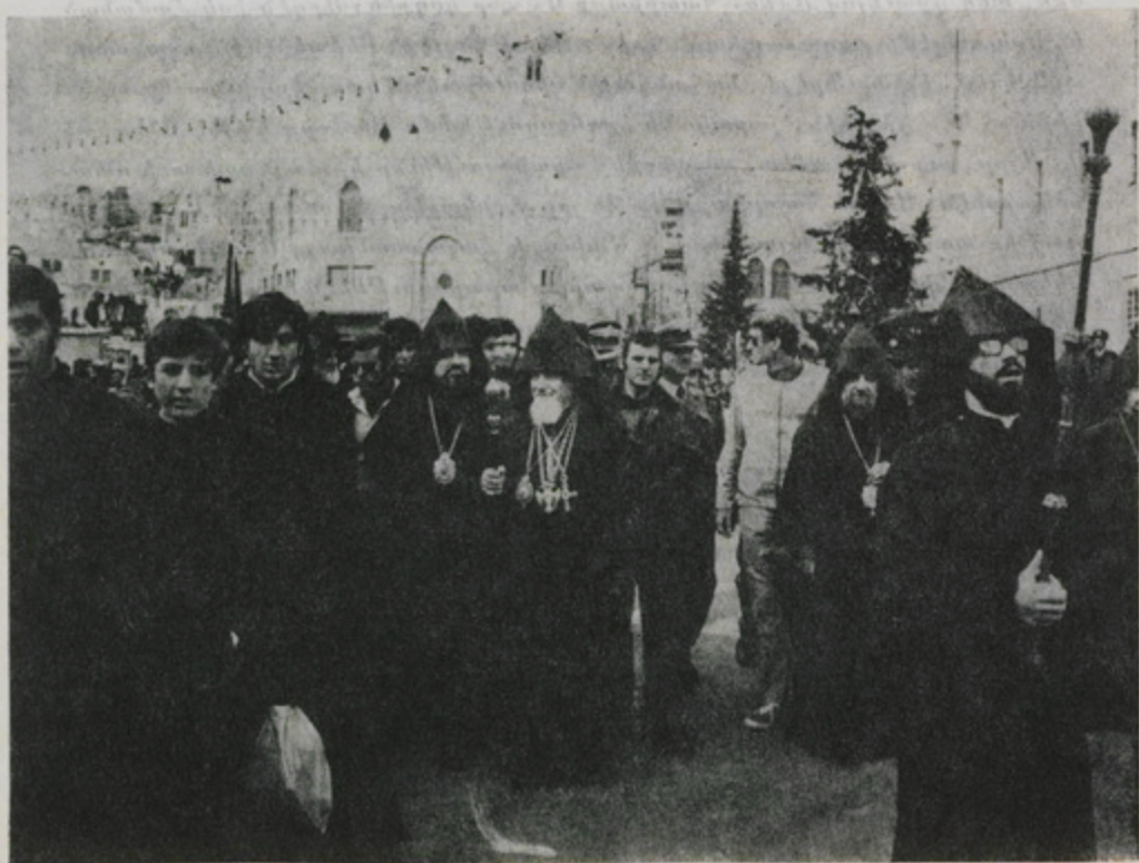
Ամեն. Պատրիարք Ս. Հայրը հանդիսաւոր մուտք կը գործէ Բեթղէհէմ:

Զանգերը կրկին կը զօղանջեն, Միաբանութիւնն ու հաւատացեալ ժողովուրդը եկեղեցի կանչելով: Ամեն. Պատրիարք Ս. Հայրը Թափօրով կ'իջնէ Ս. Մենդեան Տաճար ու «Հրաշափառ»-ով կ'առաջնորդուի սինապարդ դաւիթէն դէպի Ս. Այրը, իր ուխտն ու երկրպագութիւնը կատարելու: