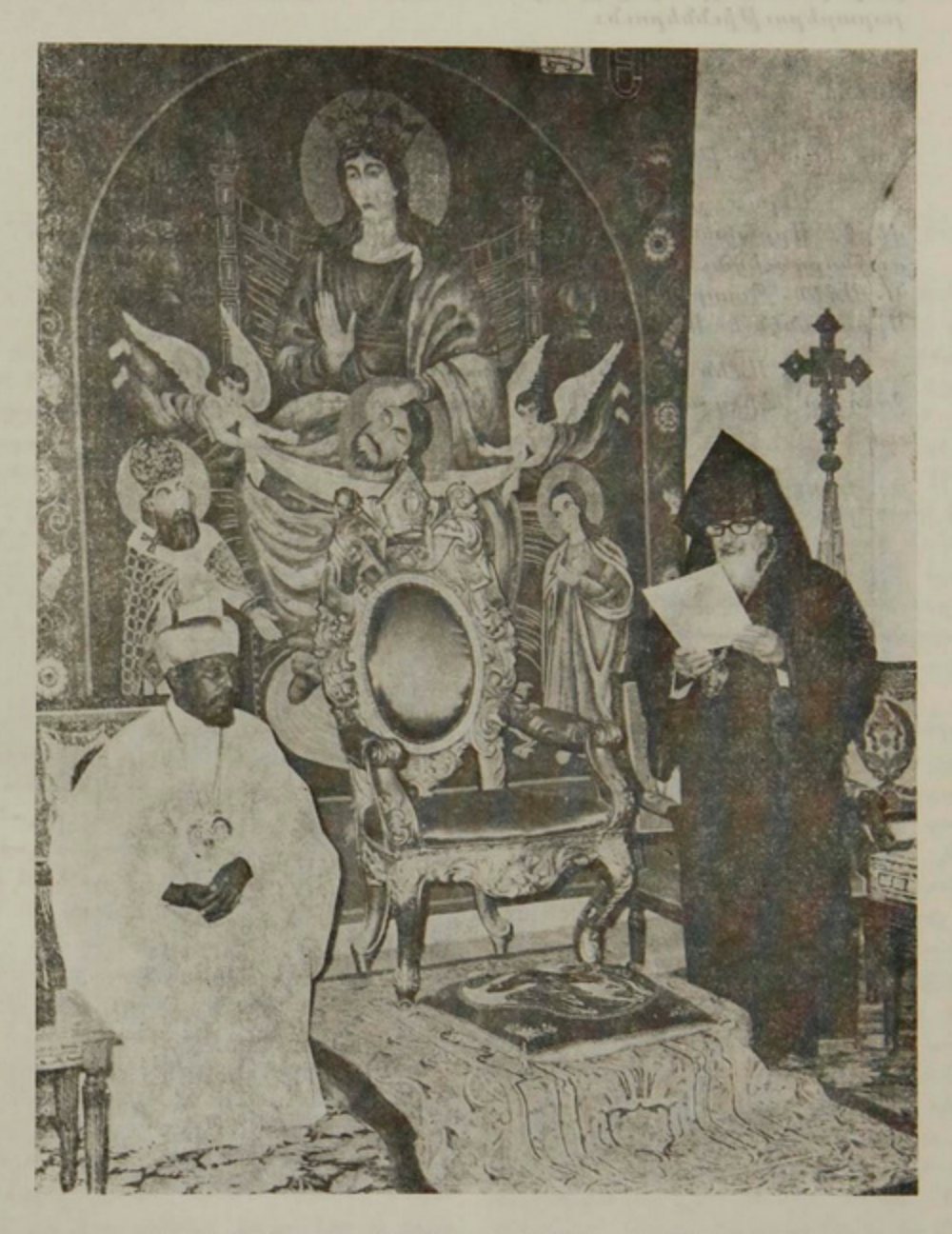
Ն. Ամեն․ Պատրիարք Ս․ Հայրը բարիգալուստի եւ ողջոյնի իր խօսքը կ'ուղղէ Ամենապատիւ Թէոֆիլոս Պատրիարքին