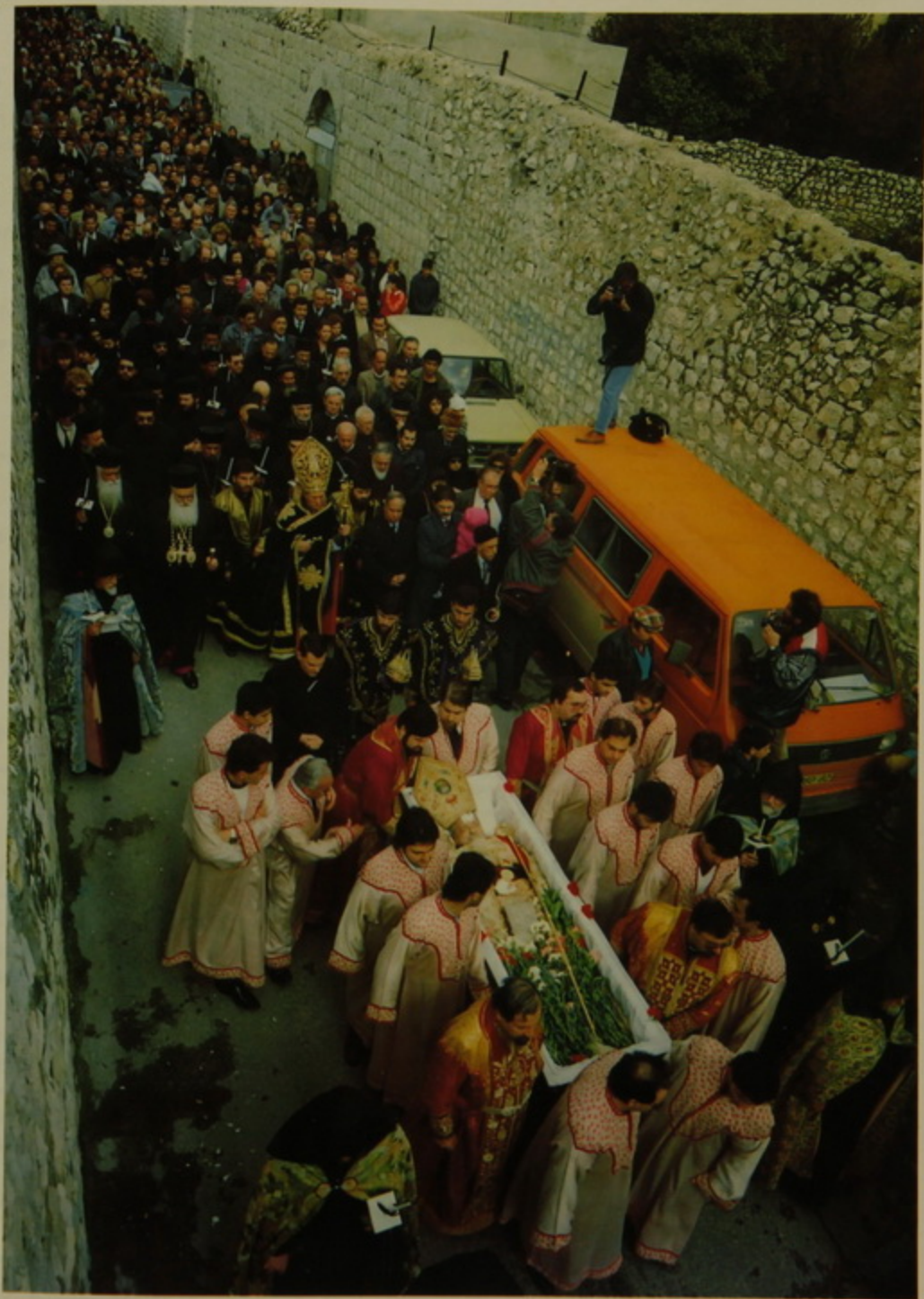
Դազարը դեպի Ս. Փրկիչ՝ համդիսապետութեամբ Տեղապահ Սրբազանի.