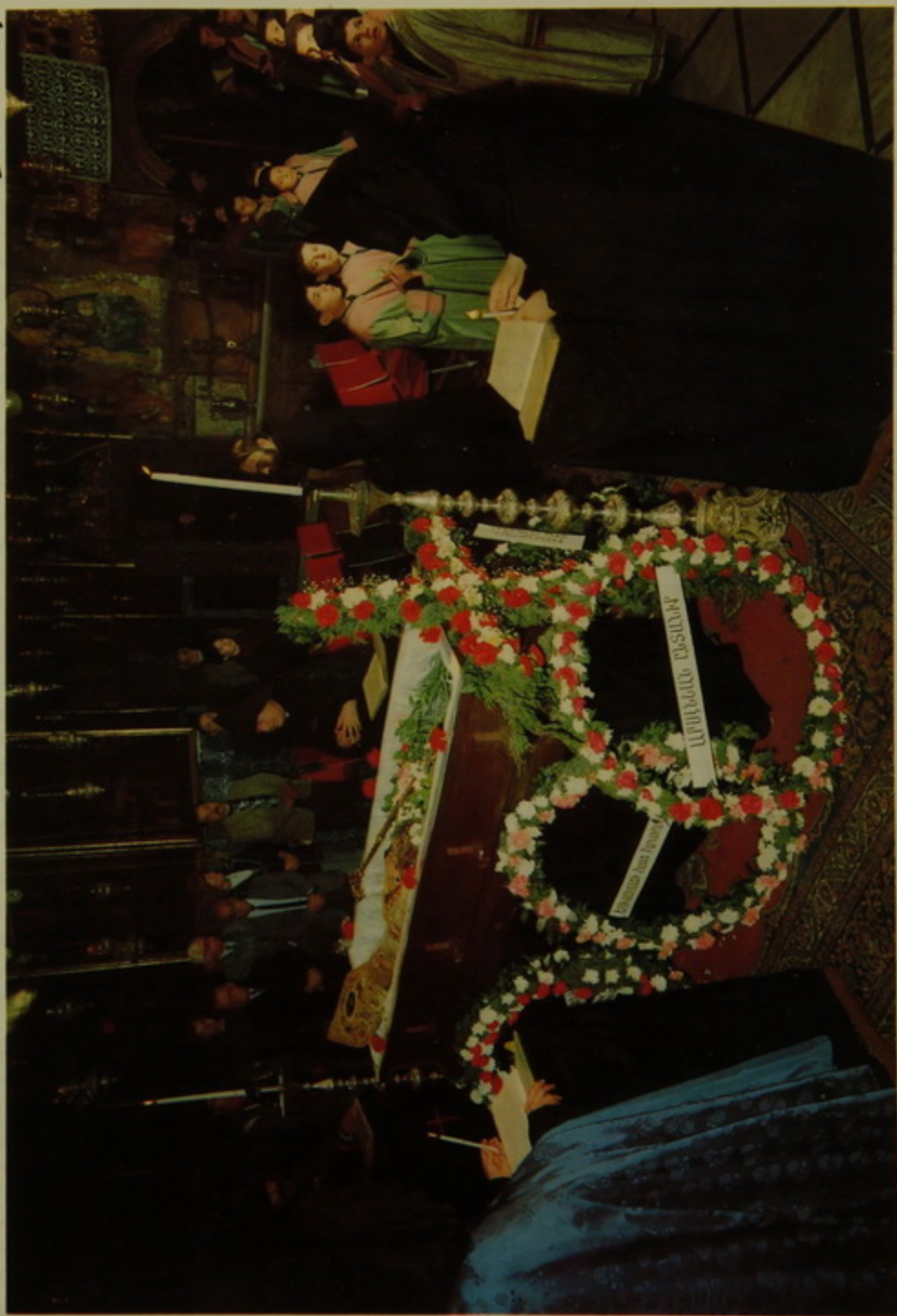
Կիրակի առաւօտ Առեւտրամանկերու ընթերցում.