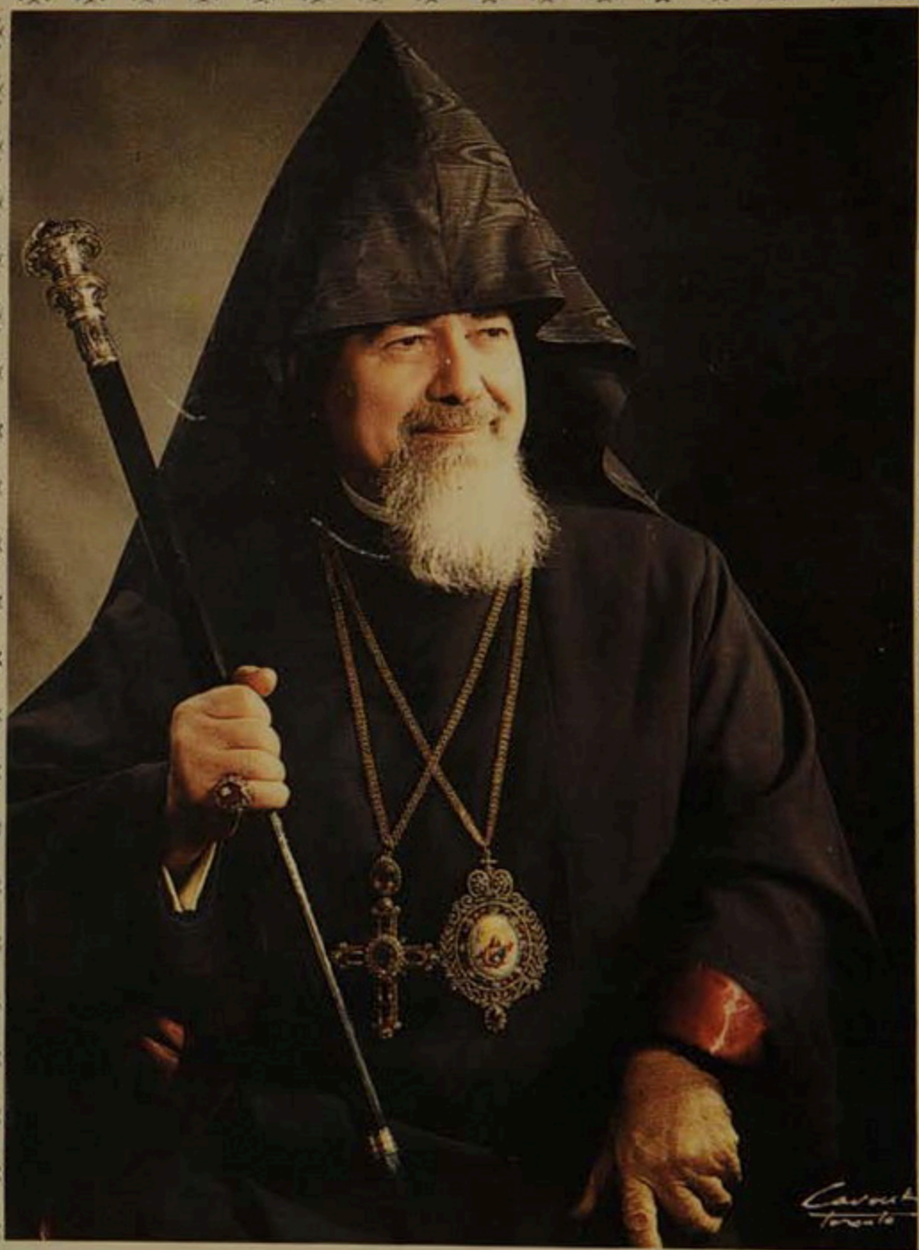
ԵՐԶԱՆԿԱՅԻՇԱՏԱԿ ԵՂԻՇԷ ՊԱՏՐԻԱՐԻ ՏԵՐՏԵՐԵԱՆ