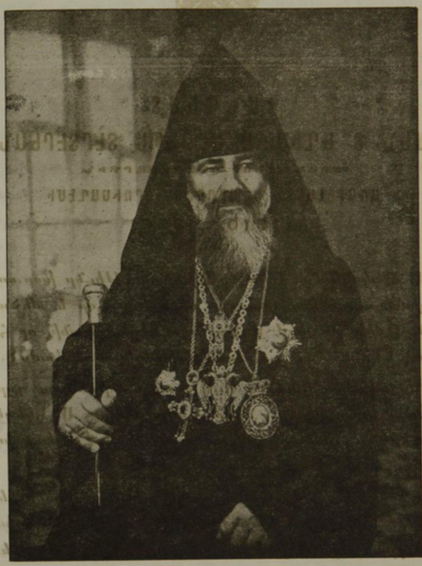
ՀԱՆԳՈՒՑԵԱԼ ԱՄԵՆ. Տ. ԵՂԻՇԷՍ. ՊԱՏՐԻԱՐԺ