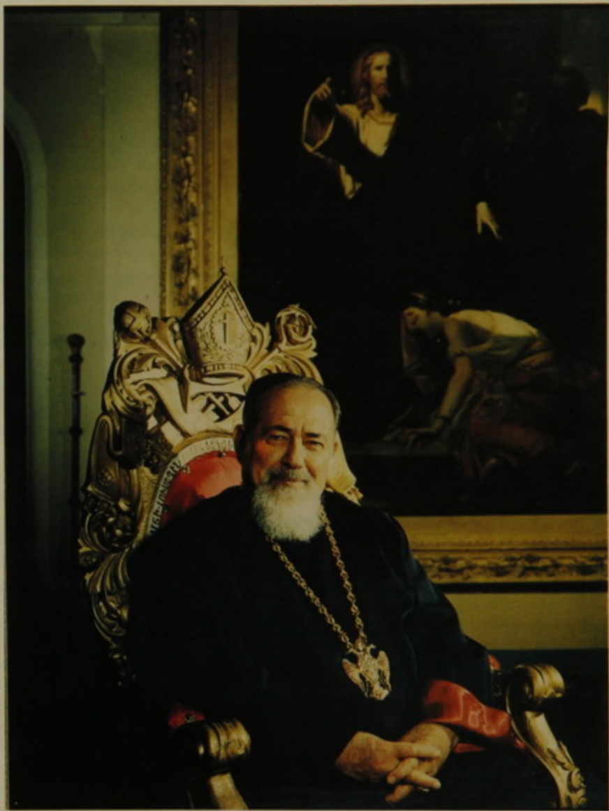
Երջանկայիշատակ Եղիշէ Պատրիարք Տէրտէրեան: