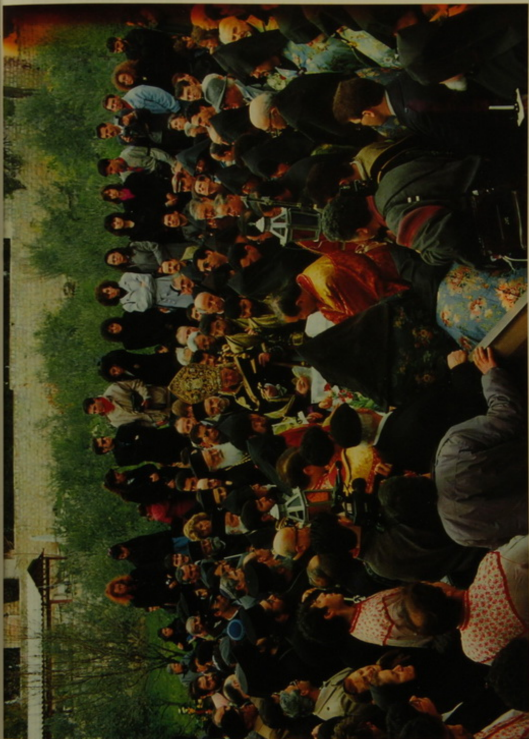
Ա. Փրկչի Գերեզմանատու մը.