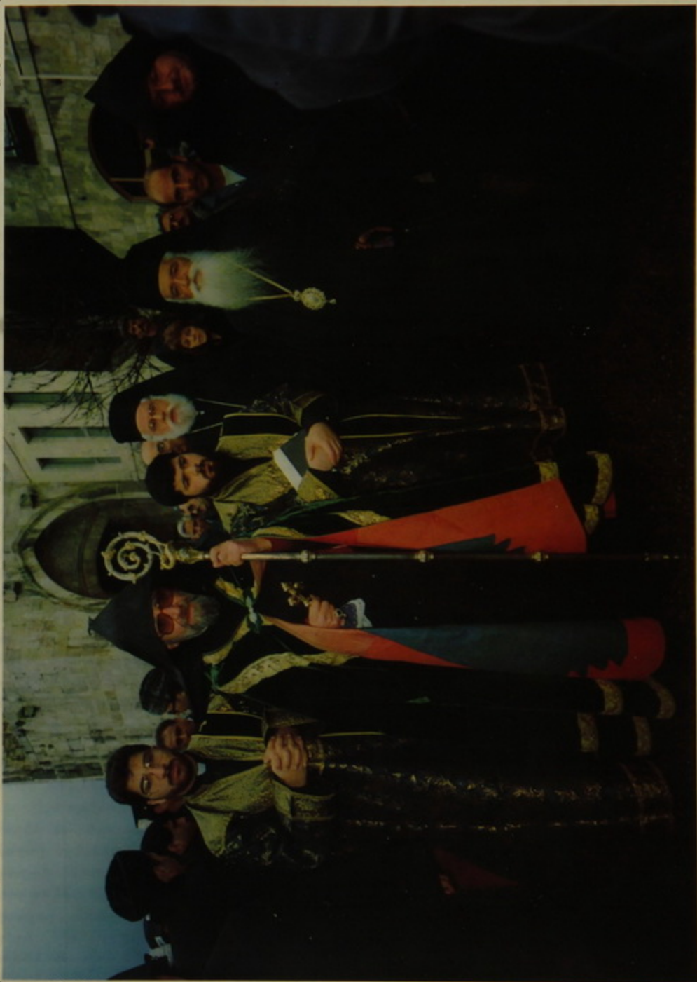
Արքամկալիչատան Պատրիարք Արքայան Հօր դազար Ծաբաթ օր կը դիմադրուի Դաւիթ դմմն.