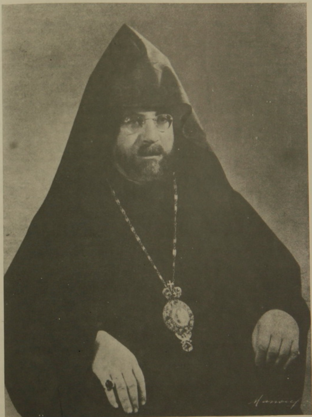
Երջամկայիշատակ Տ. ՏԻՐԱՆ Ա. ԱՐՔ. ՆԵՐՍՈՅԵԱՆ Նախկին Ընտրեալ Պատրիարք Ա. Երուսաղէմի