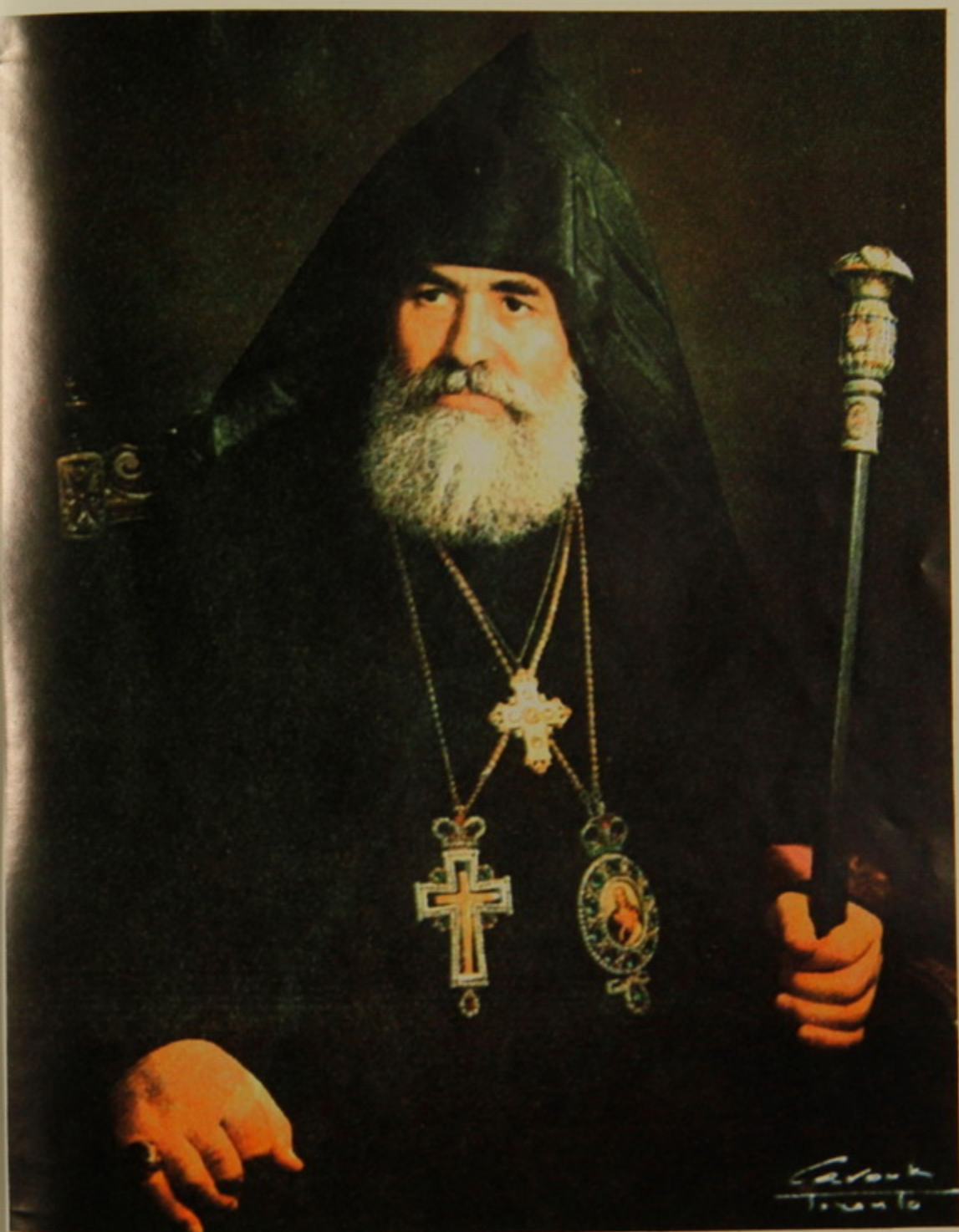
Երջանկայիշատակ Տ. ՇՆՈՐՀԻ Ա. ԱՐԲ. ԳԱԼՈՒՍՏԵԱՆ Պատրիարք Հայոց Թուրքիոյ