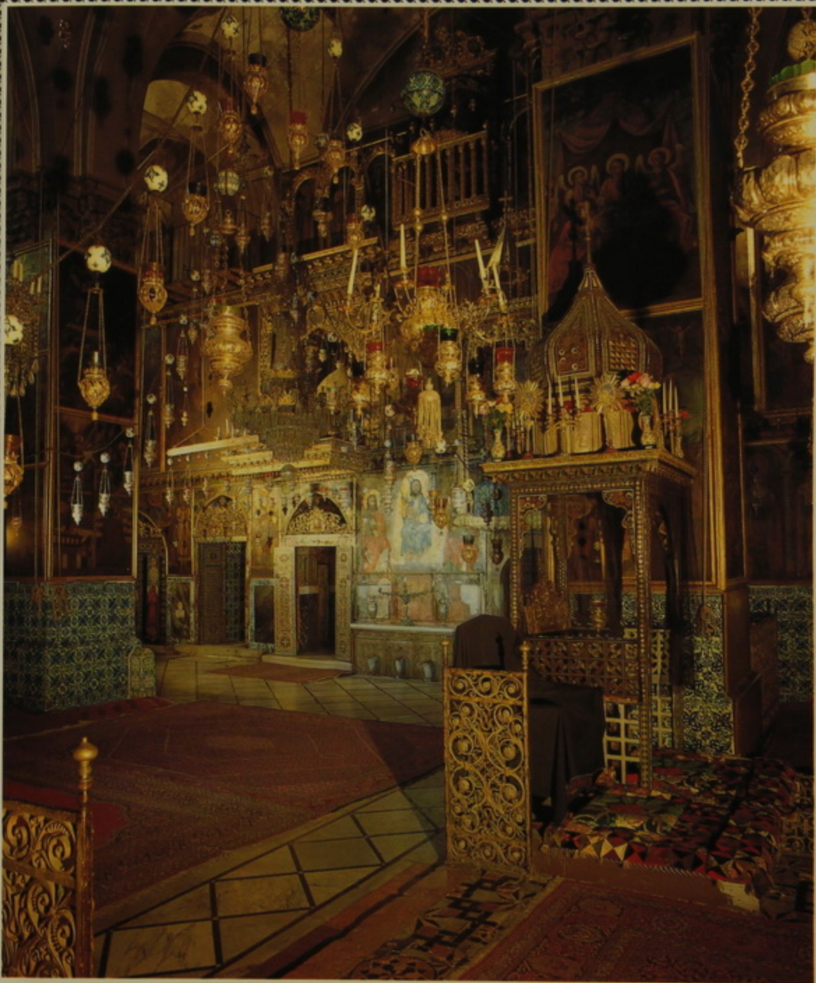
Առաքելական եւ Պատրիարքական Աթոռները սուգի մէջ.