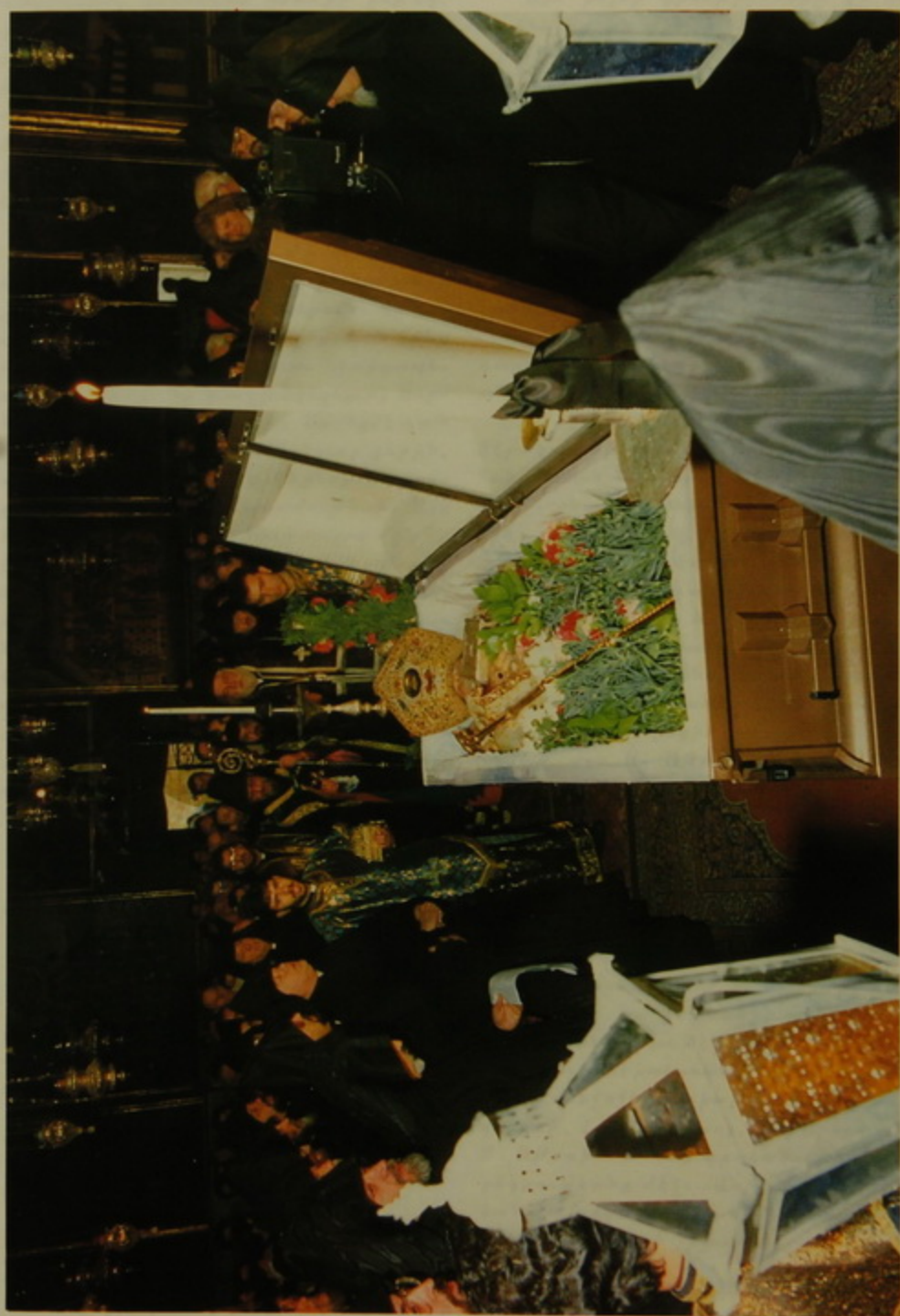
Երևանի տաճարի Կաթողիկոսի զմեռելու արարողության ժամանակ Սուրբ Իսահակի կողմից բարձրացվող խաչի վրա