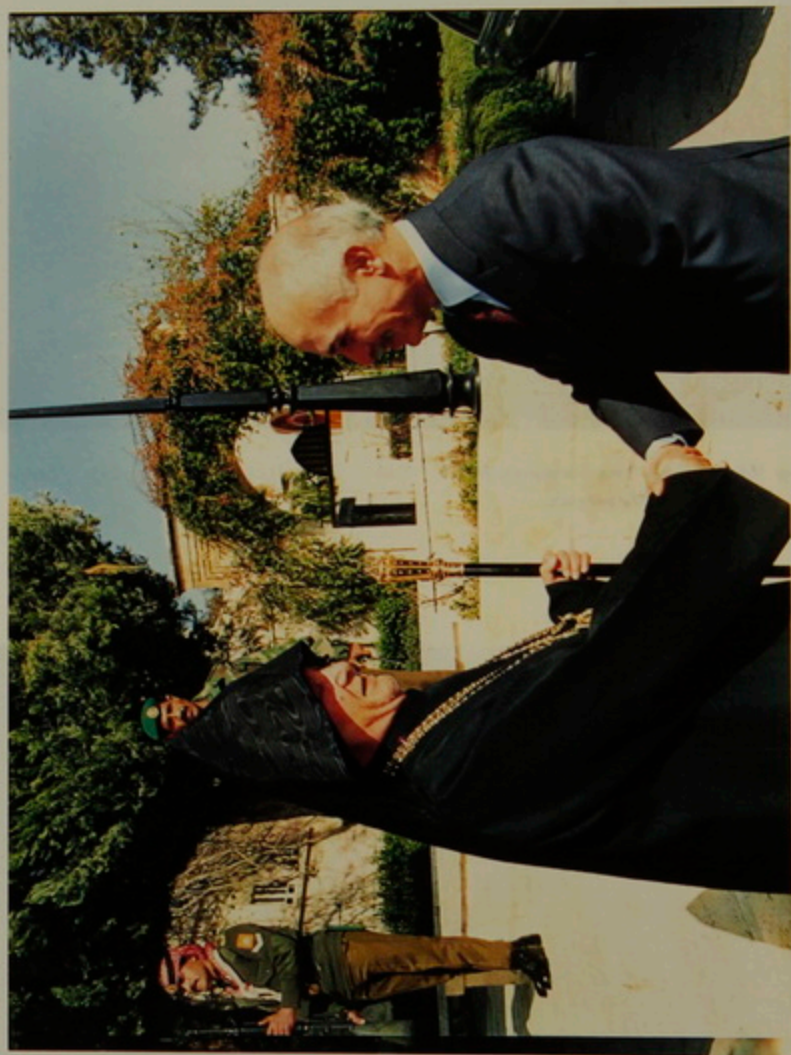
Թորգոմ Պատրիարք Հայրէ Հիւսէյն Բազաճեան հրաժեշտ անելու պահին, 25 Յունիս 1992: