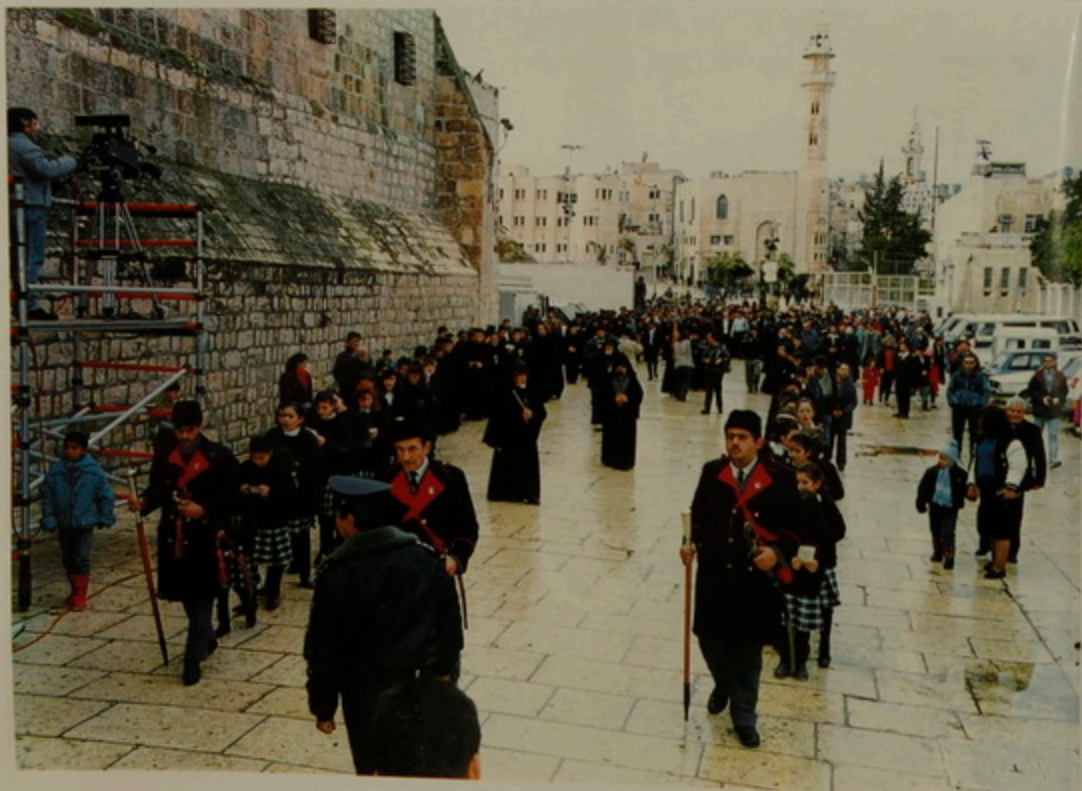
18 Յունուար 1992 Հայկական Ծնունդ, Բեթղեհէմի Հրապարակին Հայոց Վանք թափօ- րով մուտք, Սրբոց Թարգմանչաց Վարժարանի ուղղակիորէն ժամանակցութեամբ: