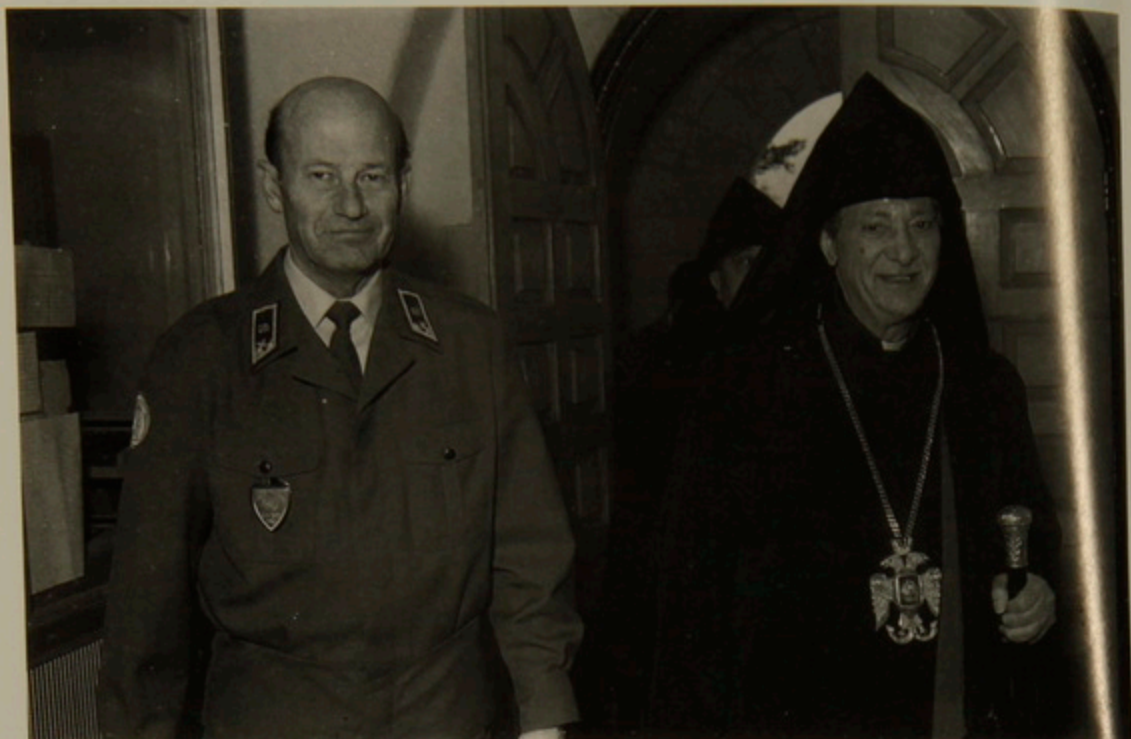
Միացեալ Ազգաց Վերահսկիչ Կազմակերպութեան Տան մէջ Ղեկավար Մէյճըր Հանս Զրիսթընսըն եւ Պատրիարք Սրբազան: