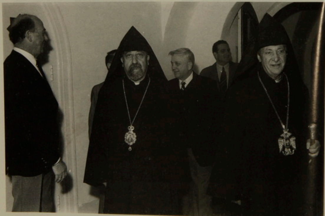
Այցելութիւն Միացեալ Ազգաց Վերահսկիչ Կազմակերպութեան Ղեկավար Մէյճըր Ճէնըրլին, Դաւիթ Արք. ՍաՀակեան, Պր. Եղիա Տիգրանեան եւ Պատրիարք Սրբազան: