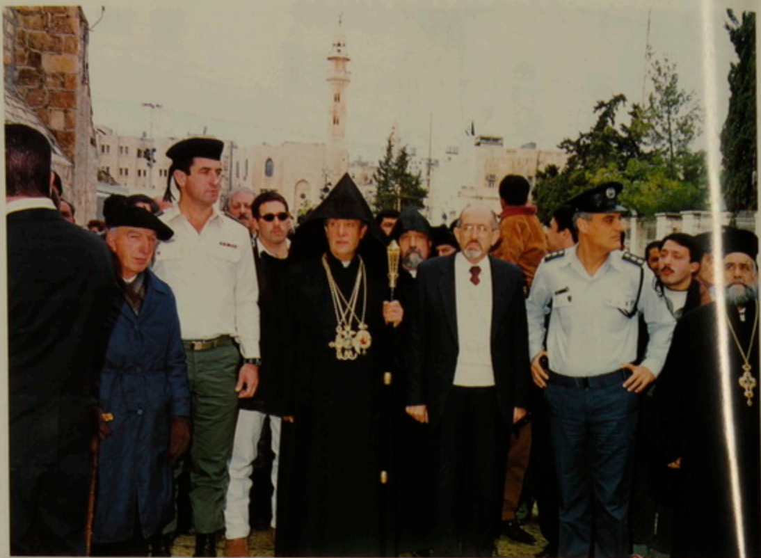
18 Յունուար 1992, Հայկական Ծնունդ, Բեթղեհէմի Հրապարակի մուտքին Հայոց Պատրիարքը զիմաւորող Հոգեւոր եւ Պետական ներկայացուցիչներ: