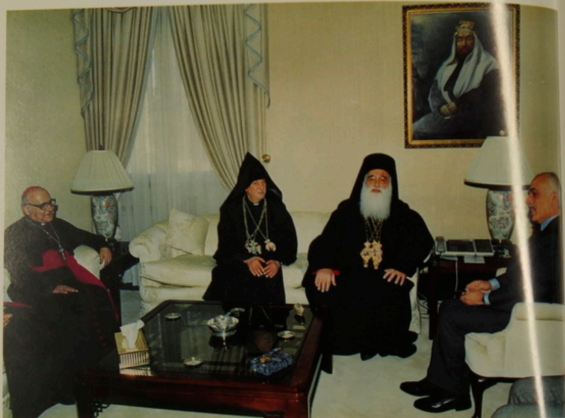
Լատինաց Միշէլ Սապահ, Հայոց Թորգոմ եւ Յունաց Տէոտորոս Պատրիարքներ Յորդանանի Հիւսէյն Թագաւորի ներկայութեան, 25 Յունուար 1992: