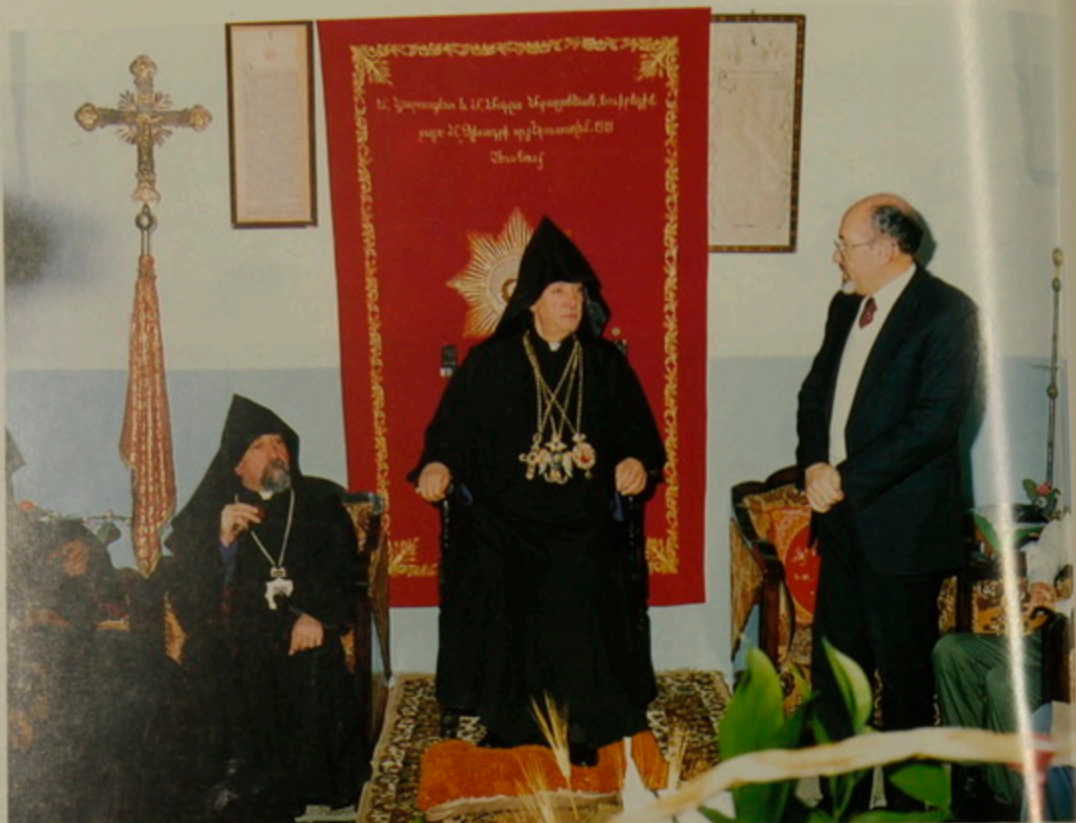
18 Յունուար 1992, Հայկական Ծնունդ, Բեթղեհէմ Մուտք, Հայոց Վանքին մէջ քաղաքապետարանի անունով "Բարի գալուստի" խօսքեր: