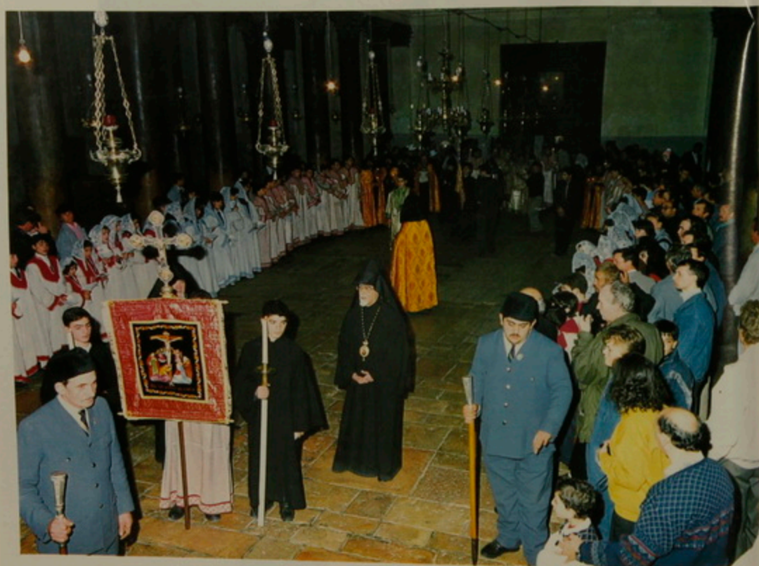
18 Յունուար 1992, Հայկական Ծնունդ, Երաթի յետ միջօրէին, Բեթղեհէմի Ծննդեան Տաճարէն Հանդիսաւոր մուտք: