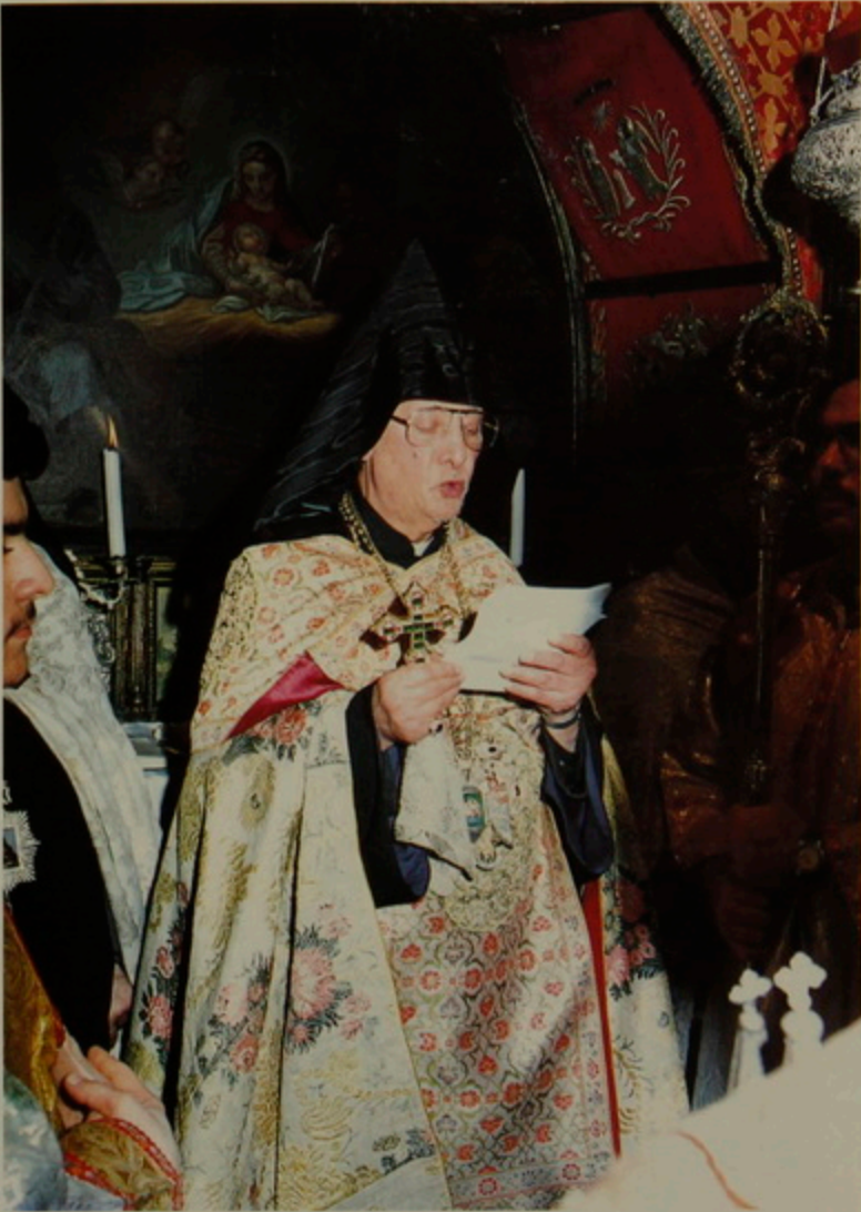
18 Յունուար 1992 Հայկական Ծնունդ, Բեթղեհէմի քարայրին մէջէն, կէս գիշերին, Թորգոմ Պատրիարք Ծննդեան իր պատգամը կու տայ: