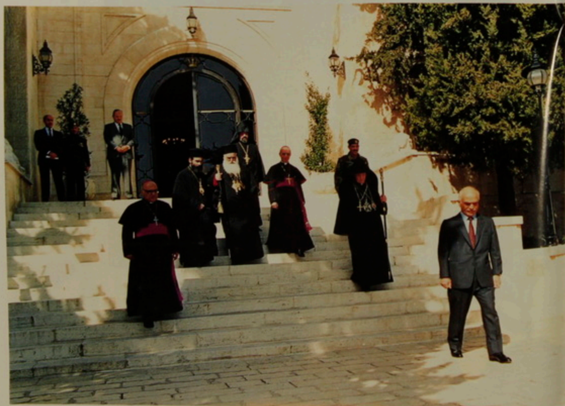
Լատին, Յոյն եւ Հայ Պատրիարքներ իրենց ընկերակիցներով, Յորդանանի Հիւսէյն Թագաւորէն Հրաժեշտ առնելու պահուն: