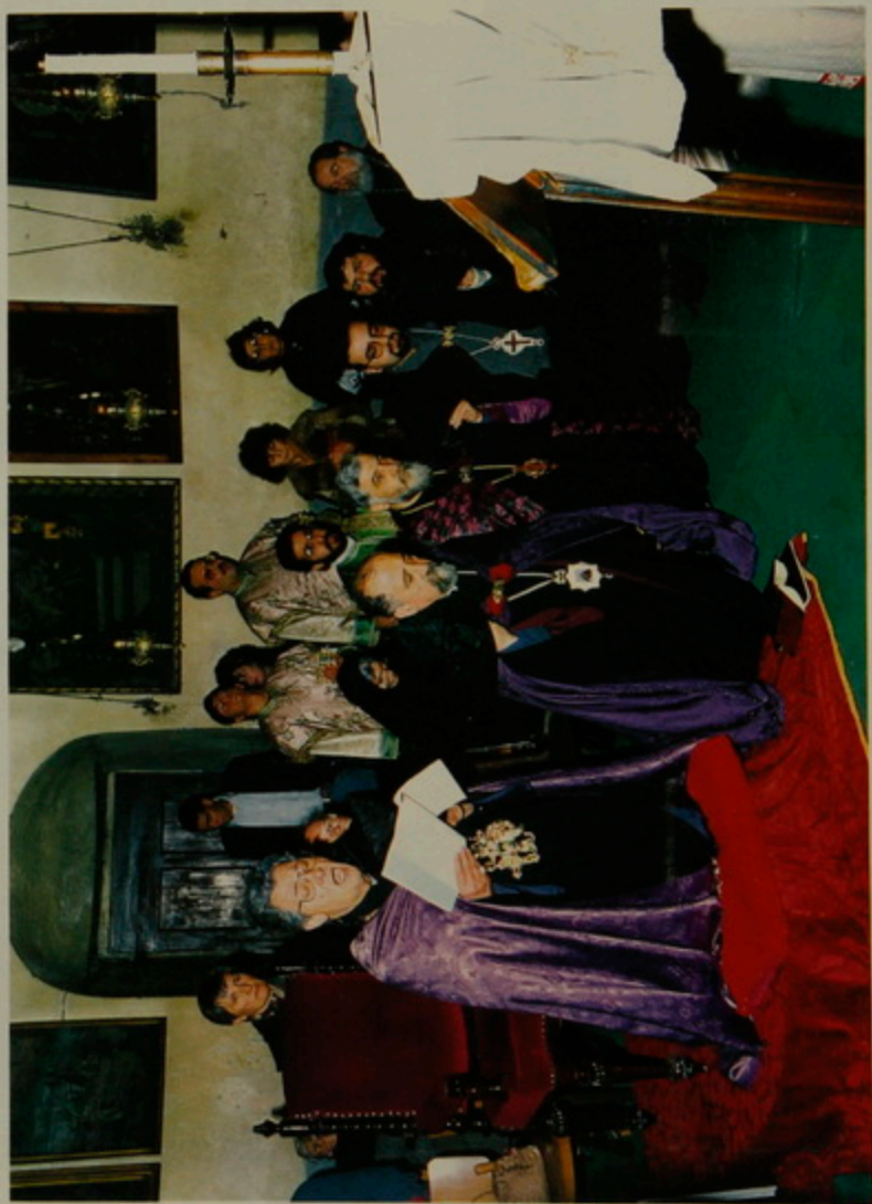
18 Բուժուհար 1992, Հաճկական Ենուժղ, Եարաթ յետ Միջօրէին, ԲեթղէճէՄի Տաճարին Հաճկական բաժինին մէջ Ճրարալոյցի պաշտամունք: