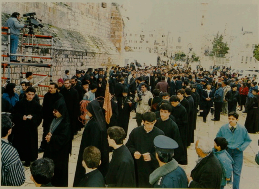
18 Յունուար 1992 Բեթղե՛մի Հրապարակը, Հայկական Ծնունդ, Թափօրով մուտք: