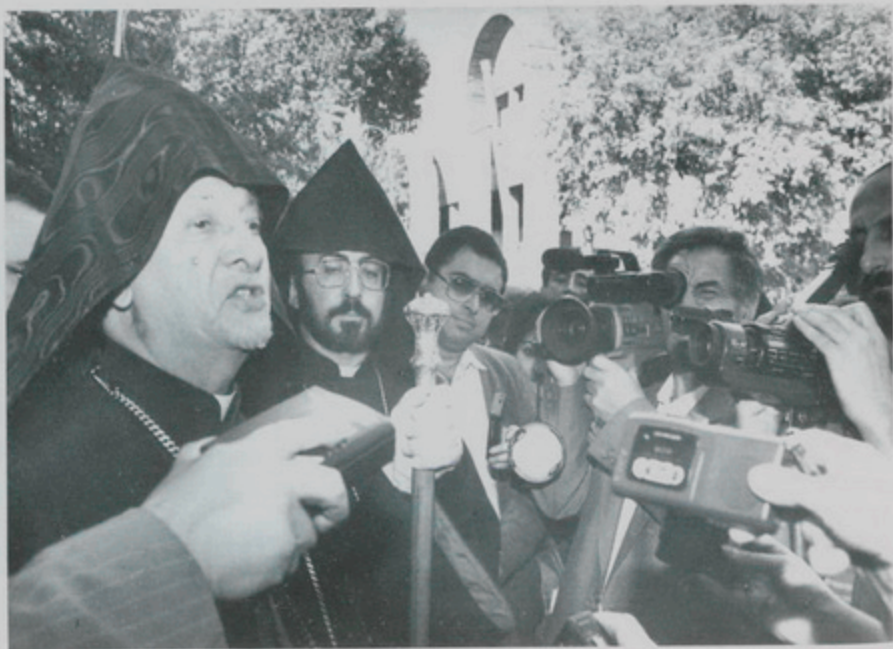
4 Հոկտ. 1994., ԳՇ. Երեւան, Ամերիկայի Արեւելեան Թեմի Հայ Օգնութեան փոնտի նոր գրասենեակի բացման օրհնութեան խօսք Թորգոմ Պատրիարքի.