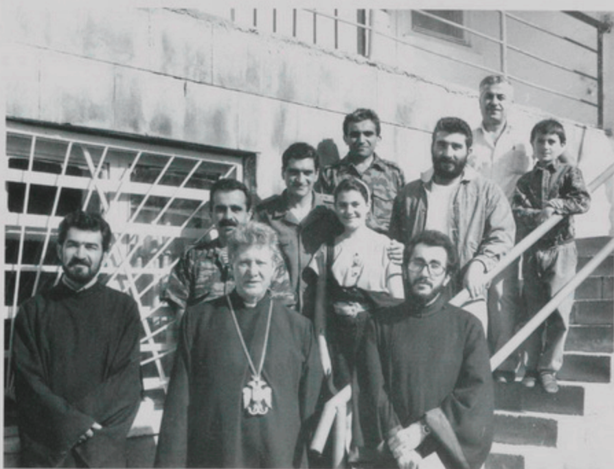
11 Սեպտ. 1994, Կիր., Տաթևի վանքի ստորոտը, Սատանի Կամուրջին մօտ "Զինուորաց Հիւանդանոցը". Սիւնեաց Թեմի Առաջնորդ Տ. Արքահամ Մ. Վրդ., Թորգոմ Պատրիարք, Տ. Միխայէլ Մ. Վրդ., հիւանդանոցի բնուորականներ