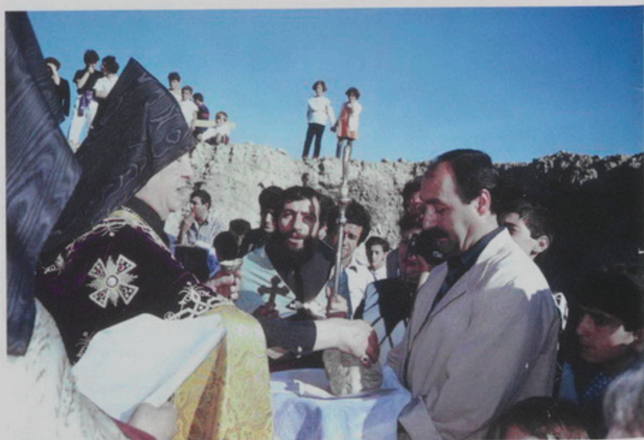
12 Հոկտ. 1994, ԴՇ., Շիրակի Թեմի Սպիտակի նոր կառուցուելիք եկեղեցւոյ 16 հիմնաքարերու օծումը