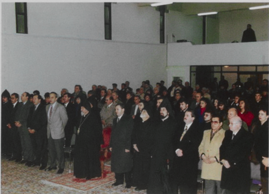
19 Դեկտ. 1994, ԲՇ., Հայաստանի Արտաքին Գործոց Նախարար Վահան Փափագեանի եւ ընկերակիցներու հանդիպումը Նրուսադէմի Միաբանութեան եւ Հայ Հասարակութեան հետ, Ժող. Վարժարանի սրահին մէջ