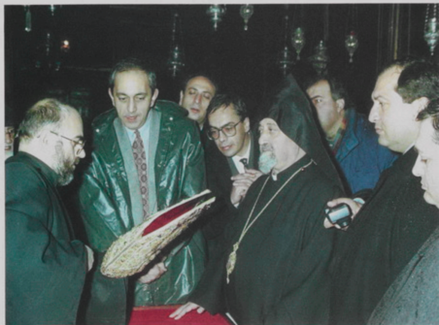
19 Դեկտ. 1994, ԲՇ., Երուսաղէմի Սրբոց Յակոբեանց Տաճար, Գանձատունէն խոյրի եւ այլ իրերու ցուցադրում. (Զախէն Աջ)՝ Բարսեղ Վրդ. Գալէմտէրեան, Արտաֆին Գործոց Նախարար՝ Վահան Փափագեան, Գիւղատնտեսութեան Նախարար՝ Աշոտ Ոսկանեան, Երեւանի Կենտպանի տնօրէն՝ Բագրայտ Աստրեան, Լուսարարապետ Դաւիթ Արք. Սահակեան, Անգլիոյ Դեսպան՝ Արմէն Սարգիսեան, Եգիպտոսի մէջ հայ դեսպան՝ Նեդուարդ Նալպանտեան