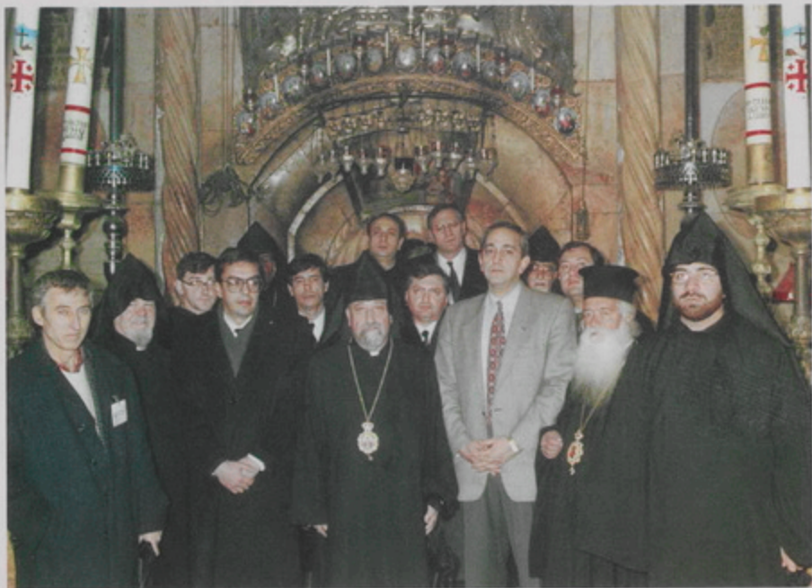
19 Դեկտ. 1994, ԲՇ., Հայաստանի Արտաֆին Գործոց Նախարար Վահան Փափագեանի եւ ընկերակիցներու այցը Երուսաղէմի Ս. Յարութեան Տաճարին