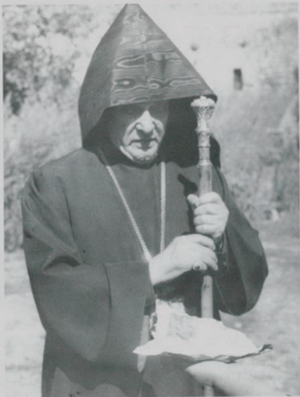
11 Սեպտ. 1994, Կիր., Տաթևի Վանք բերուած մատաղ-ոչխարի աղի օրհնութիւն