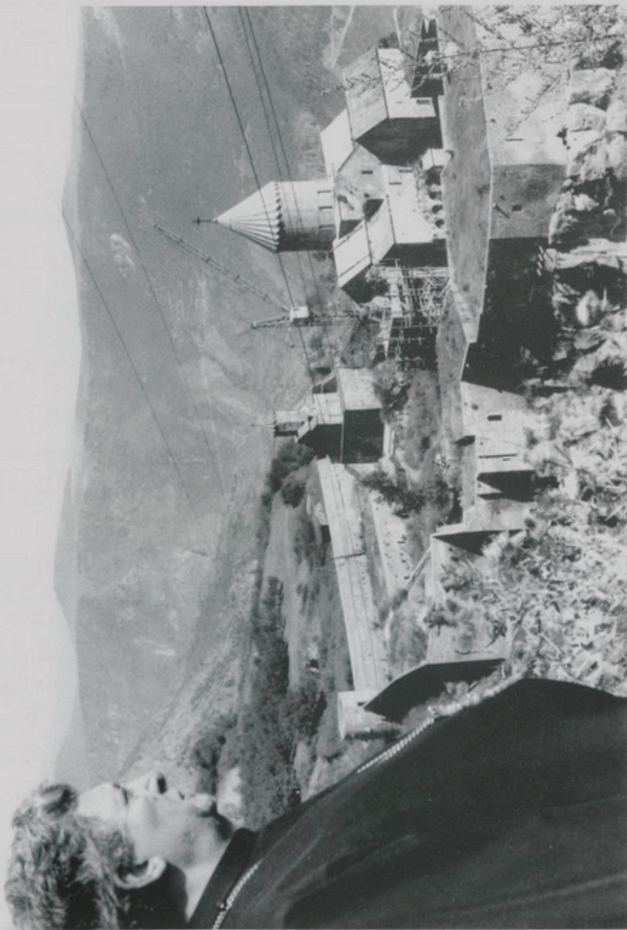
11 Սեպտ. 1994, Կիր., Տաթևի վանքի Հարաւ Արեւմուտքի համալսարանի լեռնալանջէն դիտում