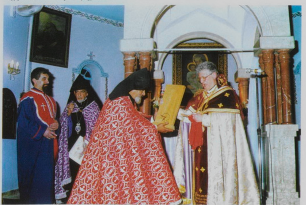
30 Սեպտ․ 1998, Դշ․ Օծում Ս. Թադէոս եկեղեցւոյ Խորանի, Ամման, Յորդանան։ Վահան Եպս-Թօփալեանի Արք-ութեան Աստիճան ստանալու առիթով, Թորգոմ Պատրիարք նուիրեց սկիհ մը և ժամացոյցով խաչքար մը։ digitised by A.R.A.R.@