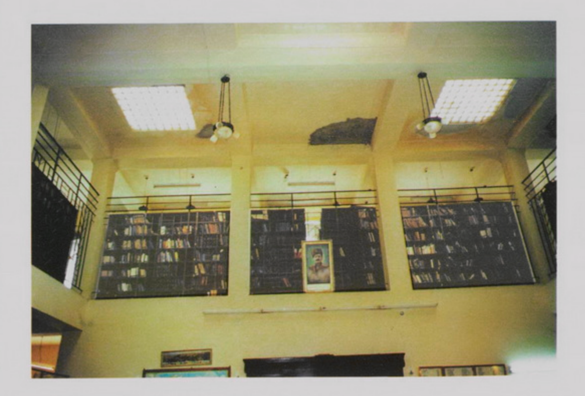
Յուլիս 1998, Գալուստ Կիւլպէնկեան Մատենադարան, շէնքը վերանորոգման կարօտ, նաեւ գիրքերու դարանները։