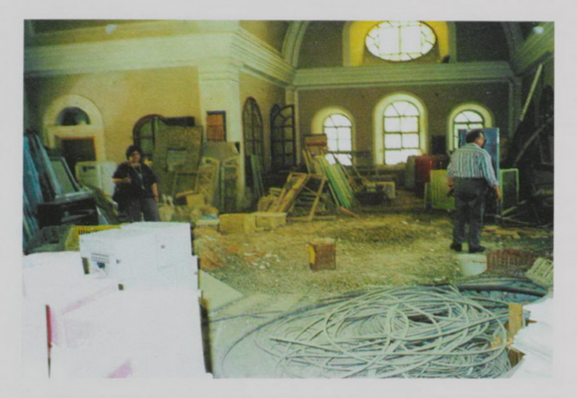
0գոստոս 1998, Ժառանգաւորաց Վարժարանի նախկին ճեմարանը աւերակ, վերանորոգման կարօտ։