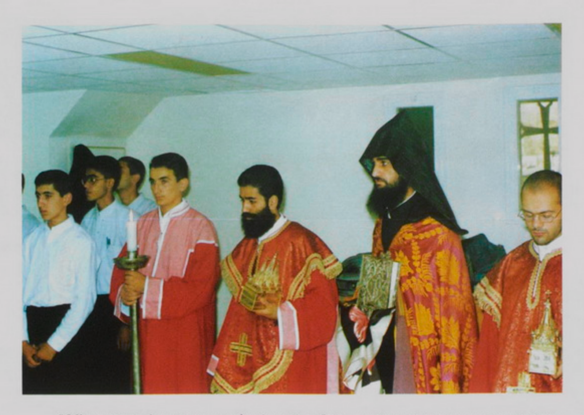
23 Սեպտ․ 1998, Ժառանգաւորաց Վարժարանի եւ Ընծայարանի տարեմուտի արարողութեան մաս կը կազմէ Աւետարանէն «Սերմանացանի Առակին» ընթերցումը։