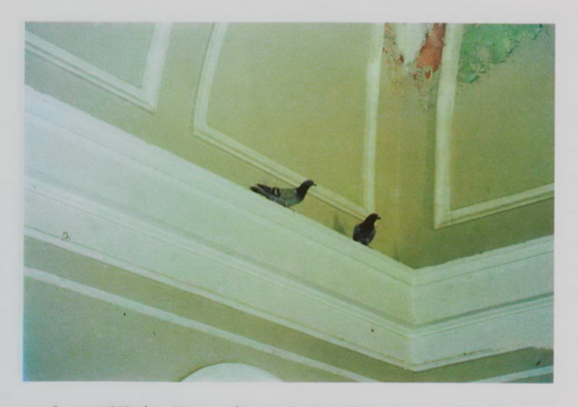
Օգոստոս 1998, Ժառանգաւորաց Վարժարանի նախկին ճեմարանը աւերակ, աղաւնետուն։