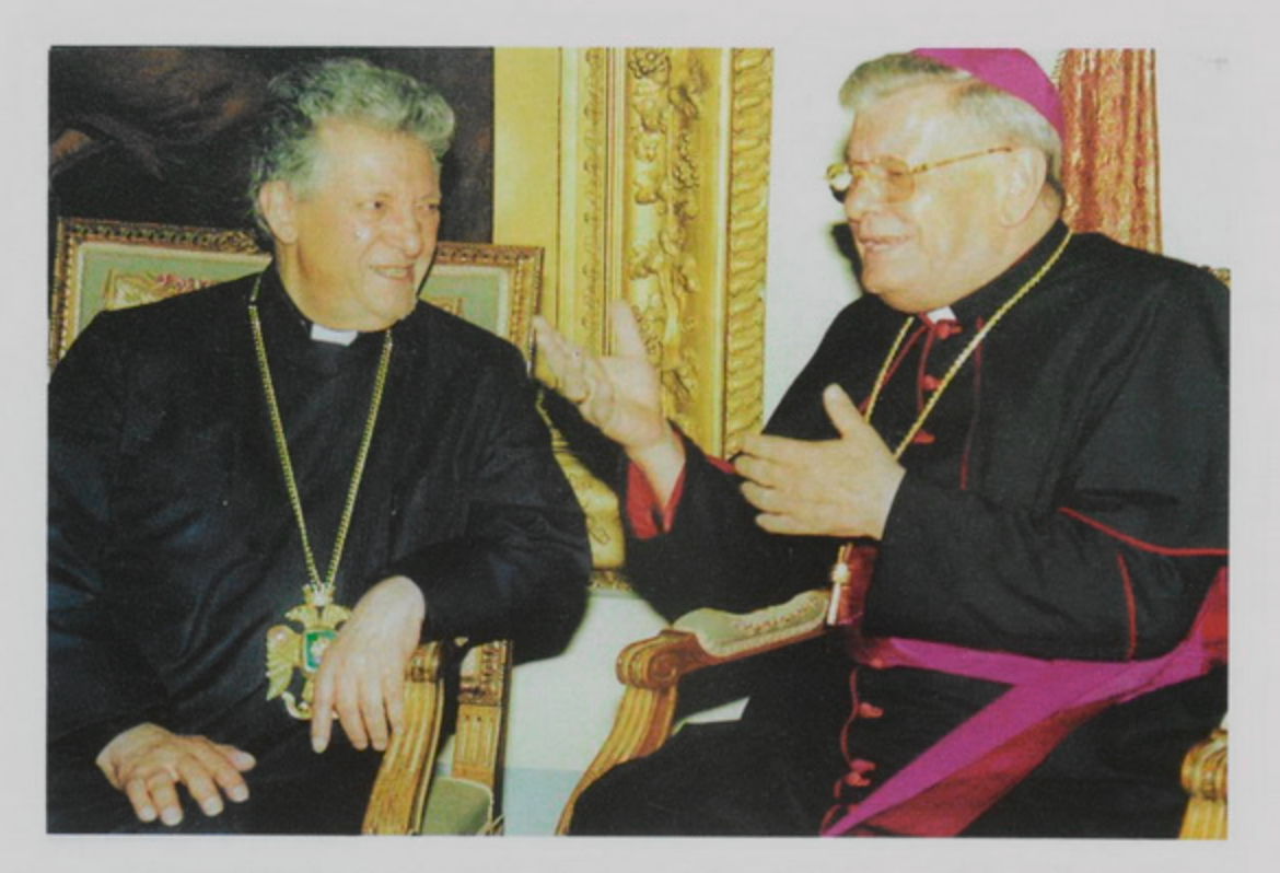
Ձ Սեպտ․ 1998, Երուսաղեմի մէջ նոր նշանակուած Պապական նուիրակ, Փիեթըն Սամպի, այցելեց Պատրիարք՝ Սրբազան Հօր։