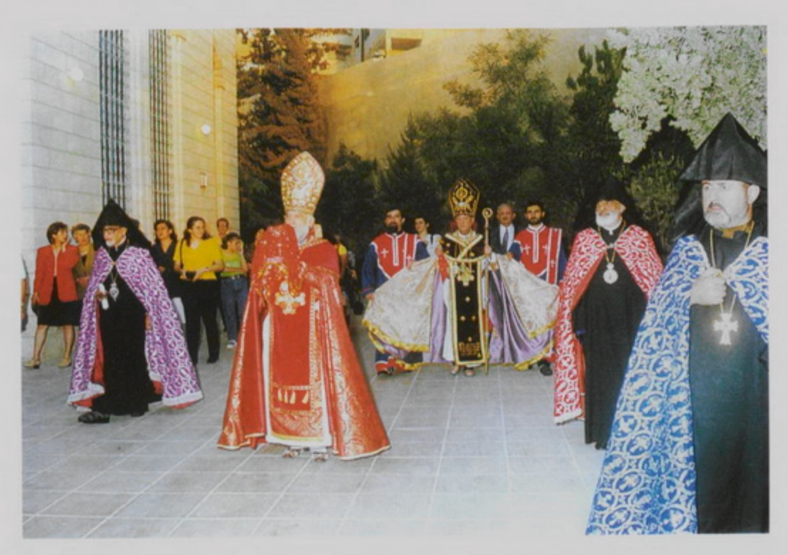
30 Սեպտ․ 1998, Գշ․ Օծում Ս․ Թադէոս Եկեղեցւոյ խորանի, Ամման, Յորդանան, թափօրով դեպի եկեղեցի։ Ձախէն Աջ՝ Զաւէն Արք․ Չինչինեան Եգիպտոսի Առաջնորդ, Սեւան Եպս․ Ղարիպեան՝ Միւռոնակիր եւ Պատարագիչ․ Փէշակիր Համբարձում Վրդ․ Քէշիշեան, Թորգոմ Պատրիարք, փէշակիր Ընծանուէը Արղ․ Բարախանեան, Անթիլիասէն՝ Վարդան Արք․ Տէմիրնեան, Պոլիսէն՝ Արամ Վրդ․ Աթէշեան։