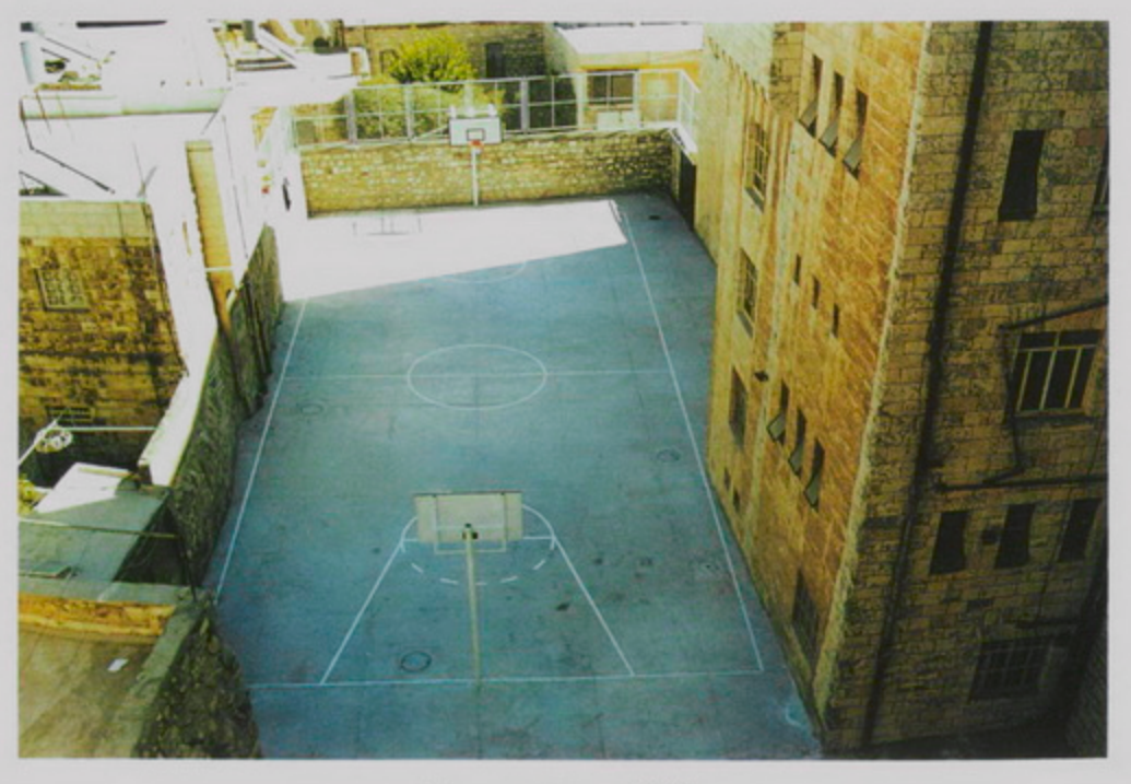
Սեպտեմբեր 1998, Սրբոց Թարգմանչաց Վարժարանի խաղավայրը նորոգուած