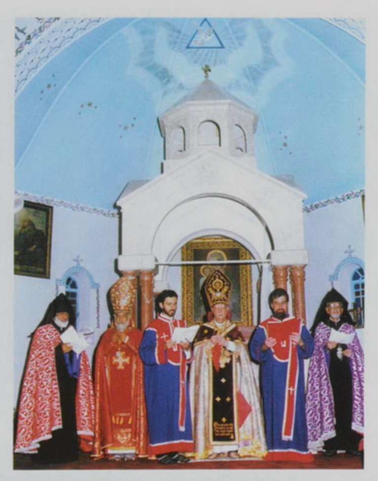
30 Սեպտ. 1998, Դշ. Օծում Ս. Թադէոս Եկեղեցւոյ խորանի, Ձախեն Աջ՝ Վարդան Արք. Տէմիրնեան, Սեւան Եպս. Ղարիպեան, Ընծանուէր Արդ. Բարախանեան, Թորգոմ Պատրիարք, Համբարձում Վրդ. Քէշիշեան, Ջաւէն Արք. Չինչինեան։