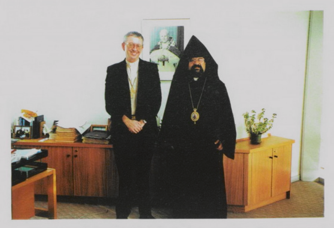
8 Յունիս 1998, Auckland, New Zealand այցելութեան առիթով՝ Հայրապետական Պատուիրակ Ադան Արք. Պալիօգեան եւ Հռովմէական Կաթոլիկ Patrick Dunn Եպիսկոպոս։