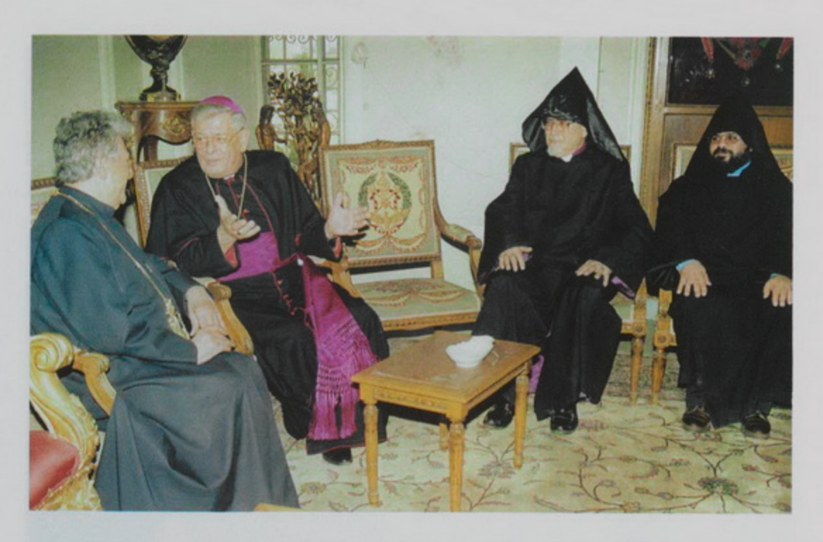
2 Սեպտ. 1998, Երուսաղէմի մէջ նոր նշանակուած Պապական նուիրակ, Փիէթրօ Սամպիի այցելութիւնը Պատրիարք Սրբազան Հօր։ Դիմաւորողներ՝ Արիս Եպս. Շիրվանեան եւ Աւետիս Արդ. Իփրանեան։