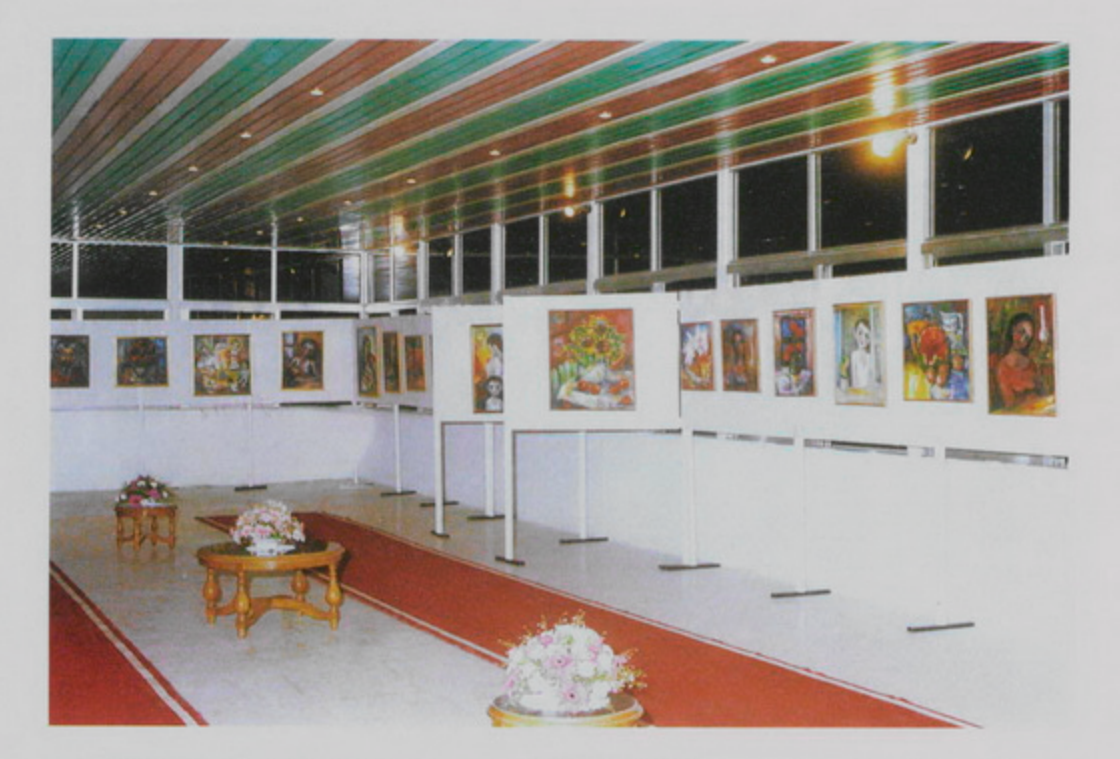
29 Սեպտ. 1998, Գլ. Ամման, Յորդանան, Կիւլպէնկեան Իւզպաշեան Վարժարանի նորակառոյց սրահին մէջ նկարներու ցուցահանդէս Ընծանուէր Աբդ. Բարախանեանի։