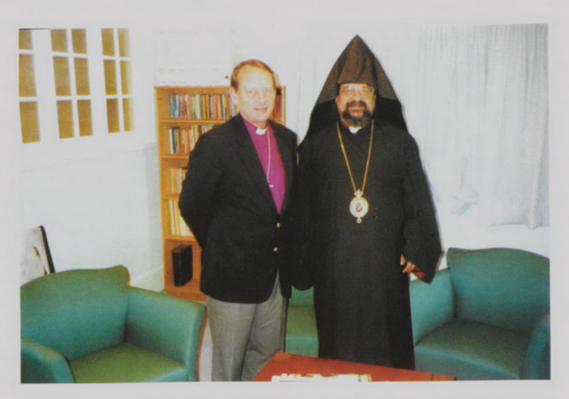
8 Յունիս 1998, Auckland, New Zealand այցելութեան առիթով՝ Հայրապետական Պատուիրակ Աղան Արք. Պալիօգեան եւ Անկլիքան Եկեղեցւոյ John Patterson Եպիսկոպոս։