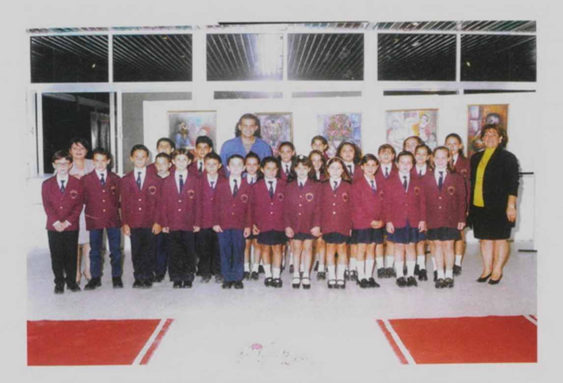
29 Սեպտ․ 1998, Գշ. Ամման, Յորդանան, Կիւլպէնկեան Իւզպաշեան Վարժարանի նորակառոյց սրահին մէջ, վարժարանի երգչախումբը, Ընծանուէր Աթդ. Բարախանեանի նկարներու ցուցահանդեսի բացումին։