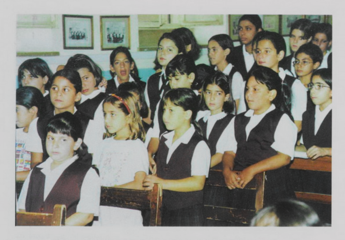
1 Սեպտ. 1998, Գշ. առաւօտ 8ին, տարեմուտ Ս. Թարգմանչաց Վարժարանի։