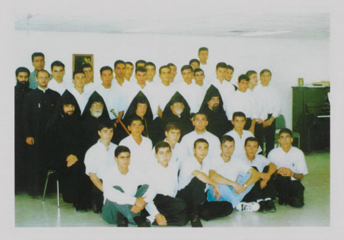
23 Սհպտ. 1998, տարեմուտ Ժառանգաւորաց Վարժարանի եւ Ընծայարանի։ Առաջամասի տասնրմէկ աշակերտները Հայաստանէն նոր ժամանած ուսանողներն են։