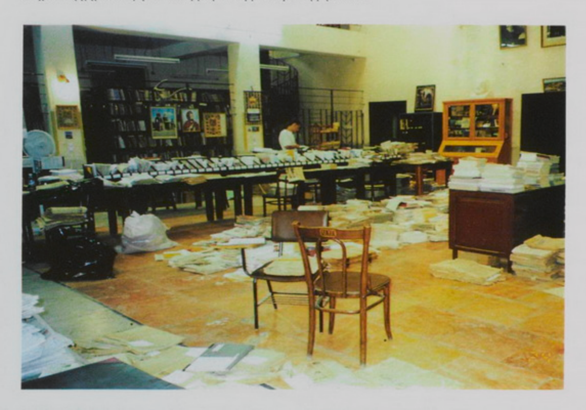
Յուլիս 1998, Գալուստ Կիւլպէնկեան Մատենադարանի յատակին՝ պարբերաբերթեր, համակարգիչի մէջ արձանագրուելու համար։