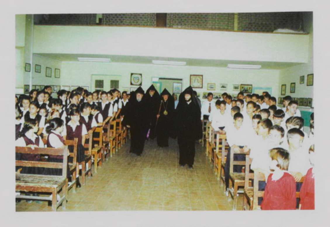
1 Սեպտ. 1998, Գչ. առաւօտ Ցին, տարեմուտ Ս. Թարգմանչաց Վարժարանի։