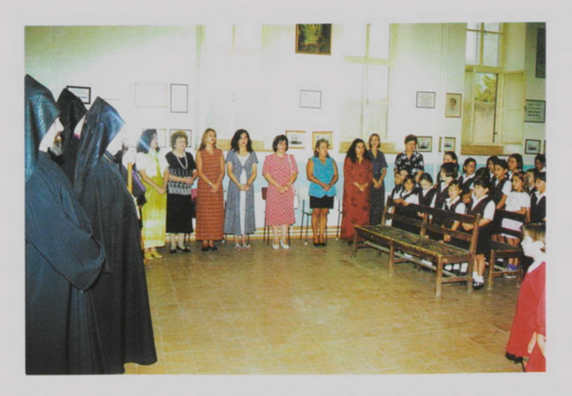
1 Սեպտ. 1998, Գշ. առաւօտ 8ին, տարեմուտ Ս. Թարգմանչաց Վարժարանի։