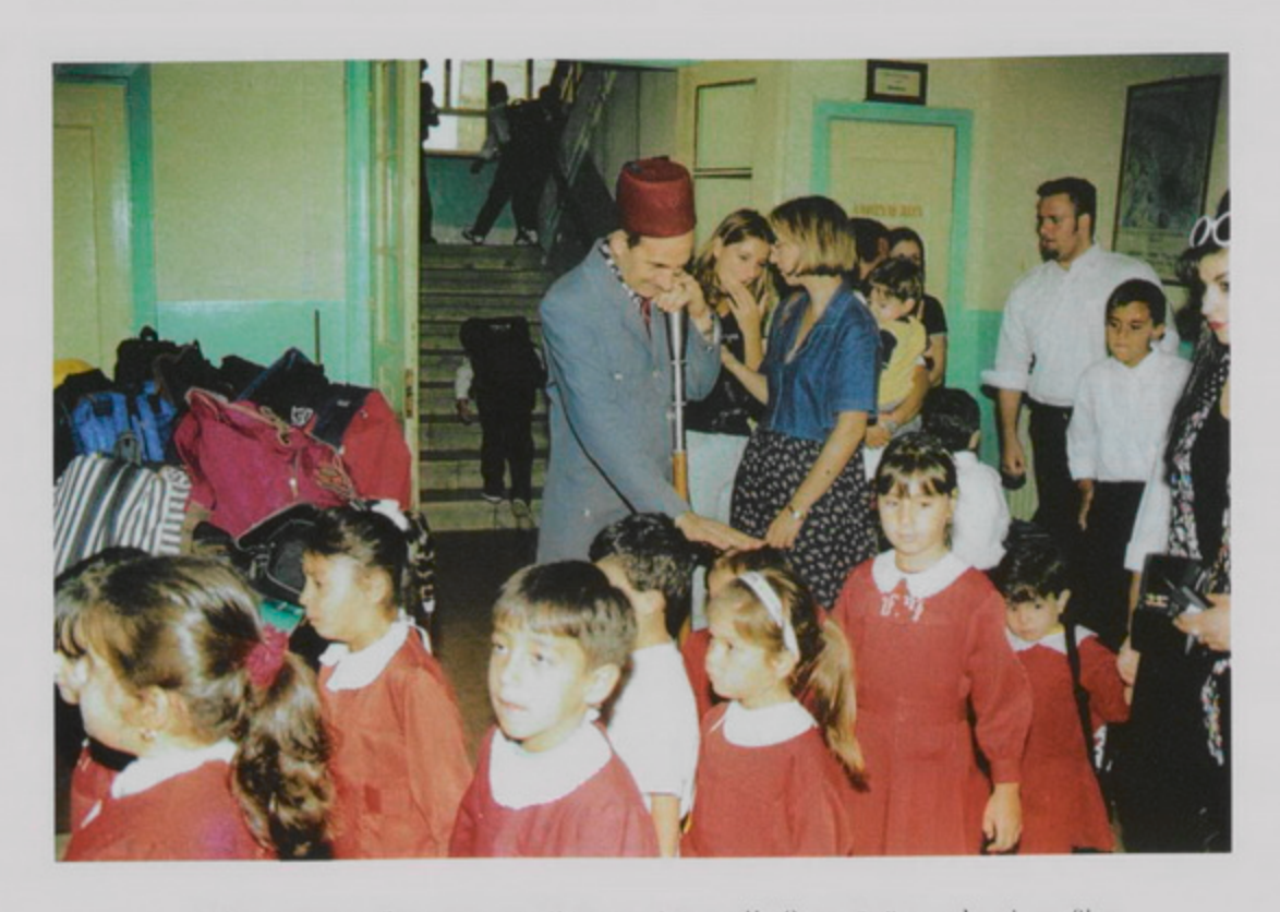
1 Սեպտ. 1998, Գշ. առաւօտ 8ին, տարեմուտ Ս. Թարգմանչաց Վարժարանի։