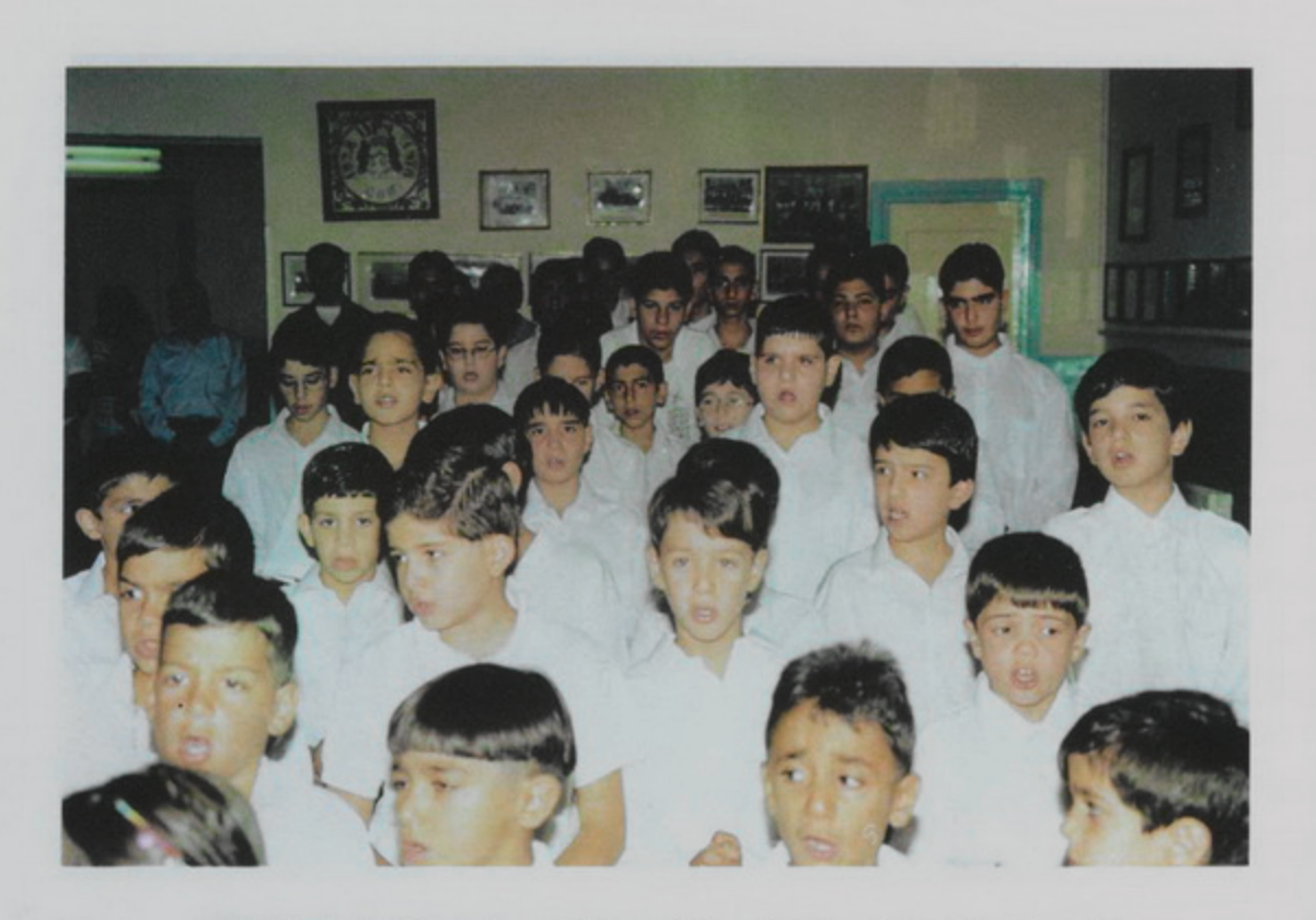
1 Սեպտ. 1998, Գշ. առաւօտ 8ին, տարեմուտ Ս. Թարգմանչաց Վարժարանի։