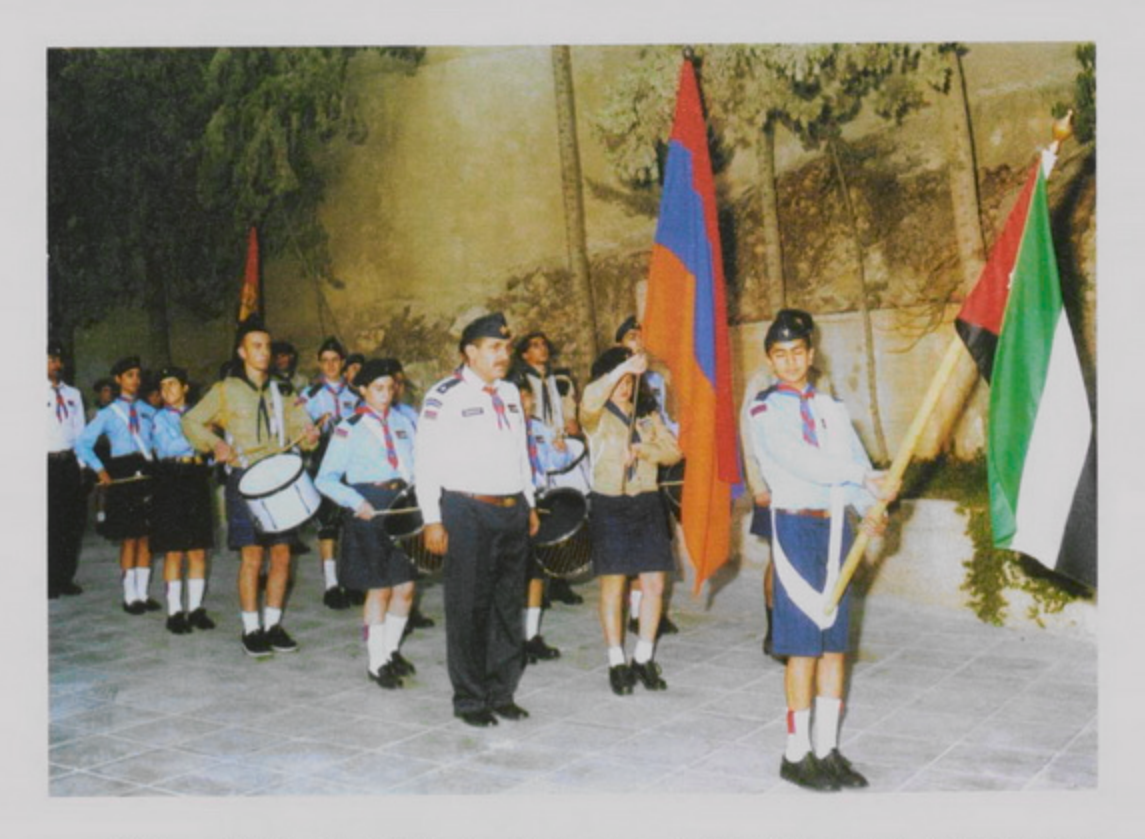
30 Սեպտ․ 1998, Գշ․ Օծում Ս․ Թադէոս եկեղեցւոյ խորանի, Ամման, Յորդանան, Հ․Մ․Ը․Միութեան եւ Ա․Մ․Միութեան սկաուտներ թափօրը կ'առաջնորդեն դէպի եկեղեցի։