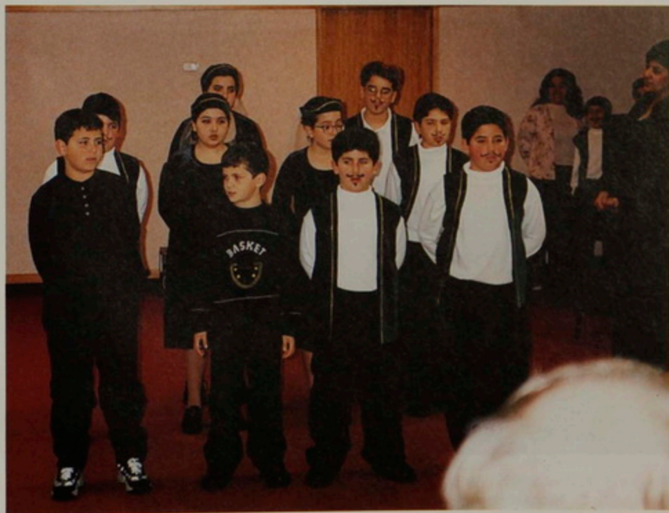
Քշ. 5 Յունիս 2000.- Auckland, New Zealand, ելոյթ հայ աշակերտներու: