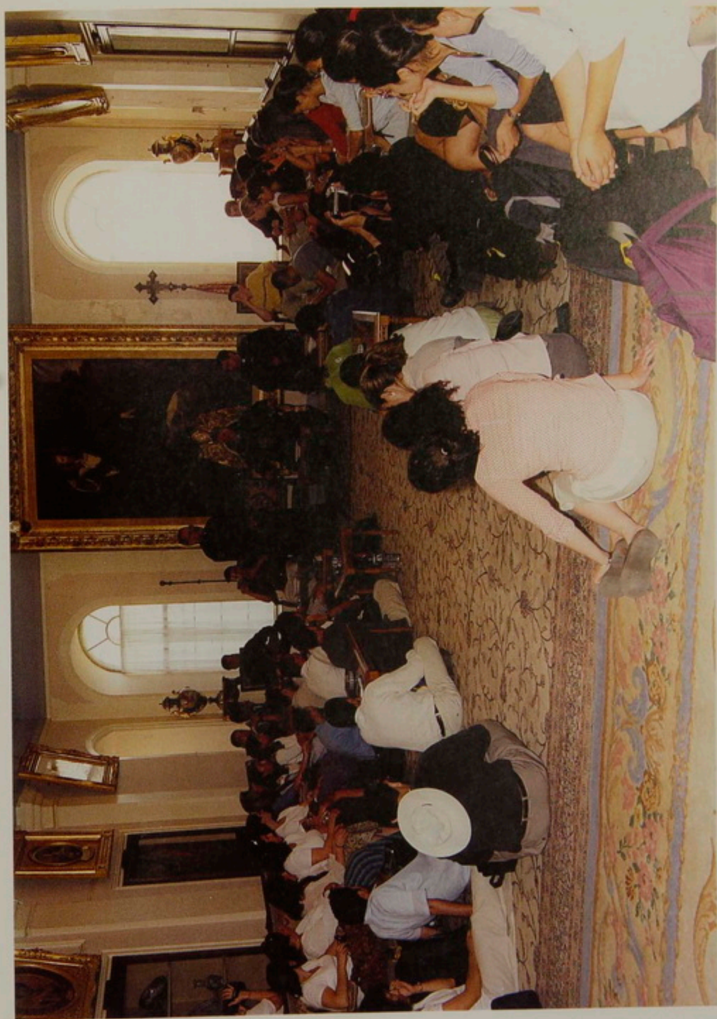
Միացեալ Նահանգաց Արեւելեան թեմն երիտասարդաց ուխտաւորական խումբը թորգոմ Պատրիարքին հետ տեսակցութեան ընթացքին, Պատրիարքարանի դահլիճին մէջ.