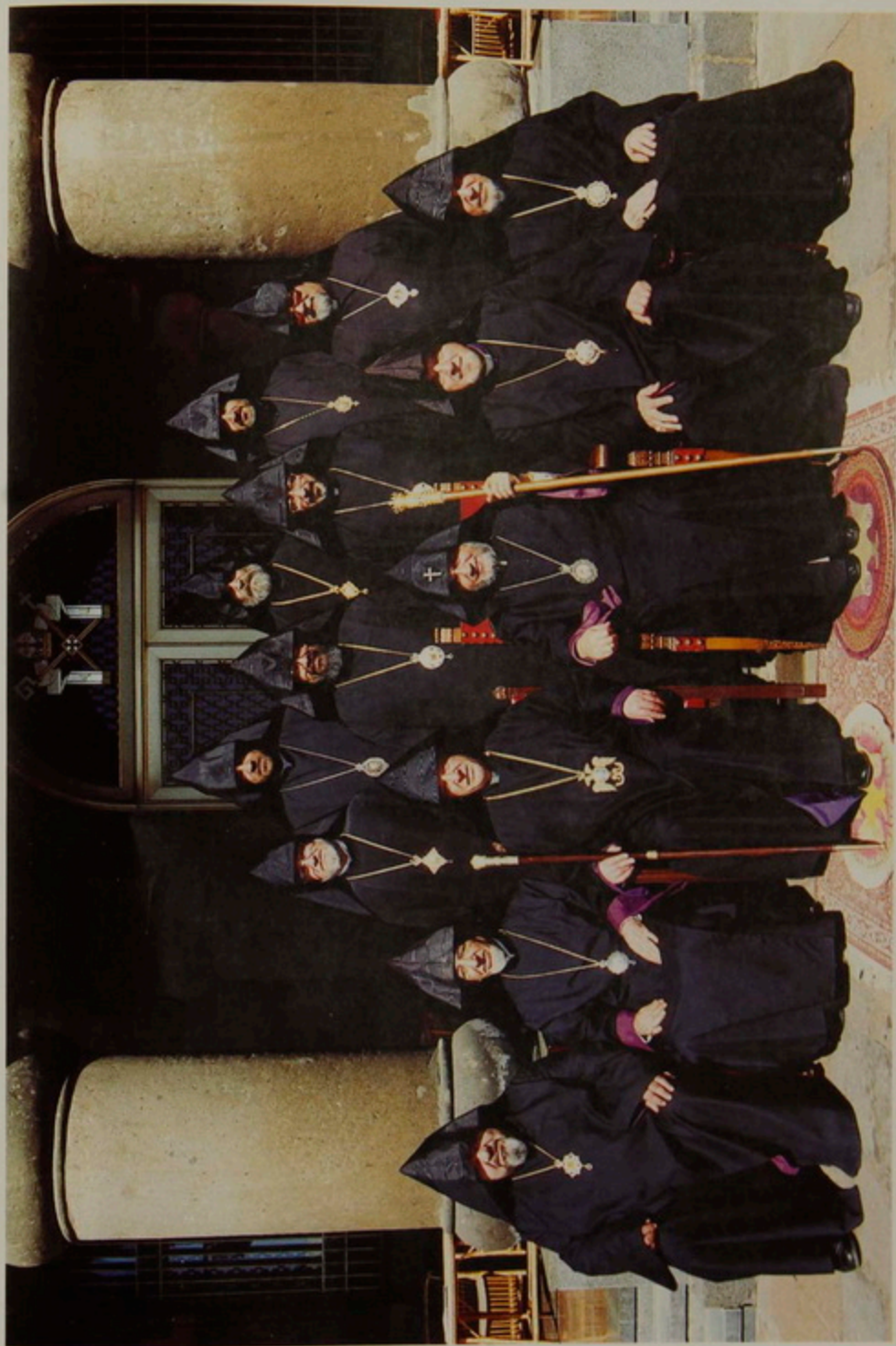
Ուրբաթ, 23 Յունիս 2000, Ս. Էջմիածին, Գերագույն Հոգևոր Խորհուրդի նիստին. Չախն Աջ. Ա. Շարֆ. Գեորգ Արք. Սարայտարեան, Զաւէն Արք. Չիլիկեան, Թորգոմ Պատրիարք Մանուկեան, Գաբրիէլ Ա. Ամենայն Հայոց Կաթողիկոս, Վաչէ Արք. Յովսէփեան, Գիւտ Արք. Նազգաշեան. Բ. Շարֆ. Ներսէս Արք. Պօղոսեան, Աղամ Արք. Պալիօզեան, Խաժակ Արք. Պարսամեան, Յուսիկ Արք. Սանթրոբեան. Կ. Շարֆ. Նաւասարդ Նպա. Կնոյեան, Պարգիս Արք. Մարտիրոսեան, Արրահամ Նպա. Մկրտիչեան.