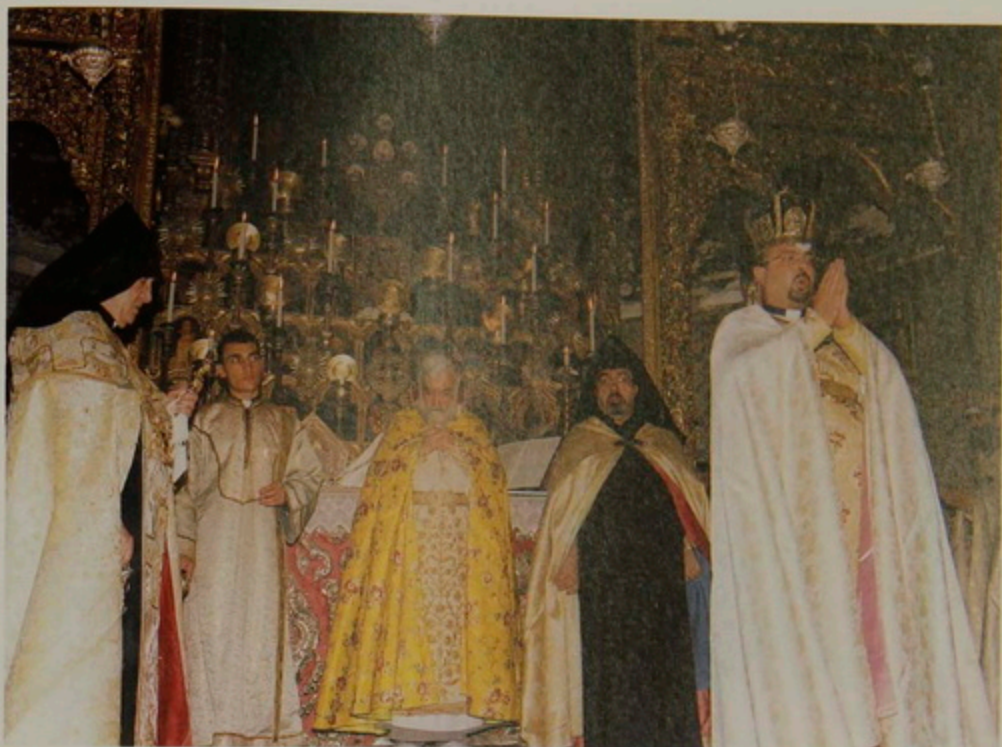
Կիր. 6 Օգոստ. 2000.- Քահանայական Օծումն ճակատի, Աջ եւ Ահեակ Ափերուն, առաջին «խաղաղութիւն ամենեցունը», եւ սկիհով պատարագելու իշխանութիւն ստանալը, Տ. Խաղ կուսակրօն քահանայի.