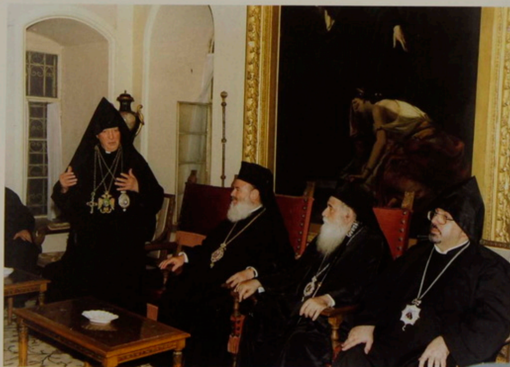
Ուրբաթ, 25 Օգոստ. 2000.- Յունաստանի Առաջնորդ Տ. Խրիսթօստուլոս Արք. եւ իր ուղեկիցները Նրուսադէմ ուխտի գալով կ'այցելեն Հայոց Պատրիարքարան: Թորգոմ Պատրիարք «Բարի Գալուստ» կը մաղթէ: