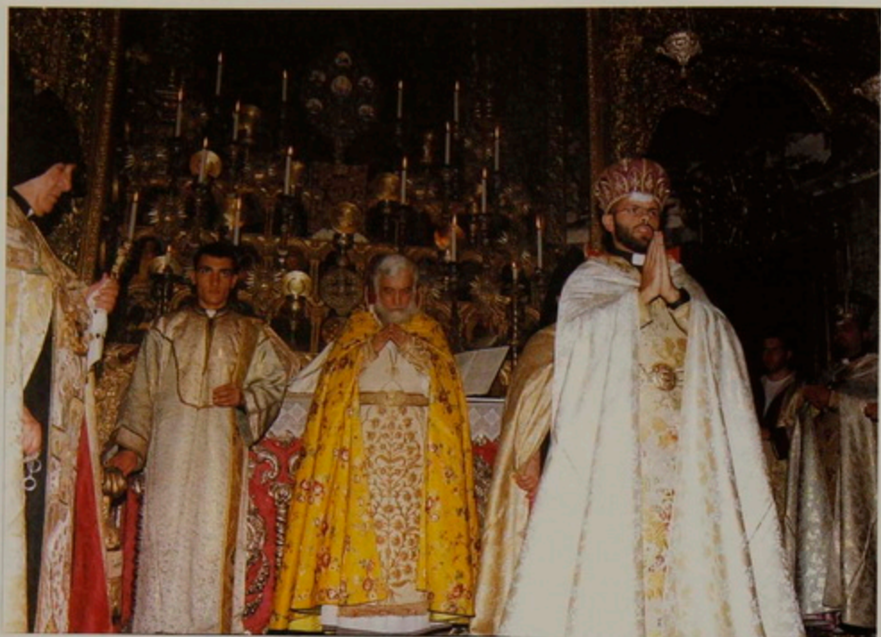
Կիր. 6 Օգոստ. 2000.- Քահանայական Օծումն Ճակատի, Աջ եւ Ահեակ Ափերուն, առաջին «խաղաղութիւն ամենեցունը», եւ սկիհով պատարագելու իշխանութիւն ստանալը, Տ. Իսահակ Կուսակրօն քահանայի.