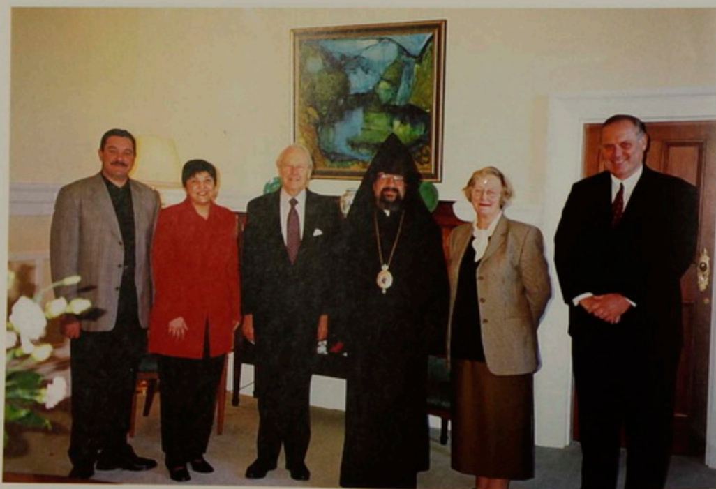
Ուրբաթ 9 Յունիս 2000. Wellington, New Zealand. Զախեն Աջ' Տէր եւ Տիկին Յակոբ եւ Սալիկ Նլորգեան, Sir Michael Hardy Boys, Governor General of New Zealand, Առաջնորդ Աղան Արք. Պալիօգեան, Lady Marie Hardy Boys, Lady Marie-ին զարմիկը՝ ձօն Զօհրապ.