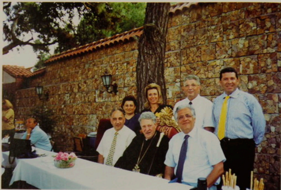
ԳՂ. 27 Յունիս 2000. Պոլսոյ Գնալը կղզիին Ս. Գրիգոր Լուսաւորիչ Եկեղեցւոյ շրջափակին մէջ Խորհուրդի եւ Տիկնանց անդամներ Թորգոմ Պատրիարքին հետ: