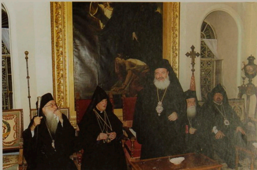
Ուրբաթ, 25 Օգոստ. 2000.- Յունաստանի Առաջնորդ Տ. Խրիսթոստոս Արք. և իր ուղեկիցները Երուսաղեմ ուխտի գալով կ'այցելեն Հայոց Պատրիարքարան: Պատույ Հիւրը իր սրտի մաղթանքը արտայայտեց և Պատրիարք Սրբազանին նուիրեց 2000 ամեակի առիթով պատրաստուած խաչանձեռն մետալիոն մը.