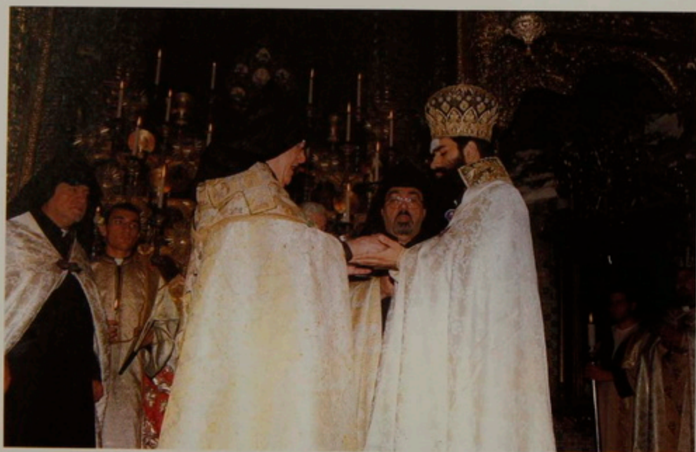
Կիր. 6 Օգոստ. 2000.- Քահանայական Օծումն Ճակատի, Աջ եւ Ահեակ Ափերուն, առաջին «խաղաղութիւն ամենեցունը», եւ սկիհով պատարագելու իշխանութիւն ստանալը, Տ. Ղևոնդ Կուսակրօն քահանայի.