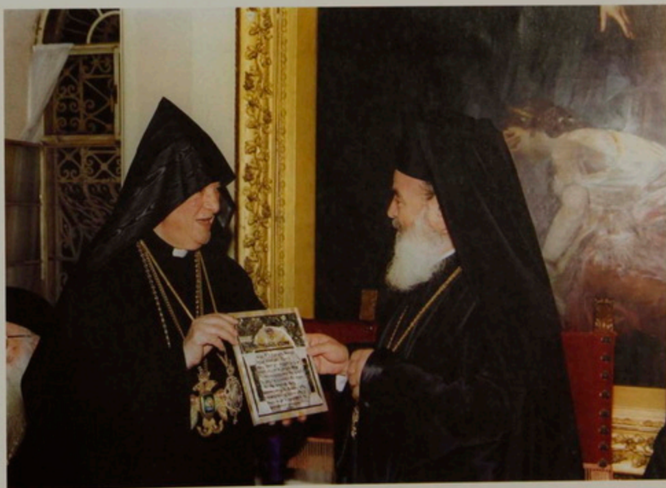
Ուրբաթ, 25 Օգոստ. 2000.- Թորգոմ Պատրիարք, Յունաստանի Առաջնորդ Տ. Խրիսթոստոս Արքեպիսկոպոսին կը նուիրէ սատափէ զարդագրուած Հայերէն «Հայր Մեր»ը.