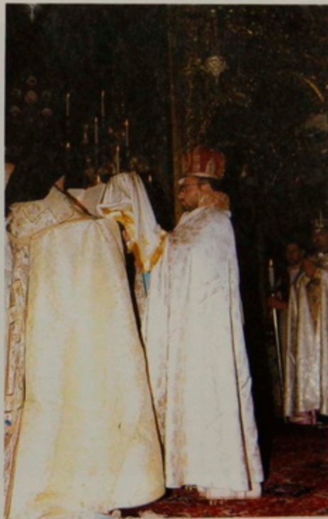
Կիր. 6 Օգոստ. 2000.- Քահանայական Օծումն Ճակատի, Աշ և Ահեակ Ափերուն, առաջին «Խաղաղություն ամենեցունը», և սկիհով պատարագելու իշխանություն ստանալը, Տ. Նորայր Լուսակրօն փահմայի.