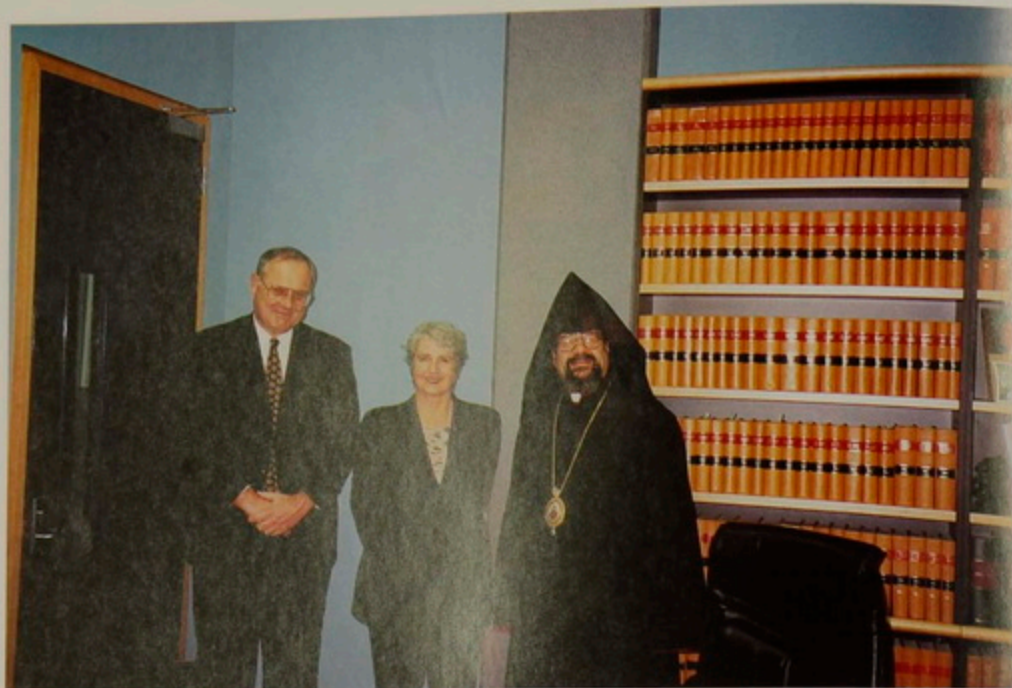
Քշ. 5 Յունիս 2000.- Auckland, New Zealand. Զախեն Աջ' ձօն Զօհրապ, Dame Sian Serpoohe Elias, հայազգի Chief Justice, Առաջնորդ Աղան Արք. Պալիօգեան: