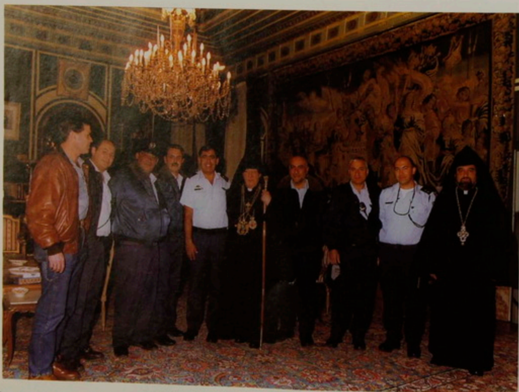
Նշ. 18 Յուն. 2001- Երուսաղեմի Ոստիկանապետ և օգնականներ Պատրիարք Սրբազան Հօր այցելեցին Հայոց Մննդեան տօնին շնորհատրութեան և դէպի Բեթլեհեմ թափօրով երբի կարգադրութեան համար