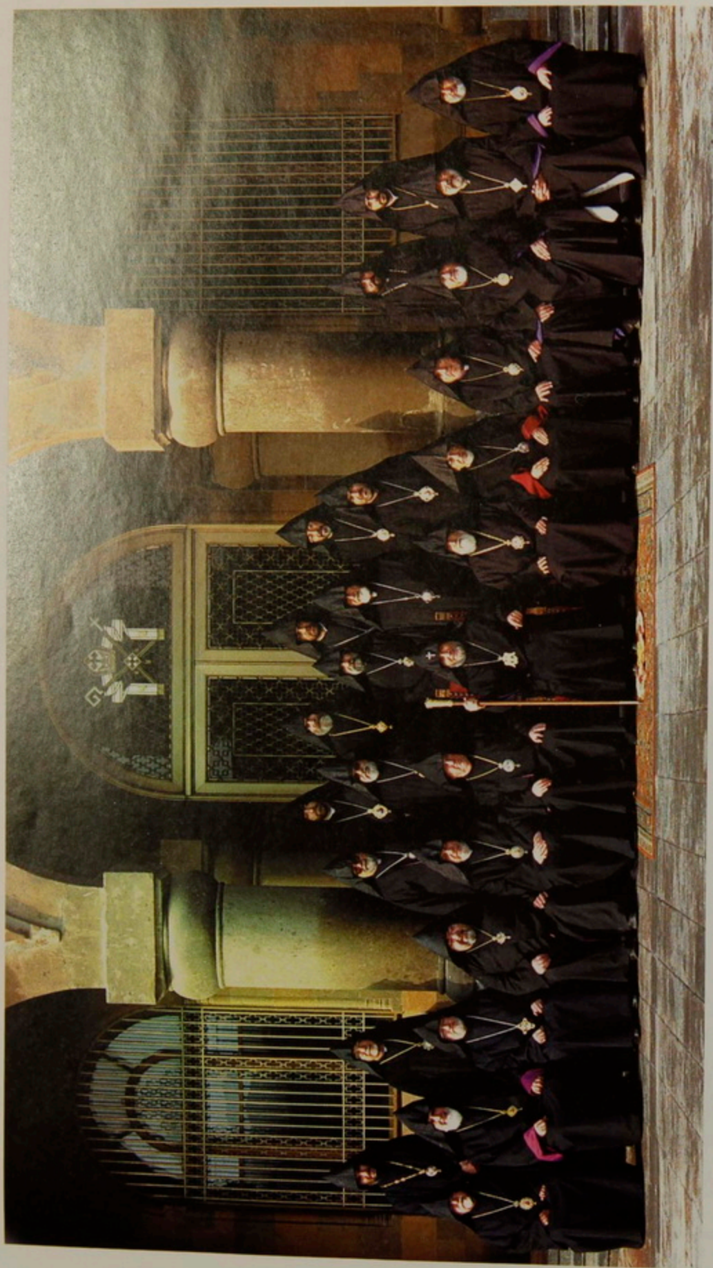
Եր. 90 Գեկտեմբեր 2000... Մայր Աթոռ Ս. Էջմիածնի վեհաբանի մուտքին խմբավոր Ամենայն Հայոց վեհ. Կարողիկոս Գաբրիել Բ.ի հետ բոլոր Առաջնորդ հոգևորականները որոնք մասնակցեցան Խոր վերապեն Ս. Գրիգոր Լուսավորչի լապտերի լոյսը ստանալու եւ իրենց բեմերում տանելու