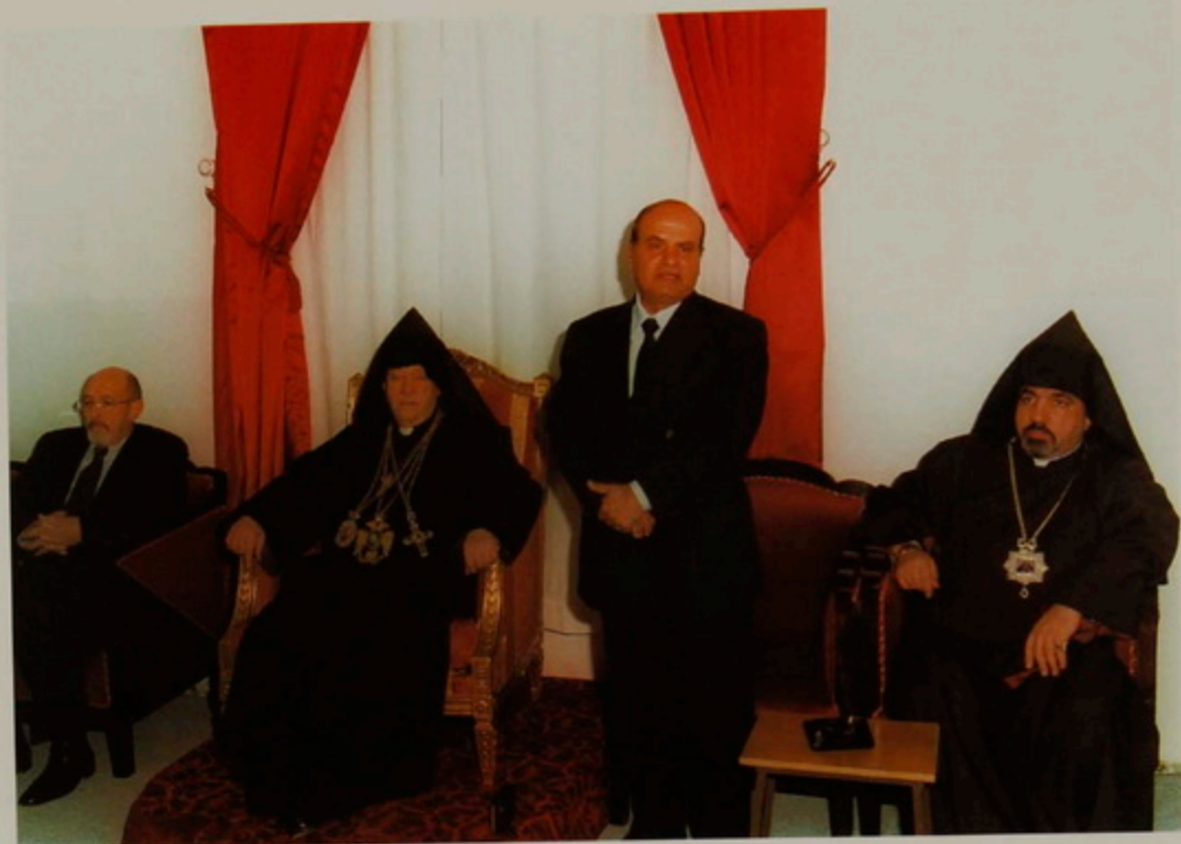
Նշ. 18 Յուն. 2001.- Հայոց Վանքի Տեսչարանին մէջ, Պաղեստինեան իշխանութեան նախագահ Նասրը Արաֆաթի քարի մաղրանգները կը ներկայացնէ Տֆր. Էմիլ Ճարնուի