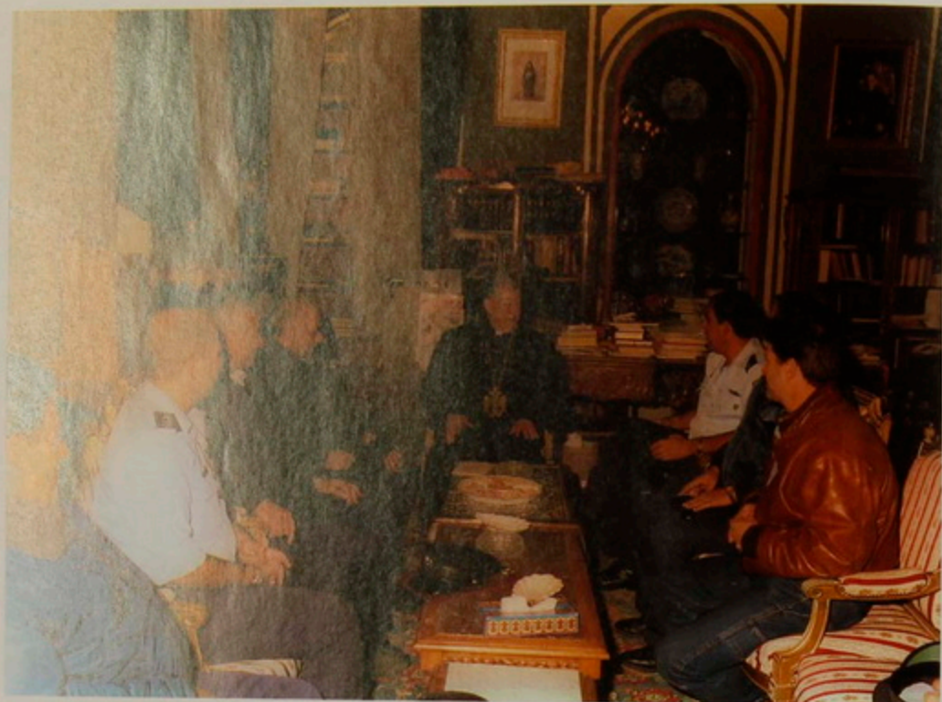
Նշ. 18 Յուն. 2001- Երուսաղեմի Ոստիկանապետ և օգնականներ, Հայոց Մննդեան Տօնին առիթով առաւօտուն Պատրիարք Սրբազան Հօր շնորհատրութեան եկան