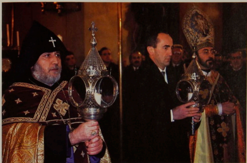
Կիր. Յ1 Դեկտեմբեր 2000. Խոր Վիրապէն Ս. Գրիգոր Լուսաւորչի Լապտերին լոյսէն լուցուած լապտեր Ս. Էջմիածնի Տաճարին մէջ ի ձեռին ունին Ամենայն Հայոց Վեհափառ Կաթողիկոսը Գարեգին Բ. եւ ՀՀ Նախագահ Ռուպերտ Գոչարեան: Առընթերակից՝ Տ. Խաժակ Արք. Պարսամեան