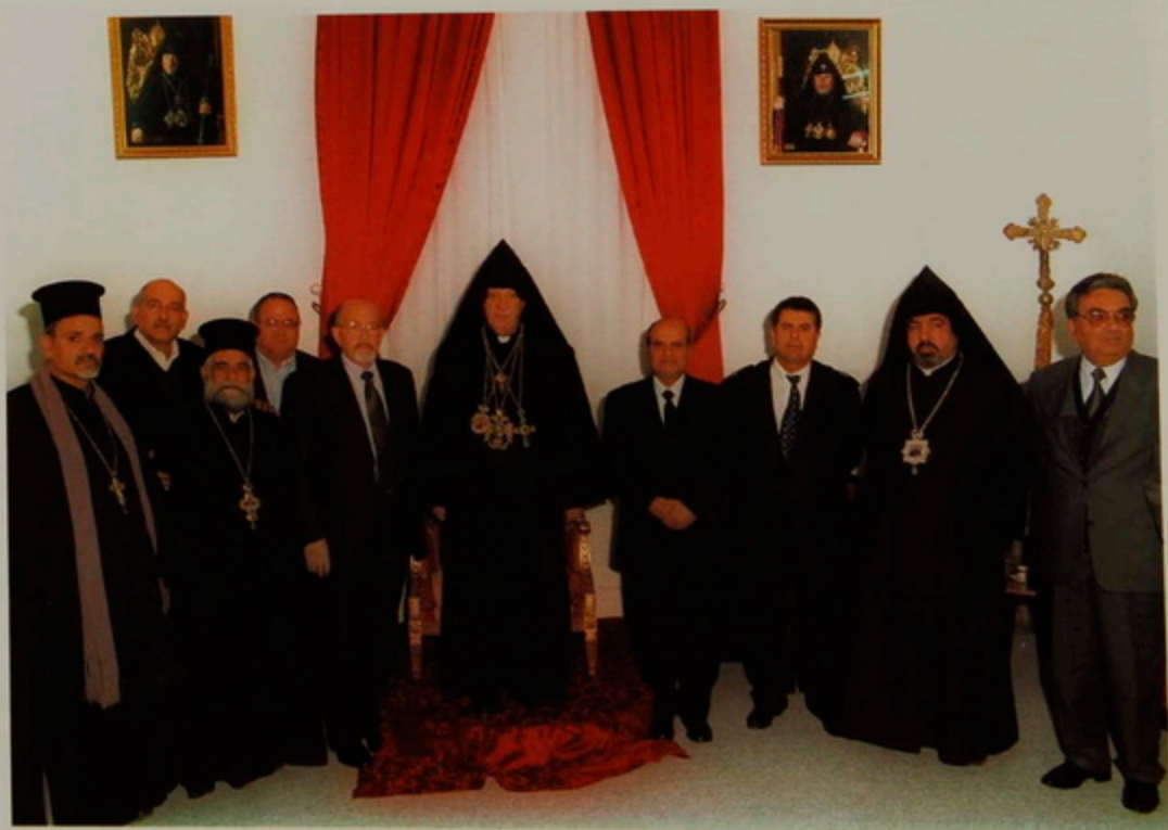
Նշ. 18 Յուն. 2001.- Հայոց Ծնունդին առիթով, Հայոց Վանքի տեսչարանին մէջ Պաղեստինեան իշխանութեան եւ Բեքդէիմի փաղափայտարանի ներկայացուցիչներ, եւ հոգեւորականներ