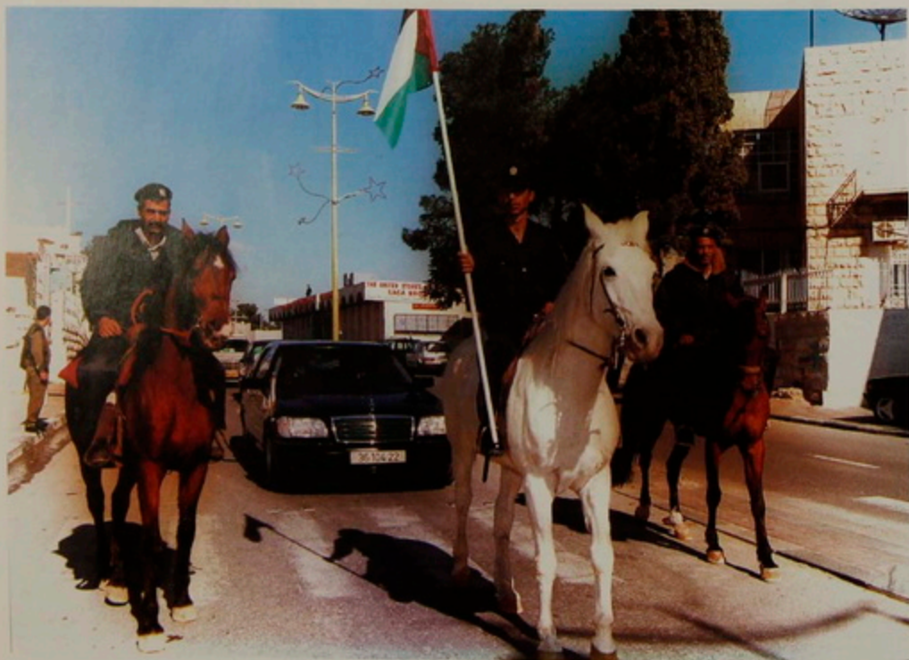
Նշ. 18 Յուն. 2001.- Հայոց Մնունդին դէպի Բերդիկէմ նամբու վրայ, Ռաբէլի գերեզմանէն սկսեալ Իսրայէլեան ձիաւորները կը փոխարինուին Պաղեստինեան ձիաւորներով