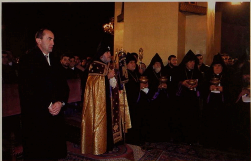
Կիր. Յ1 Դեկտեմբեր 2000. Ս. Էջմիածնի Մայր Տաճարի մէջ, Խոր Վիրապէն բերուած լոյսէն իրենց ձեռքի լապտերները վառելու կանգնած են Ամենայն Հայոց Հայրապետի ձախին՝ Ամբրիլիասէն Սեպուհ Նպս. Սարգիսեան, Նրուսաղեմէն՝ Սեւան Նպս. Դարիպեան, Միացեալ Նահանգաց Արեւմտեան Թեմի Առաջնորդ Վաչէ Արք. Յովսէփեան, Ռումանիոյ եւ Պուլկարիոյ Առաջնորդ Տիրայր Արք. Մարտիկեան եւ ցերկայ միւս Առաջնորդները: