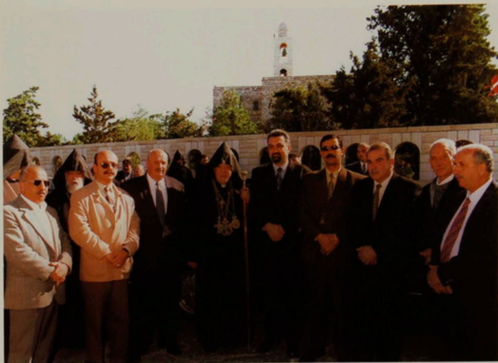
Նշ. 18 Յուն. 2001- Հայոց Ծննդեան տօնին առիթով դէպի Բեքդեհեմ նամբուն վրայ, Յունաց Ս. Նղիայի վանքին մօտ դիմաւորողներուն մէջ են Բեքդեհեմի, Պէյք Ճալայի եւ Պէյք Սահուրի ֆաղաֆապետներ եւ ներկայացուցիչներ