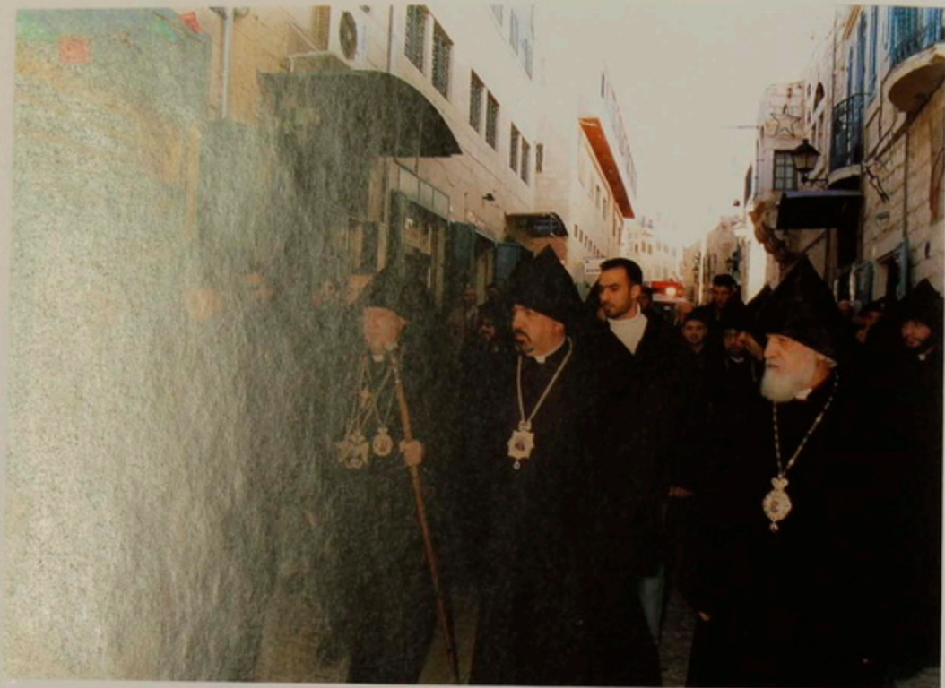
ԵՂ. 18 Յուն. 2001.- Հայոց Մնունդին Բերդեհէմ քաղաքի մուտքին քափօրը քալելով կը յառաջանայ դէպի Մսուրի հրապարակը: Զախէն Աջ՝ Վաղարշ Եպս. Խաչատուրեան, Արիս Եպս. Շիրվանեան, Պատրիարք Սրբազան, Լուսարարապետ Նուրիան Արք. Մանուկեան, Սեւան Եպս. Ղարիպեան