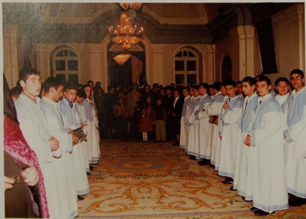
Կիր. 14 Յուն. 2001.- Ըստ Հին Տոմարի Կաղանդ Սրուսաղէմի մէջ: Պատարագէն յետոյ Միաբանութիւն և ժողովուրդ Պատրիարքարանի դահլին հաւաքուած: Թարգմանչաց Նախակրթարանի աշակերտ մը ծաղկեփունջ մը ներկայացնելով իր ուղերձը կ'ընթեռնու: