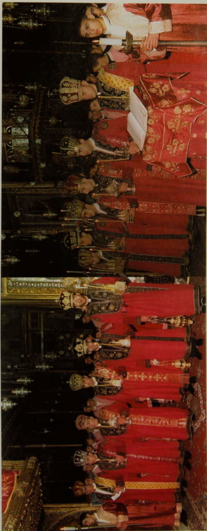
ՌՆ. 8 ցուն. 2001.- Սարկազաց դար, այլազան բազերով, ինկամաններով և բուրվաններով «Փառք և Բարձրունս» երգէն մինչև «Առաւօտեան» ժամերգութեան վերջը հանդիսատրապէս պաշտամունքին կը մասնակցին