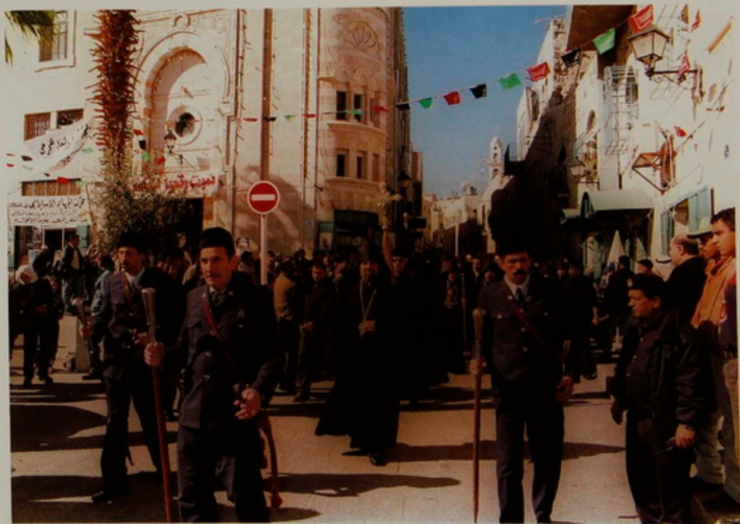
Նշ. 18 Յուն. 2001.- Հայոց Ծնունդին Բեքդեհեմ քաղաքի մուտքին, Պատրիարք Սրբազան Հայրը և բաժնակալները, ինքնաշարժերէն դուրս ելած, քալելով կը յառաջանան դէպի Մսուրի հրապարակը