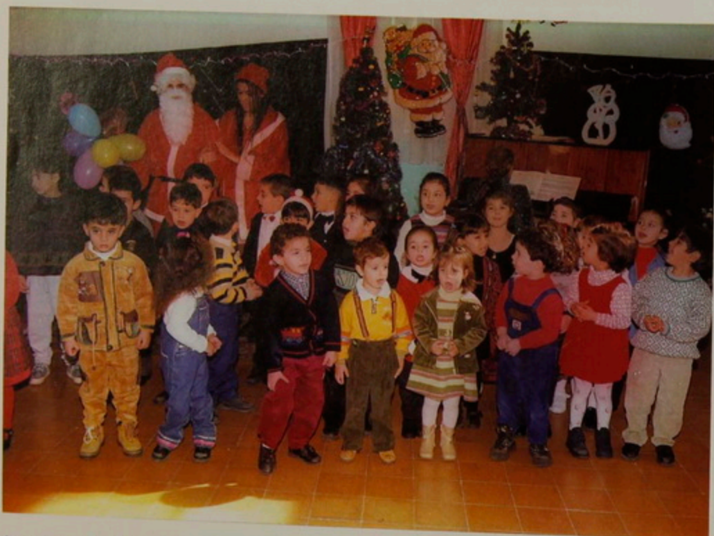
Ուր. 29 Դեկտեմբեր 2000. Սրբոց Թարգմանչաց Վարժարանի Մանկապարտեզի մանուկները Նոր Տարուան յայտագիրով եւ «Կաղանդ Պապայի» այցելութեամբ