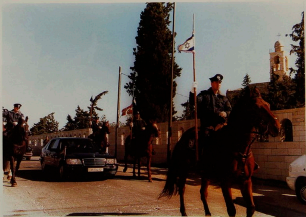
Նշ. 18 Յուն. 2001- Հայոց Ծննդին, դէպի Բեքդեհեմ նամբու վրայ, Յունաց Ս. Նղիայի վանքին մօտ Իսրայէլեան ճիւղերներ Պատրիարք Սրբազան Հօր ինքնաշարժին ֆովերէն կ'ընկերանան մինչեւ Ռաֆէլի գերեզման