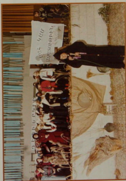
Շաբաթ 21 հեկտ. 2002. Նոր Տարւան առիթով, Քաղաքացիաց երկրորդական վարժարանի աշակերտութեան կողմէ բեմադրութիւն «Դէպի երկիր» բաղերգութեան, ժառանգաւորաց վարժարանի սրահին մէջ: