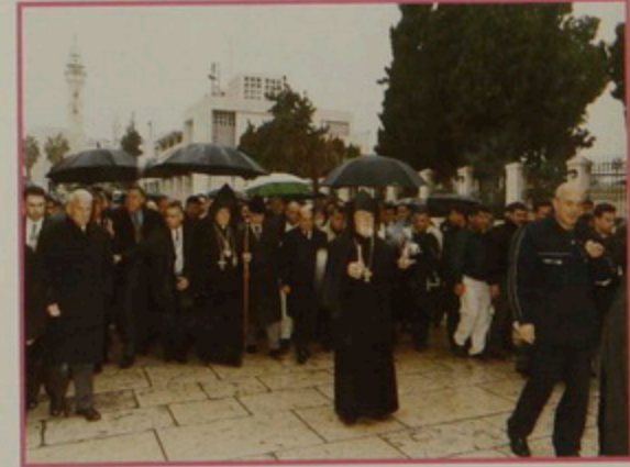
Շաբաթ 18 Յնվր. 2008. Հայկական Մեծնդին Բերդեհեւ մուտք, հրապարակին վրայ դիմաւորում Պաղեստինեան Իշխանութեան ներկայացուցիչներու կողմէ: