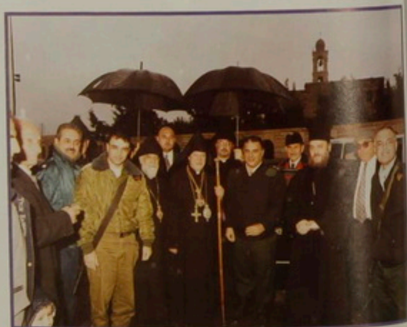
Շաբաթ 18 Յնվր. 2003. Հայկական Մեծնդի Ճրագալոյցի առաւօտուն երուսաղէմի Ընդհանուր Ոստիկանապետ եւ օգնականներ կ'այցելեն Պատրիարքարան, Մեծնդ շնորհաւորելու եւ բափօրը առաջնորդելու դէպի Բերդեհէմ: