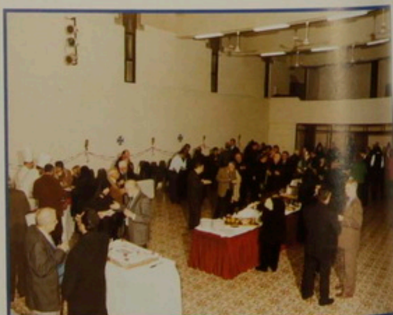
Կիր. 5 Յնվր. 2003. Հիւրասիրուրիւն Առաքելական Ս. Աթոռոյ տարեդարձին առիթով, Ժառանգաւորաց Վարժարանի մեծ սրահին մէջ: