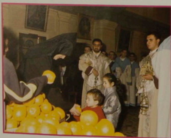
ԳԶ. 14 ՅԵՎՐ. 2008. Նոր Տարի, Պատրիարքարանի դահլիճին մէջ, Սրբոց Թարգմանչաց Վարժարանի Մանուկներու ուղերձը եւ նուէրները: Պատրիարք Սրբազան նարինջ կը բաժնէ: