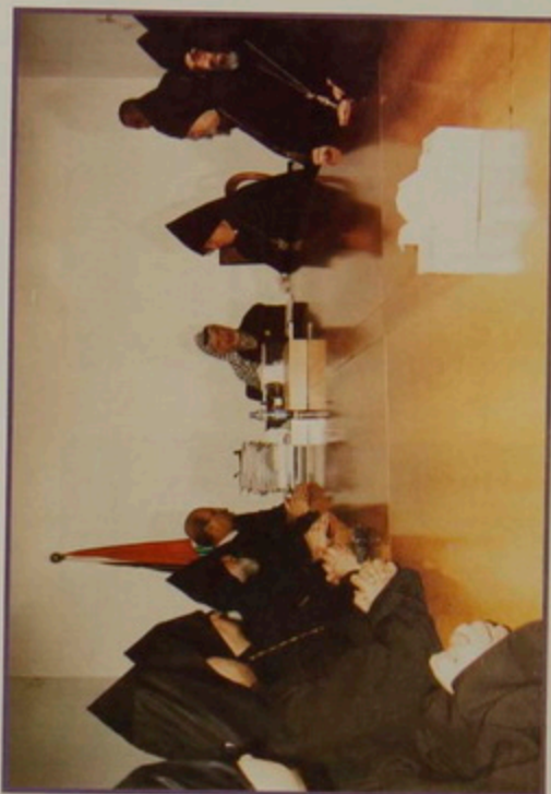
Ուրբաթ 17 Յնվր. 2003. Հայկական Մեծնոցի առիթով, Միաբանութեան անդամներով շնորհատորանքի այցելութիւն Պաղեստինեան Իշխանութեան Նախագահի Նասրը Արաֆատին, Ռամալլայի իր գրասենեակին մէջ: