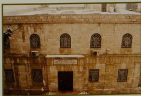
24-26 Փետրուար 2003, Երուսաղէմի ձիւնամրրիկ: Տեսարաններ Ս. Յակոբեանց Տաճարի մուտքի եւ Մեծ Բակի, Վաճի տանիքներու, Հին Ճեմարանի, Թարգմանչաց Վարժարանի բակի, Խաղավայրի, Պարտիզաբաղի, Ժառանգաւորաց Վարժարանի, Պատրիարքարանի եւ Կիւլպէնկեան Մատենադարանի: