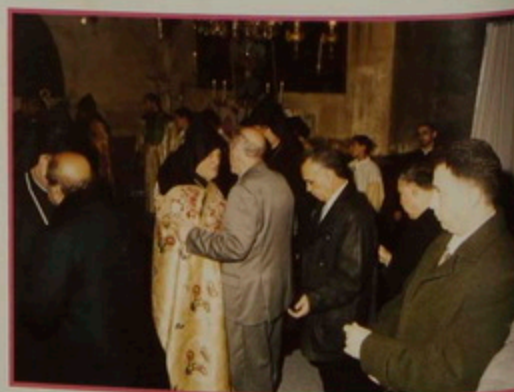
Շաբաթ 18 Յնվր. 2008. Հայկական Մեծնդի ծրագալոյց, կէս-գիշերուան պաշտամունք Բրիտտոսի Մենդեան Բարայրին մէջ, Պաղեստինեան Իշխանութեան ներկայացուցիչներու մասնակցութեամբ: