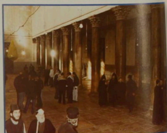
ԳԶ. 31 Դեկտ.- 2002. Բերդեհեմ Ս. Մենդեան Տանարի տարեկան ընդհանուր մաքրութիւն, Հայ, Յոյն եւ Թրանսիսկիան Միաբանութեանց կողմէ, իւրաքանչիւրը իր իրաւաստութեան սահմանին մէջ, Պաղեստինեան Իշխանութեան ներկայացուցիչներու ներկայութեան: