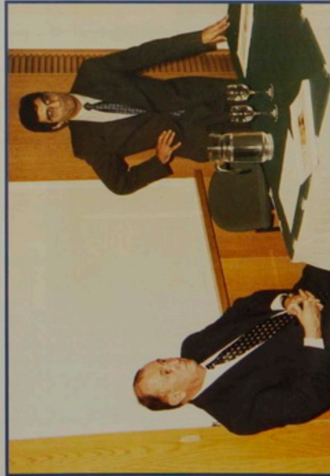
Ք2. 25 նոյ. 2002. Երուսաղէմի Երրայական Համալսարանի մէջ դասախօսութիւն, Հայաստանի Հանրապետութեան Արտաւին Գործոց Փոխ-Նախարար Ռուբէն Շուգարեանի, Հայաստանի ներկայ Բաղաճական Կազմութեան մասին: