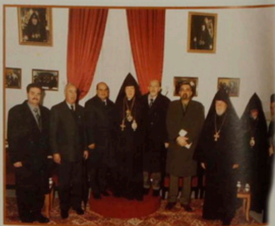
Շաբաթ 18 Յնվր. 2003. Հայկական Մեծնդին Բերդենկմ մուտի բափօրը կը բարձրանայ Հայոց Վանգ: Մաղրանէի խօսքեր՝ Բերդենկմի Քաղաքապետ Հաննա Նասսրի, Պաղեստինեան Իշխանութեան նախագահ Նասր Արաֆաթի ներկայացուցիչ Տէր. Էմիլ Ժարնուի: