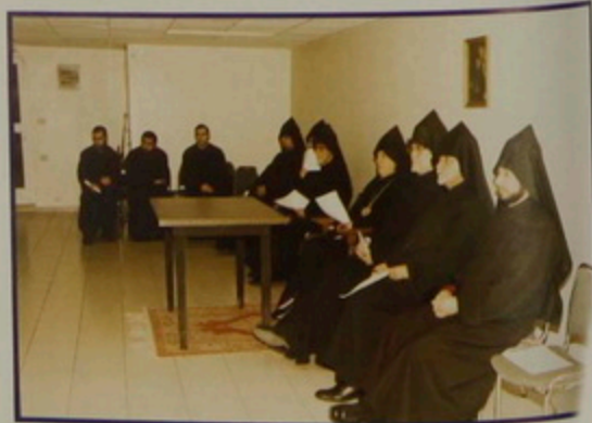
ԵՂ. 6 Մարտ 2003, Սրբոց Վարդանանց հանդիսութիւն ժառանգւորաց Վարժարանի սրահին մէջ: Ժառանգւոր սաներու յայտագիրը՝ խմբերգներով, ասմունքով, նուագով եւ տեսնախօսութեամբ: