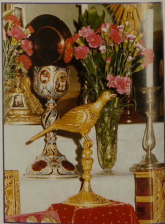
Շաբաթ 11 Յնվր. 2003. Տօն Որդւոց Որոտման, Յակոբայ Առաքելայն եւ Յովհաննու Աւետարանչին: Քարոզիչ՝ Թորգոմ Պատրիարք: Ս. Գլխադրի մատուռին կից շարժական սեղանը զարդարանցներով: