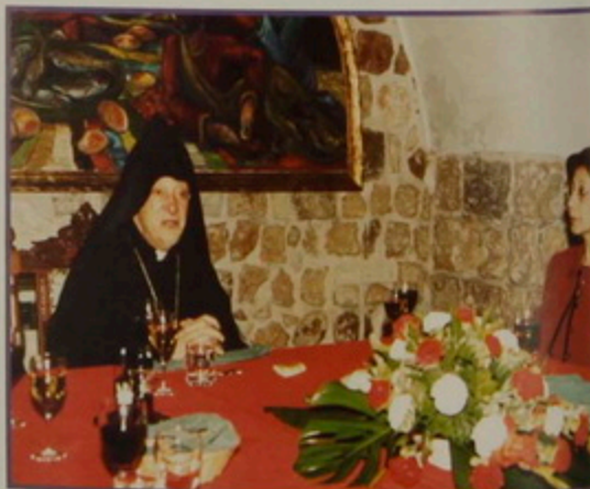
Բշ. 25 նոյ. 2002. Հայաստանի Հանրապետության Արտաքին Գործոց Փոխ-Նախարար Ռուբեն Շուգարեանի այցը Պատրիարքարան, Սրբոց Յակոբեանց Մայր Տաճար, Միտրանական սեղանատուն ընթրիքի, ընկերակցութեամբ Փարիզի եւ Իսրայէլի լիազօր Դեսպան՝ Էդուարդ Նալբանդեանի, Արտգործնախարարի Խորհրդական՝ Կարէն Նազարեանի, Մերձաւոր Արեւելի Հարցերով Վարչութեան պետ՝ Կարէն Միրզոյեանի, Հիւպատոսական Վարչութեան պետ՝ Արմէն Եկանեանի, Հայաստանի եւ Վրաստանի Իսրայէլեան Դեսպանուհի՝ Ռիվա Գօհէնի: