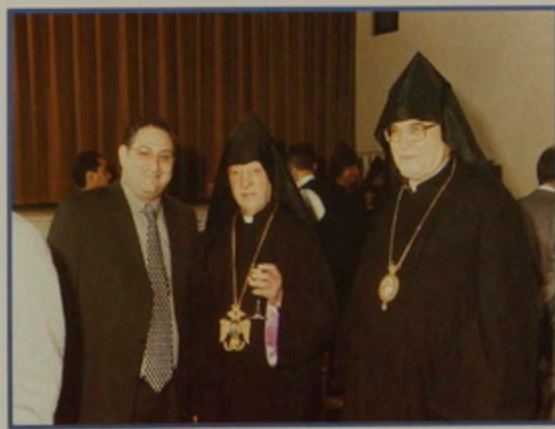
Կիր. 5 Յնվր. 2008. Հիւրասիրութիւն Առաքելական Ս. Արողոյ տարեդարձին առիթով, ժառանգաւորաց Վարժարանի մեծ սրահին մէջ: Հրաւիրեալներու մէջ են Խորայէլեան եւ Պաղեստինեան ներկայացուցիչներ, Պետութեանց Հիւպատոսներ, Կրօնական համայնքներու Հոգեւոր Պետեր եւ ներկայացուցիչներ: