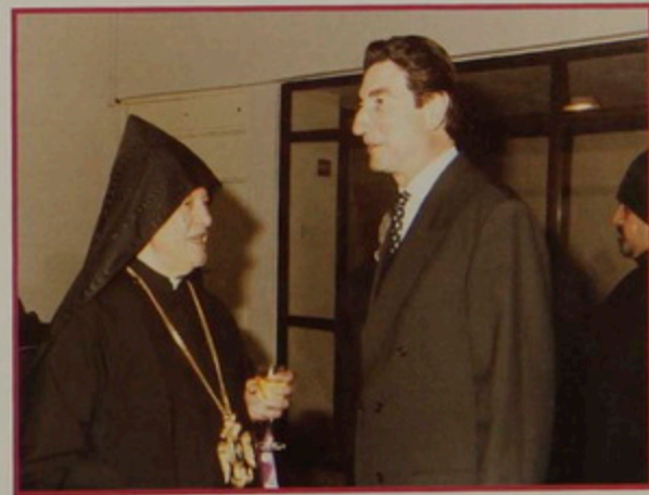
Կիր. 5 Յնվր. 2003. Հիւրասիրութիւն Առաքելական Ս. Աթոռոյ տարեդարձին առիթով, Ժառանգաւորաց վարժարանի մեծ սրահին մէջ: