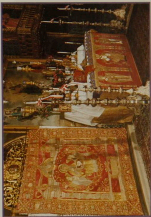
Շաբաթ 11 Յնկր. 2003. Տօն Որդւոց Որոտման, Յակօրայ Առաւելոյն եւ Յովհաննու Աւետարանչիկն: Պատարագիչ՝ Թորգօմ Պատրիարք, Ս. Դլխաղրի մատրան մէջ: