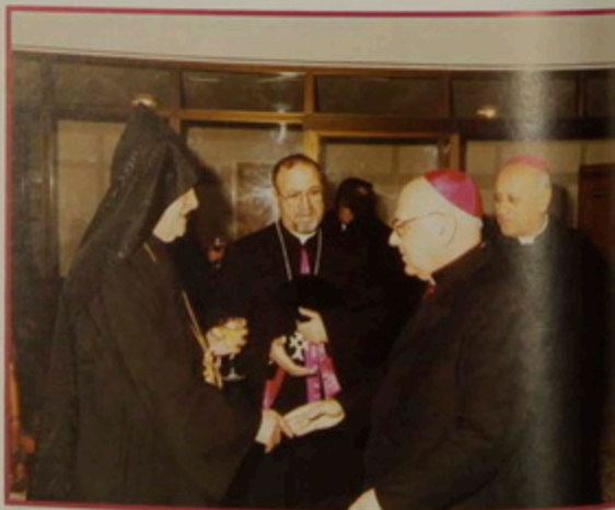
Կիր. 5 Յնվր. 2008. Հիւրասիրութիւն Առաքելական Ս. Աթոռոյ տարեդարձին առիթով, Ժառանգաւորաց Վարժարանի մեծ սրահին մէջ: