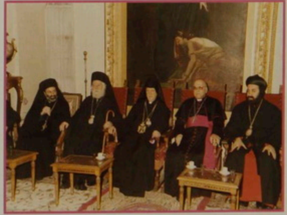
Գշ. 21 Յնվր. 2003. Հայկական Մճուճդի առիբով Պատրիարքարանի դահլիճին մէջ շճորհաւորանքի համար այցելող Յունաց եւ Լատինաց Ամեն. Պատրիարքներ, Յրանչիսկեան, Կարողիկէ, Լուտերական, ԱՅկլիւան, եւ Ղպտի, Ասորի, Հապէշ Ուղղափառ եկեղեցիներու Հոգեւոր Պետեր եւ ճերկայացուցիչներ: