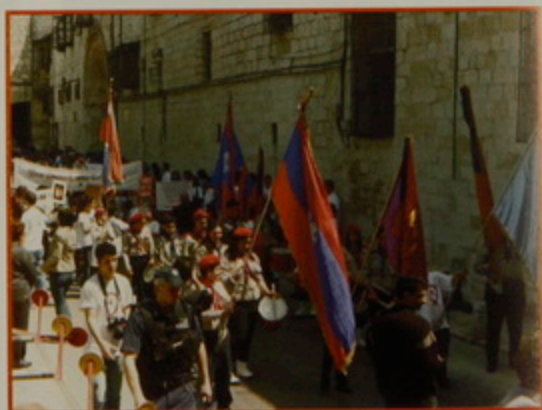
Գշ. 24 Ապրիլ 07.- Ապրիլեան Եղեռնի 92րդ ամեակին առիթով Հոգեհանգստեան Պատարագ եւ Յուշատօն դէպի Ս. Փրկիչ գերեզմանատան Արարայի Յուշարձանը: