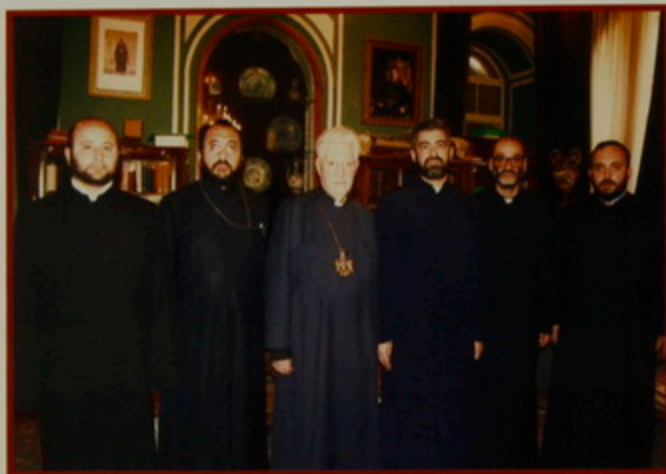
Մայր Արոտ Սուրբ Էջմիածնէն Գարրիէլ Արդ. Սարգսեան, Միքայէլ Եպս. Աջապահեան, Թորգոմ Պատրիարք, Սիօն Եպս. Աղամեան, Թադէոս Վրդ. Զիրիկեանց, Յովակիմ Վրդ. Մանուկեան: