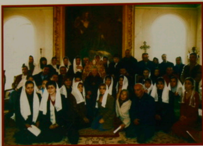
Հայ Ուխտաւորներ Հայաստանէն