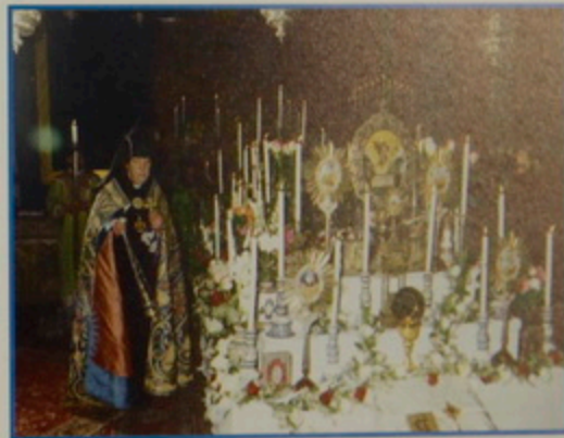
Աւագ Ուրբար - Կարգ Թաղման, 6 Ապրիլ 07.- Մեկաչո՛ք երգեցողութիւն «Ս. Աստուած որ բաղեցար» երգի, նախատօնակ եւ «Խաչի Քո Քրիստոս» երգի երիցս խնկարկութիւն: